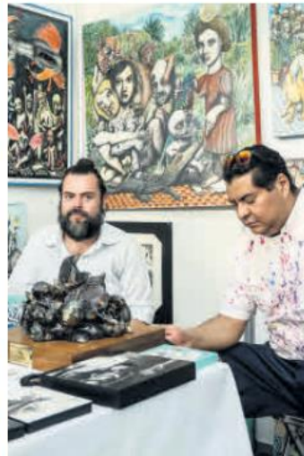
TALENTO. Diversos artistas expusieron su trabajo.