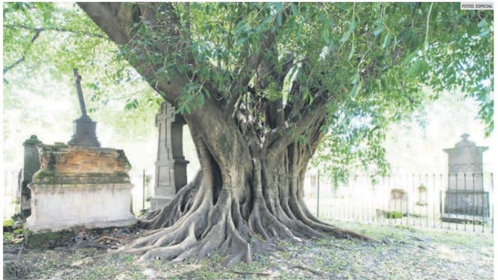
ÁRBOL DEL VAMPIRO DEL PANTEÓN DE BELÉN. Tiene 135 años, según la Dirección de Medio Ambiente.