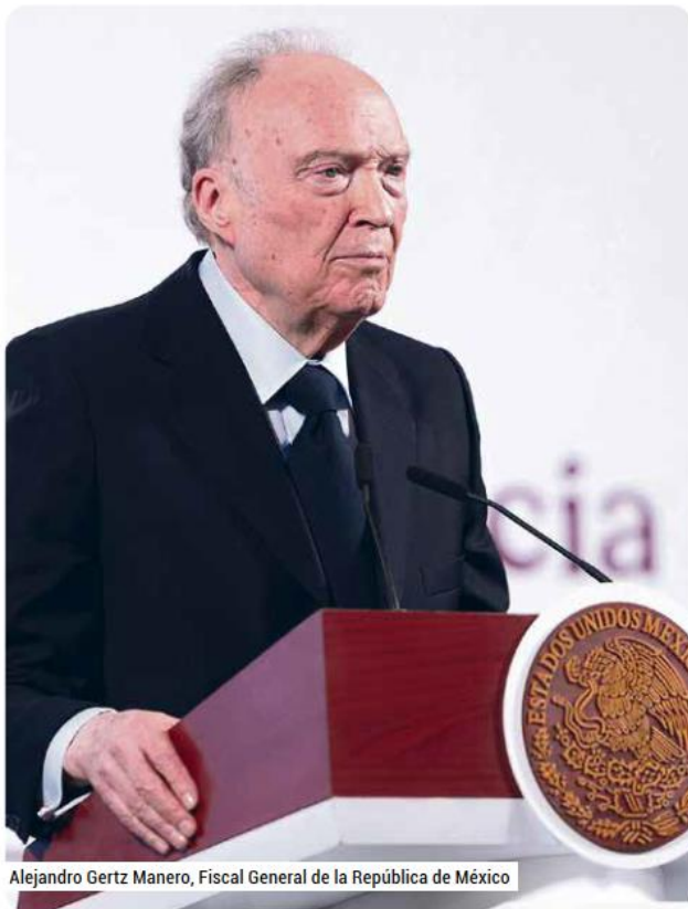
Alejandro Gertz Manero, Fiscal General de la República de México