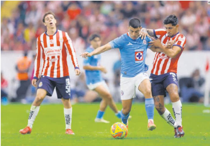
SIN FORMA. El Guadalajara tuvo varias oportunidades claras de gol, pero fue víctima de su falta de contundencia. El Cruz Azul supo aprovechar los errores del rival y se quedó con los tres puntos en la cancha del Jalisco.