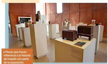
Piezas que hacen referencia a la historia del tequila son parte de la exposición.

■ Clases de Tequila: Un laboratorio olfativo diseñado para descubrir las sutiles y características sensoriales que distinguen las diferentes variedades y niveles de maduración del tequila.