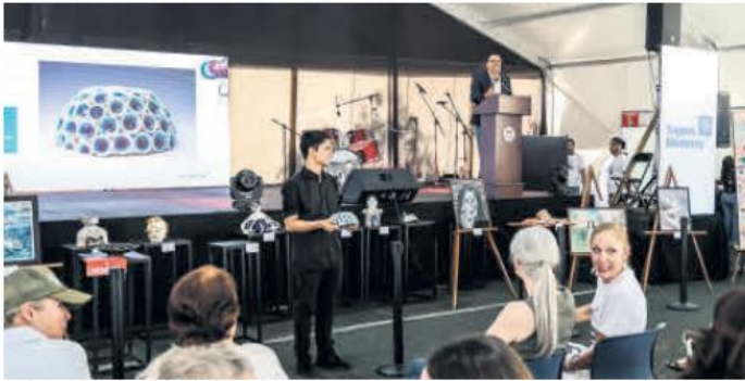
EVENTO. Momento de la subasta de arte.

The American School Foundation of Guadalajara celebró ayer la edición número 36 del Art Fest, un evento que, con más de tres décadas de trayectoria, se ha consolidado como un espacio de encuentro para artistas, estudiantes y familias. En esta ocasión, la comunidad escolar se sumergió en un ambiente lleno de creatividad, explorando exposiciones, talleres y actividades interactivas que fomentaron el amor por el arte.