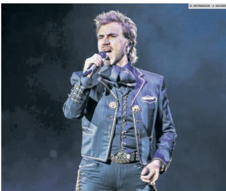
ENTREGADO. El hijo del "Charro de Huautlilán" cantó los éxitos que dieron fama a Vicente Fernández, uno de los mayores íconos de la música mexicana.