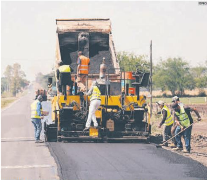
MEJORAMIENTO. Los transportistas se han quejado durante años por las condiciones de la red carretera estatal.

En la Zona Centro de Jalisco también hay proyectos de rehabilitación, como el ingreso a El Salto; la vía que conecta a ese municipio con la Carretera Federal 80; también un tramo que enlaza a Las Pintas con San José El Verde y el cruce de la Carretera a Chapala con la Carretera a El Salto. En Tlajomulco está la vía que enlaza a La Calera con Cajititlán y con Santa Cruz de las Flores.