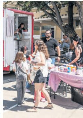
SERVICIOS. Las opciones gastronómicas fueron variadas.