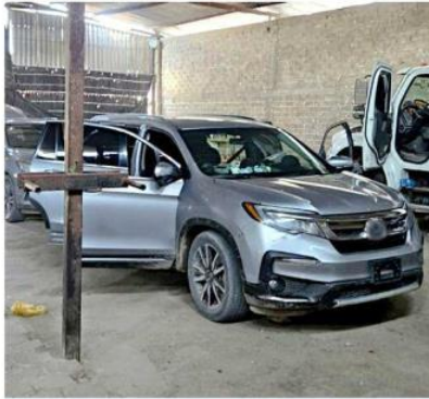
En el narcorrancho fueron asegurados varios vehículos.