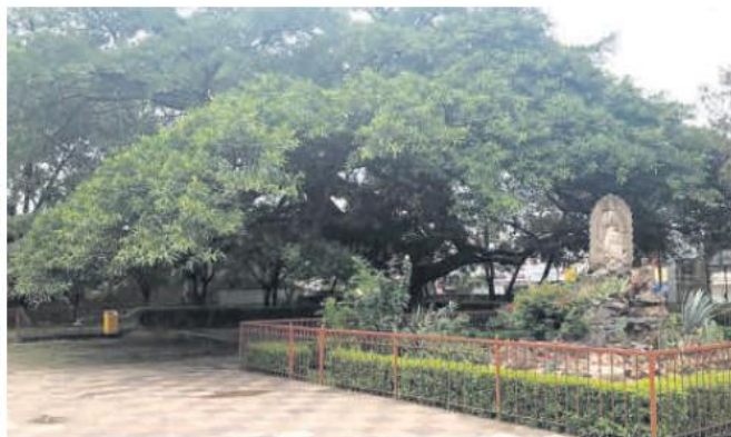
HIGUERA NEGRA. Este árbol tiene un aproximado de 284 años.