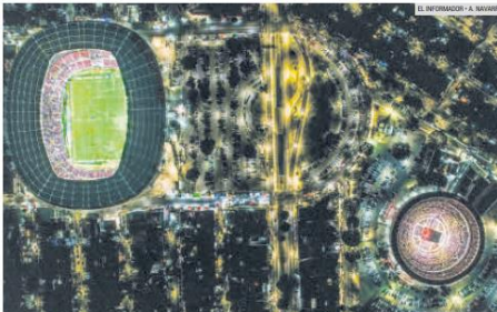
LA AFICIÓN RESPONDE. El Estadio Jalisco (izquierda) lució una gran entrada, a pesar del tráfico y las dificultades para llegar debido al concierto de Alejandro Fernández celebrado en la Plaza de Toros (derecha).