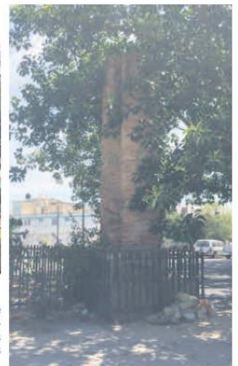
EL ZALATE DE LA GARITA. Se encuentra en el interior de la primaria no. 86 "República Panamá", en la Colonia El Retiro.

derribado por una tormenta en 1992, y lo que hoy queda de él no es más que una estaca o extensión del árbol original, por lo que ya no se le considera el más viejo de nuestra ciudad.