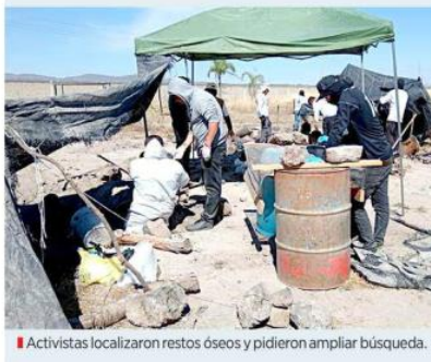
Activistas localizaron restos óseos y pidieron ampliar búsqueda.

También decomisaron varios vehículos, 4 armas largas, 2 armas cortas, chalecos balísticos, cargadores, objetos metálicos en forma de estrella y mariguana.