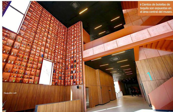
Cientos de botellas de tequila son expuestas en el área central del museo.

Ubicado en Avenida Central Guillermo González Camarena 750 en Zapopan, el Tequila Lab abre sus puertas de martes a domingo, de 11:00 a 19:00 horas. Para más detalles se puede visitar el sitio oficial tequilalab.com.mx .