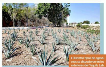
Distintos tipos de agaves se dispusieron en los exteriores del Tequila Lab.