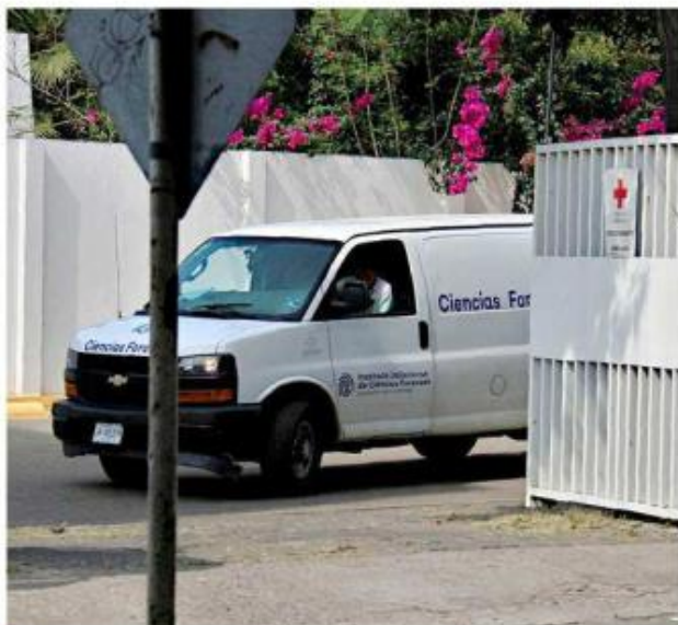
Una mujer falleció cuando era trasladada a la Cruz Roja de Toluquilla.

La Fiscalía del Estado añadió que durante los hechos resultó lesionado un hombre, cuya relación con las fallecidas no se precisó.