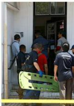
La agresión ocurrió en una clínica dental.

Para tratar de dar con el responsable, las autoridades inspeccionaron la libreta de citas del consultorio.