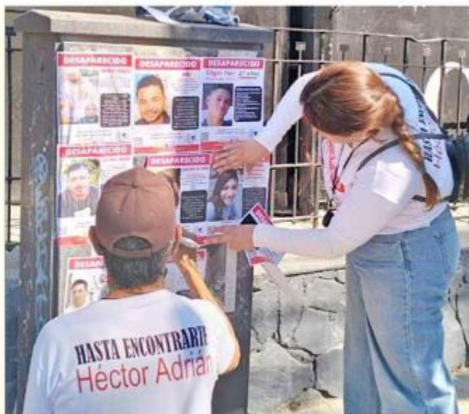
■ Miembros de Luz de Esperanza exigieron justicia.

La agrupación exigió a las autoridades que haya castigo para los implicados.