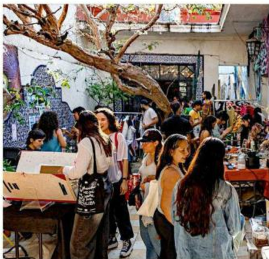
■ El bazar tuvo como objetivo apoyar al colectivo.

Activistas requieren botas de trabajo, picos y palas para labor de campo