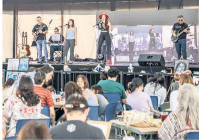
DIVERSIÓN. La música estuvo presente en el evento.

"Me parece estupendo que la American School Foundation of Guadalajara realice este tipo de actividades en donde se prioriza el arte y lo fomenta en los niños. Además, les demuestra que ser artista es una gran profesión y, contrario a lo que se diga, se puede vivir siendo artista y en específico un artista plástico", expresó.