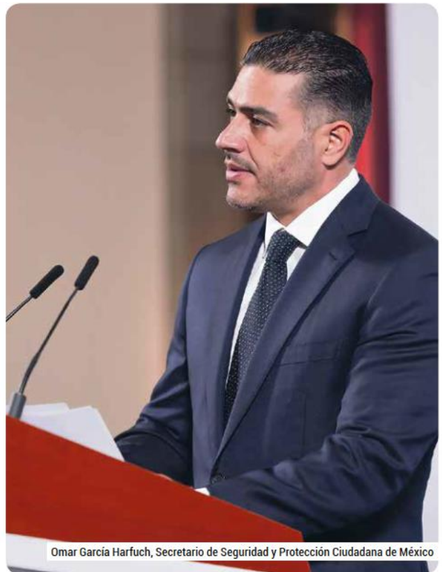
Omar García Harfuch, Secretario de Seguridad y Protección Ciudadana de México