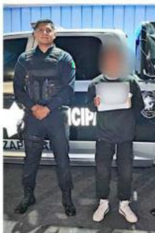
■ El joven fue llevado a la Fiscalía.

“De lo anterior se le hizo de conocimiento al Agente del Ministerio Público, quien por conducción y mando indicó el arribo del masculino a sus instalaciones para hacerse cargo del mismo”.