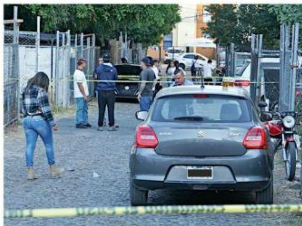
■ Un homicidio se registró en la Colonia Altagracia.

El miércoles, alrededor de las 18:30 horas, dos hombres resultaron lesionados durante un ataque a balazos