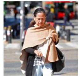
La temperatura bajará más, F.C.

Al menos seis condados del sur de California fueron declarados en emergencia luego de la tromba que cayó en las horas previas a Navidad, cuyo saldo es de tres muertos; en algunas localidades de Los Angeles, San Bernardino y San Diego prevén más lluvias, además de deslizamientos luego de que los incendios forestales de hace unos meses destruyeron la vegetación y debilitaron los suelos. WILLIAM LANG/AP PÁG. 16