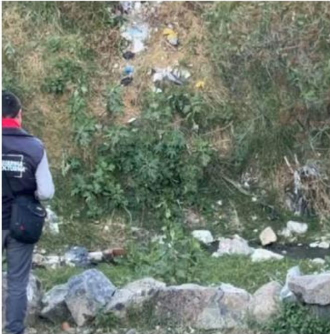
El cuerpo no presentaba signos de violencia.