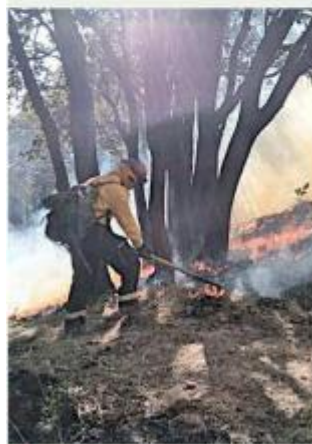
■ Bomberos y brigadistas han estado muy activos en la entidad.

Entre dichos servicios se encuentran 88 incendios, 83 incidentes relacionados con accidentes y rescates, 47 atenciones médicas prehospitalarias, tres explosiones registradas, 152 personas lesionadas y diez personas fallecidas, principalmente por incidentes vehiculares.