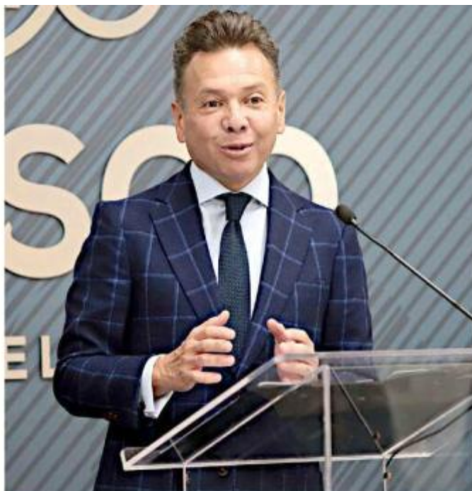
■ Pablo Lemus regresará en enero, pero promete estar pendiente de las necesidades del Estado.

Entre quienes se mantuvieron dentro de la Ciudad en esta Navidad, se encuentra la Alcaldesa de Guadalajara, Verónica Delgadillo, cuyas historias en redes sociales sirvieron como vitrina para presentar su receta familiar de bacalao rumbo a la cena de Nochebuena.