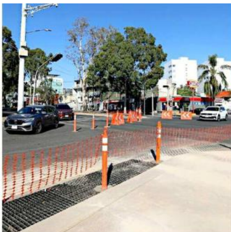
■ Se prevé que el 29 de diciembre se restaure la circulación en los cinco carriles de la Glorieta Minerva