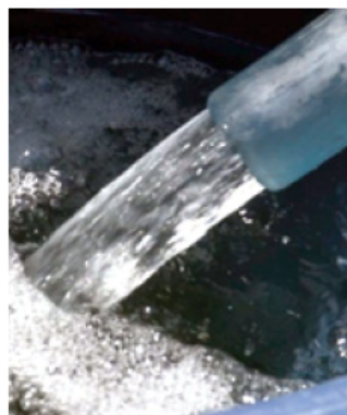
Gobierno de Tlajomulco

Los trabajos se llevarán a cabo a partir del próximo 3 de enero.