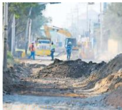
SIGUIENTE MES. La conclusión de las obras en Adolf B. Horn está proyectada para enero.

Además de estas vialidades estratégicas, el Municipio mantiene un programa de intervención en pueblos tradicionales, con obras concluidas recientemente en La Teja, Santa Cruz de la Loma, Buenavista, Santa Cruz del Valle y Santa Cruz de las Flores.