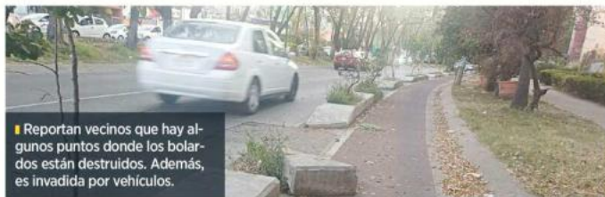
■ Reportan vecinos que hay algunos puntos donde los bolar-dos están destruidos. Además, es invadida por vehículos.