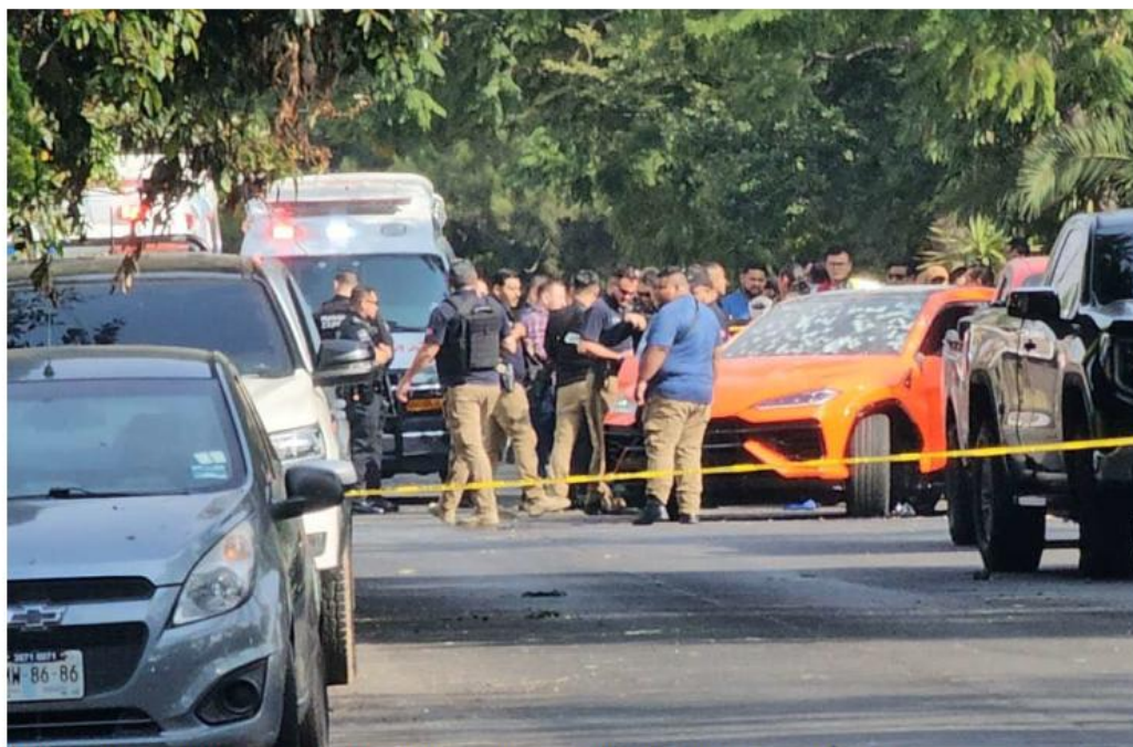
El ataque directo ocurrió en el cruce de la avenida Topacio y la calle Brillante, en Residencial Victoria. JUAN CARLOS MUNGUÍA