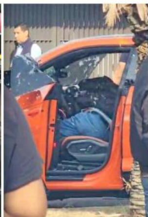
En la emboscada también murieron una hija y un escolta del empresario.

Lo ejecutó comando con entrenamiento táctico