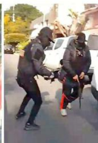
Los agresores lograron escapar antes de la llegada de las autoridades.

del empresario, cuyo cuerpo quedó sobre el camellón de Topacio, a unos metros de otra camioneta baleada.