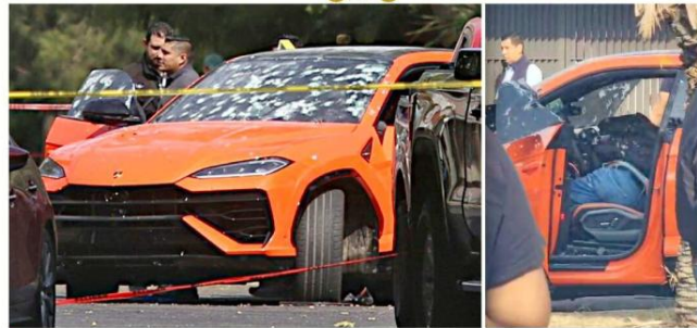
■ En la emboscada también murieron una hija y un escolta del empresario.

Lo ejecutó comando con entrenamiento táctico