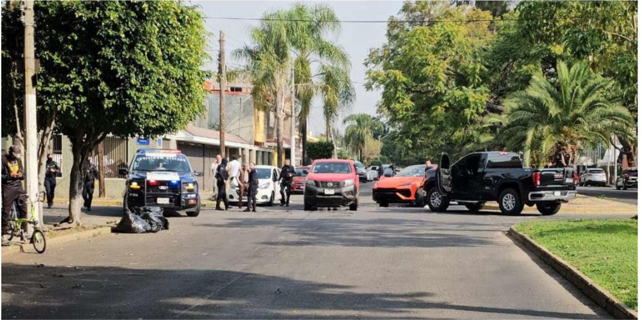
La agresión directa ocurrió en el cruce de la avenida Topacio y la calle Brillante, en la colonia Residencial Victoria, en Zapopan. JUANCARLOS MUNGUÍA