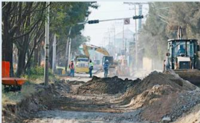
■ Proyecta el municipio concluir las obras el mes próximo.

tor de Obras Públicas añadió que la Carretera a El Zapote se encuentra al 98 por ciento de avance y que los trabajos finalizarán en este mes. Además, indicó que estas obras permitirán garantizar una mejor movilidad y mayor seguridad para conductores, usuarios del transporte público y peatones.