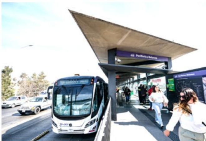
El Gobierno estatal anunció un esquema de subsidios para mitigar el impacto económico.

El preregistro iniciará el 12 de enero a través del portal oficial tarjetaunica.