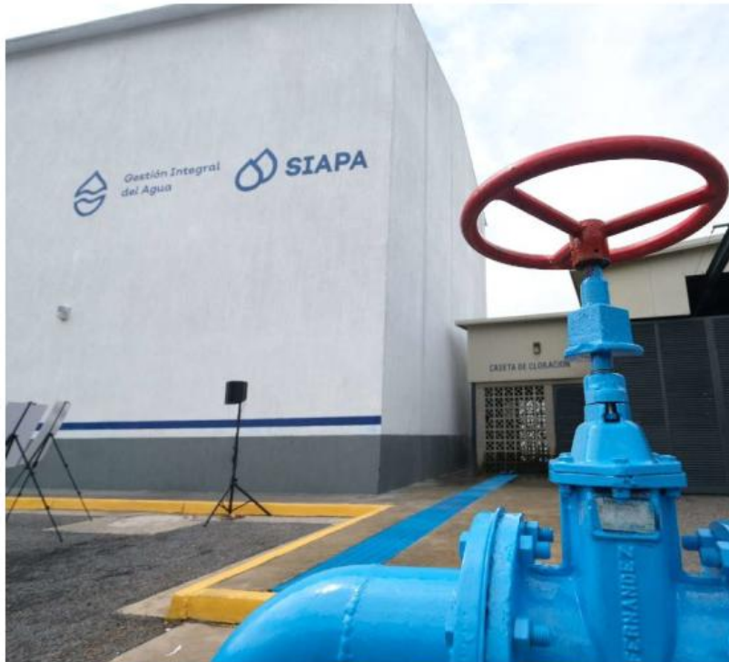
El suministro podría restablecerse la noche del sábado 3 o hasta el miércoles 7 de enero.

Abastecimiento. Cuatro municipios aportarán pipas durante el mantenimiento y la interrupción del suministro de agua