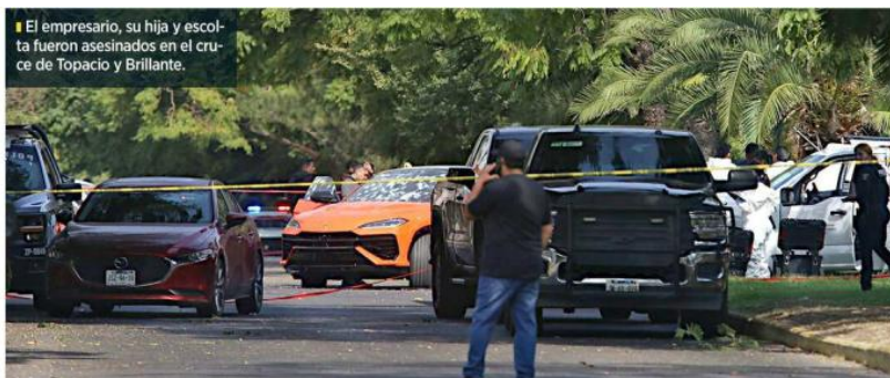
El empresario, su hija y escolta fueron asesinados en el cruce de Topacio y Brillante.

Los sicarios actuaron de manera coordinada