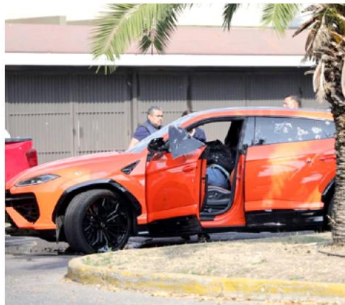
Tras el ataque, se registró un intercambio de disparos entre los atacantes y escoltas.

Lamentablemente la joven mujer circulaba a bordo de una camioneta