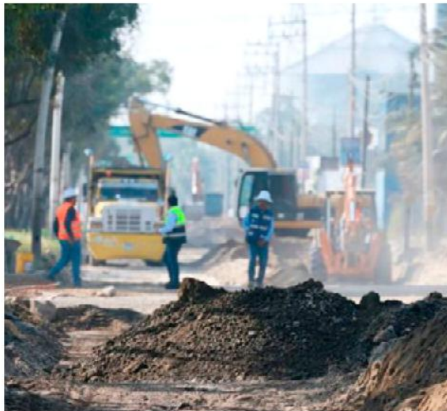
El proyecto contempla la modernización total de la vialidad.

Entre las intervenciones más relevantes destaca la rehabilitación integral de la avenida Adolf B. Horn, la cual registra un avance cercano al 80%