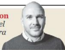
René Lankenau "Destacaron Herdez, Grupo Aguilas, fusión aérea y Banamex" - P. 20