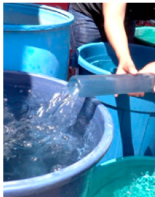
El corte de agua se realizará en 247 colonias del AMG.

Ante este escenario, el gobierno municipal precisó que el servicio de pipas operará todos los días, incluidos fines de semana, en un horario de 9:00 a 20:00 horas, con el objetivo de atender de manera oportuna las solicitudes de la población.