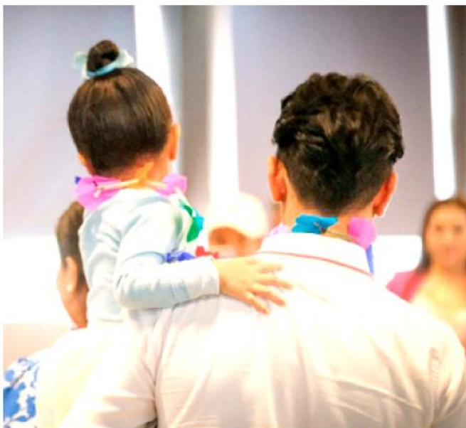
El promedio de permanencia de los niños en albergues de Jalisco es de 5.8 años.

Las personas interesadas pueden acudir a la Procuraduría de Protección de Niñas, Niños y Adolescentes (PPNNA), conocida como Ciudad Niñez, donde un equipo multidisciplinario brinda información sobre los requisitos, el llenado de solicitudes y la participación en pláticas y espacios formativos necesarios para convertirse en familia adoptante o de acogida.