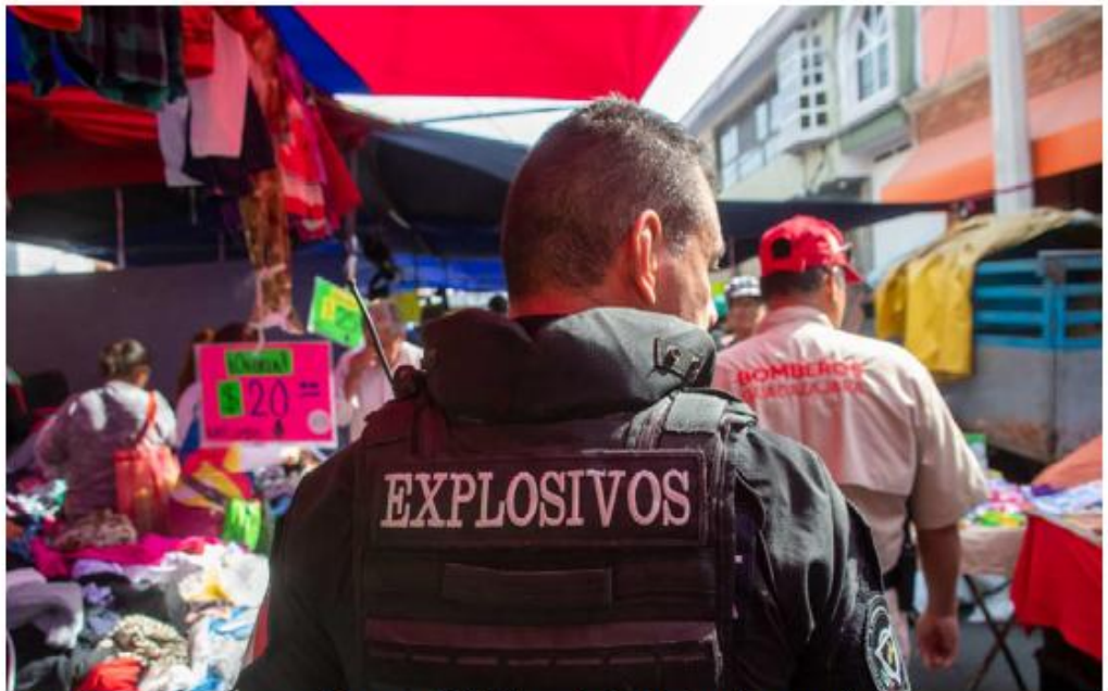
Autoridades realizan recorridos para inhibir la venta de pirotecnia.

En lo que va de la temporada se reportan 12 personas lesionadas por pirotecnia en Tomatlán, Puerto Vallarta, La Barca y Villa Purifi-