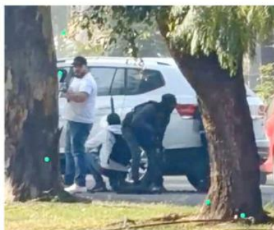
Los sicarios portaban armas de grueso calibre.