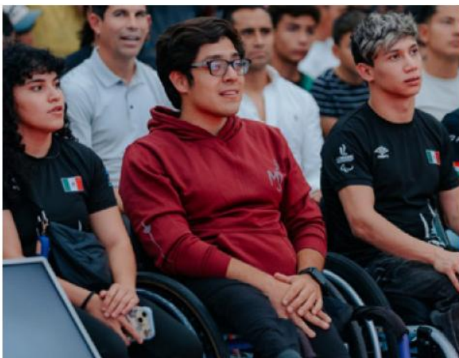
Este programa tiene por objeto facilitar la asistencia de los atletas a eventos oficiales.

El programa contó con una bolsa total de tres millones de pesos y fue