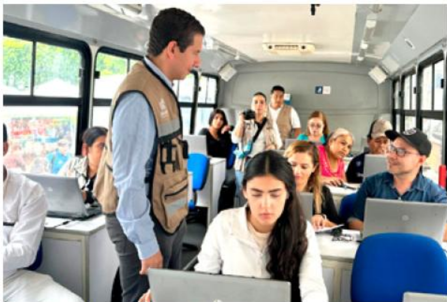
La meta nacional fijada para Jalisco era de 23 mil 890 personas.