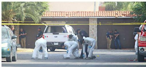
Los peritos recogieron muchos casquillos que quedaron regados tras la balacera.

En el sitio del ataque también murió un escolta