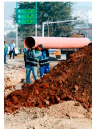
Gobierno de Tlajomulco

recientemente en comunidades como La Teja, Santa Cruz de la Loma, Buenavista y Santa Cruz de las Flores, como parte de un programa que busca recuperar espacios históricos y elevar la calidad de vida de sus habitantes.