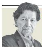
Jorge Zepeda Patterson "Vidas de periodistas: el caso José Rubén Zamora en Guatemala" - P. 9