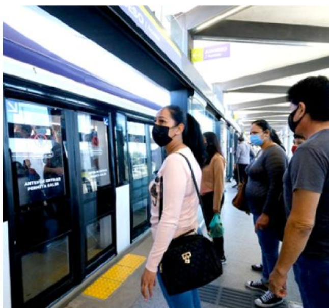
Se permitirán mejorar la frecuencia y capacidad del servicio a partir del primer trimestre de 2026.

unidades para que cubran el derrotero de la Ruta 13. Va a ser con la Ruta 275, que lo conocen los vecinos de la zona. Se va a notar en estos días, ya son de