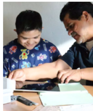
Estos equipos facilitarán sus actividades cotidianas.

"El Sistema DIF lo trabajó de una manera muy integral, desde la selección de estos apoyos, el trabajo en equipo con DIF Nacional para que se siga abordando este proyecto año con año".