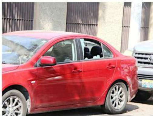
Las casas y carros de vecinos mostraban daños tras la balacera.

Los reportes de los disparos comenzaron a circular en redes sociales aproximadamente a las 10:17 horas del lunes y, de acuerdo con los testigos, la balacera duró