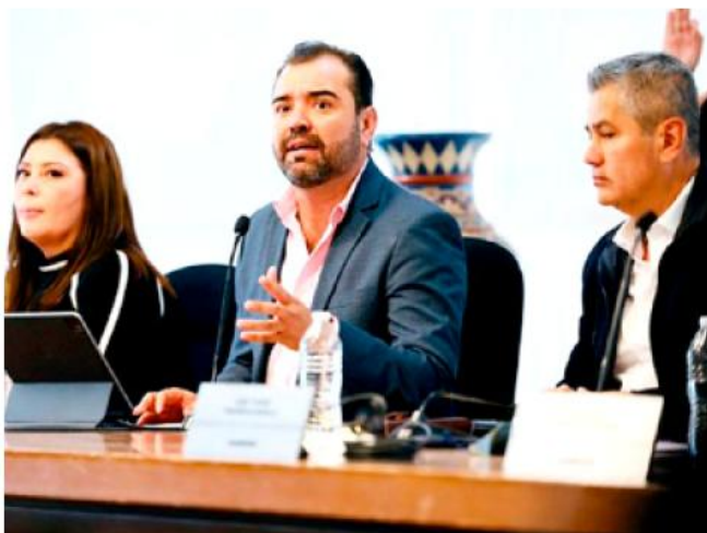
Adelantó que en 2026 se mantendrá la misma línea de inversión.

"Fue un año lleno de mucho trabajo. Estamos muy contentos de poder seguir avanzando en los temas que