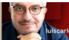
LUIS CARLOS UGALDE

El país mantuvo la estabilidad, pero fue incapaz de crecer y de reducir la violencia y la corrupción. Aun así, vale la pena alentar cierto optimismo.