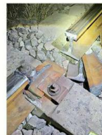
Los criminales usaron la técnica del oxicoque en los rieles.

Autoridades ferroviarias alertaron de una operación criminal en Guanajuato para descarrillar el tren de carga mediante una modalidad de sabotaje basado en el corte de rieles mediante oxicoque con soplete, una técnica que se utiliza para forzar detenciones, provocar descarrilamientos y facilitar la extracción de mercancías.