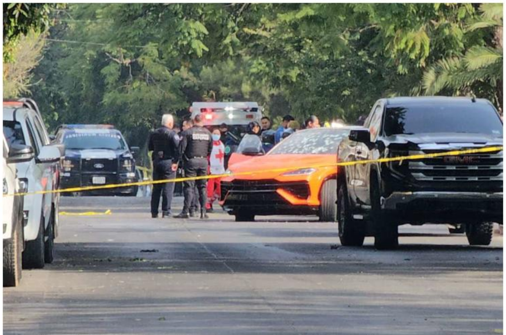
La agresión se registró alrededor de las diez de la mañana de ayer en Residencial Victoria, en Zapopan.

El empresario conocido como El Prieto viajaba con su hija menor de edad a bordo de una camioneta Lamborghini Urus SE color naranja, la cual iba acompañada por otros vehículos con escoltas, cuando un grupo de hombres armados interceptó el vehículo de alta gama y abrió fuego en repetidas ocasiones