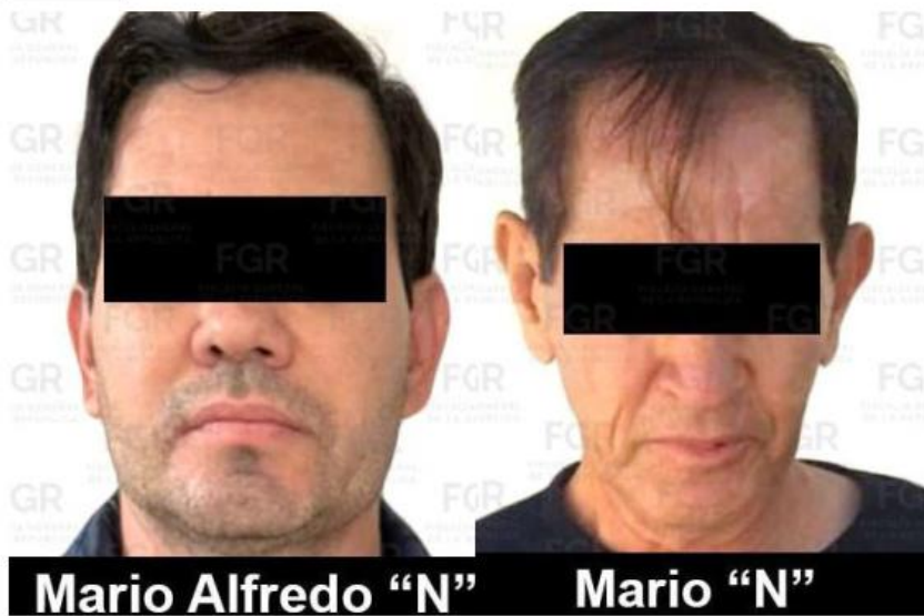
Las audiencias de vinculación se llevaron a cabo este martes en Jalisco.