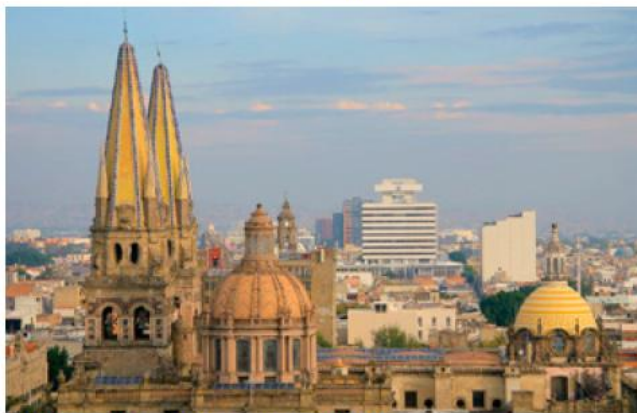
La inversión térmica impide la dispersión de contaminantes.