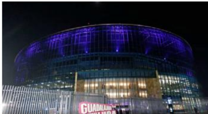
La apertura se pospuso durante meses. FERNANDO CARRANZA

Desde principios de año se tuvieron que cancelar conciertos, como los de Reik, Katty Perry, Carlos Rivera, Banda MS y un largo etc., debido a que la construcción del recinto no concluía. ■