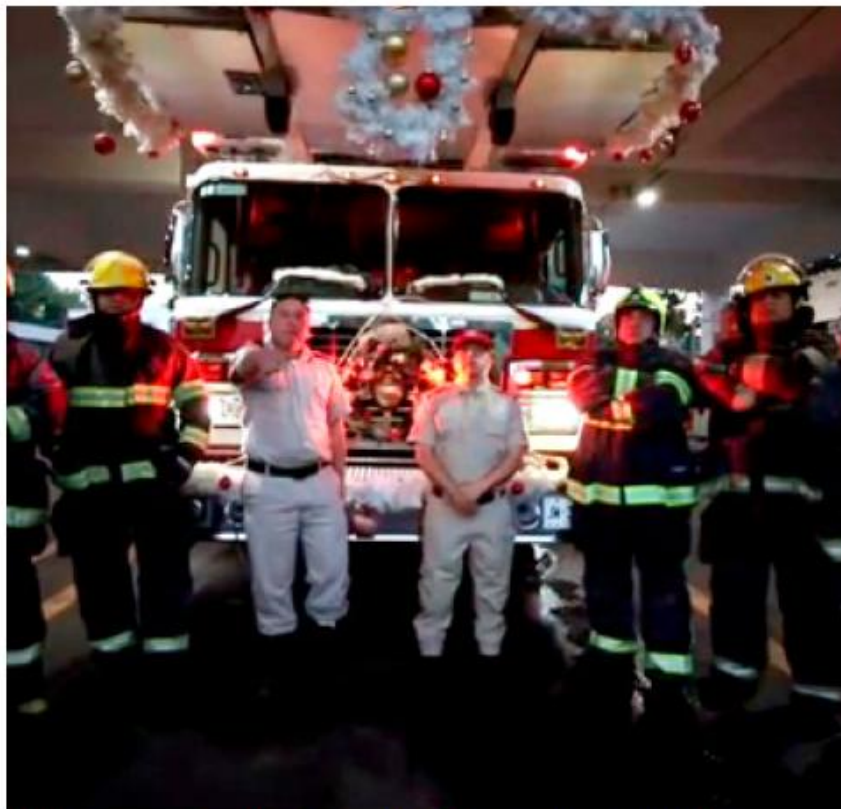
El mensaje también apela a la convivencia familiar y al cierre del año sin incidentes.

Esta acción se suma a los operativos de vigilancia que se mantienen en distintos puntos de la ciudad para