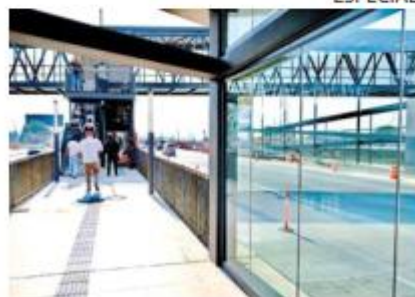
BETANIA Y ZAPOTLANEJO. Las dos nuevas estaciones del peribús tienen 80 por ciento de avance.