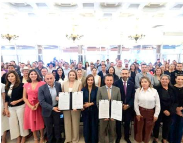
La SISEMH impulsó programas como Fuerza Mujeres y Empresarias de Alto Impacto.

la SISEMH impulsó programas como Fuerza Mujeres y Empresarias de Alto Impacto, con una inversión de 60 millones de pesos, dirigidos a fortalecer