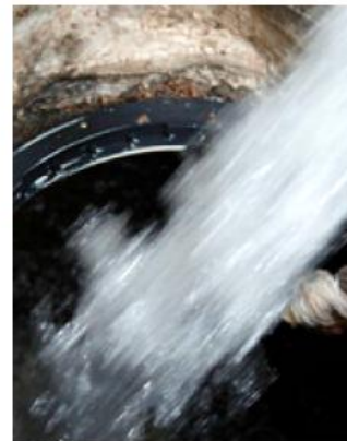
Del 3 al 7 de enero, casi 900 colonias del AMG se quedarán sin agua.

En este espacio se definieron los mecanismos de coordinación logística y operativa para los trabajos programados a partir del 3 de enero, los cuales incluyen mantenimiento a tanques a cargo del Siapa y el reforzamiento de la subestación eléctrica de la Planta de Bombeo de Chapala, responsabilidad de la Comisión Estatal del Agua de Jalisco (CEAJ).