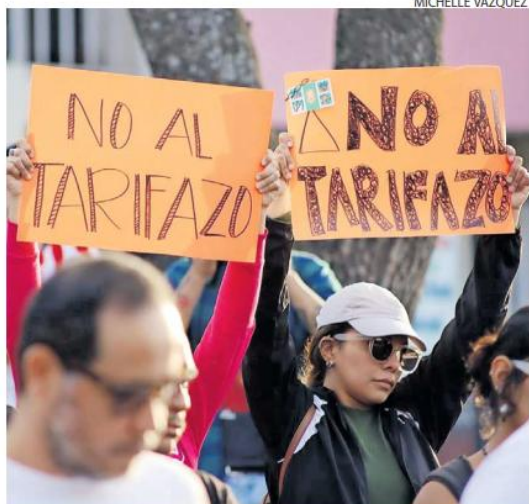
EN CONTRA. En la manifestación se rechazó el tarifazo y se exigió claridad en torno al incremento.