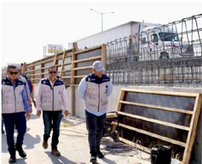
A partir e febrero iniciará la etapa de equipamiento de recaudo de las estaciones.

dio a conocer que para el próximo año se proyecta la construcción de seis estaciones adicionales, con el objetivo de fortalecer el servicio de transporte público en el oriente del Estado.