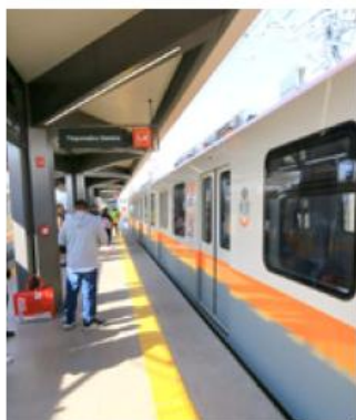
Las personas usuarias podrán acceder a un descuento del 50 por ciento en transbordos.