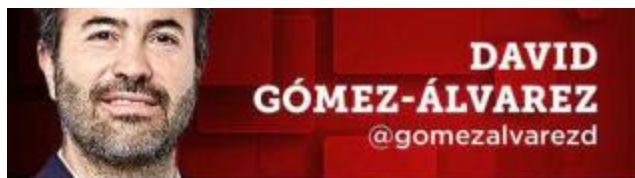
DAVID GÓMEZ-ÁLVAREZ @gomezalvarezd

Desde su origen, la integración del comité tarifario está sesgada hacia los transportistas, en detrimento de los usuarios.