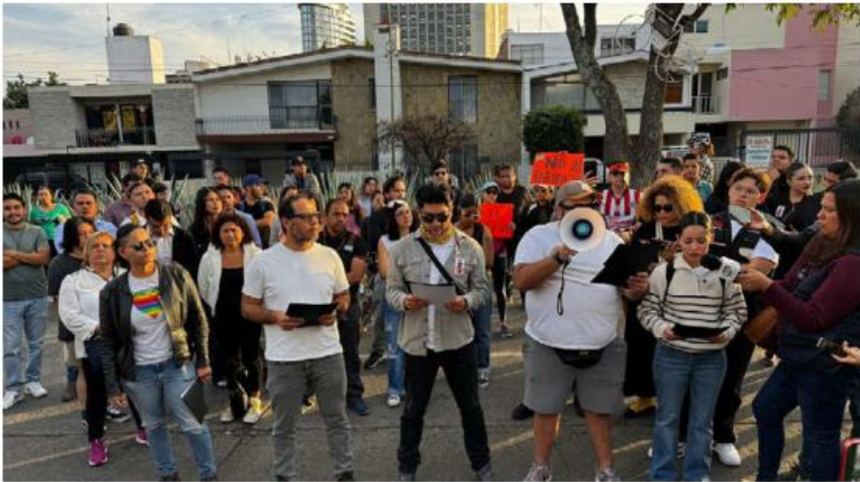
Una de las exigencias es que el gobierno haga público un estudio del impacto económico. U. TOLEDO