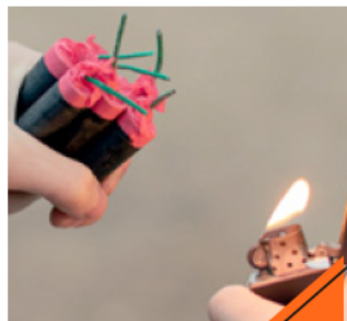
La pirotecnia puede producir lesiones de gravedad.

"Lo ideal es no utilizarla, toda vez que la pirotecnia es un material peligroso, nos hemos encontrado con que puede producir lesiones de gravedad e inclusive fallecimientos de personas.