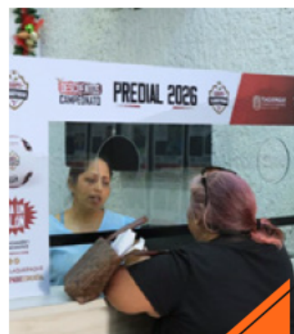
En abril se otorgará un incentivo adicional del 5 por ciento.

Asimismo, durante enero y febrero se aplicará un 10 por ciento de descuento en pagos de servicios como agua potable, cementerios y estacionamientos.