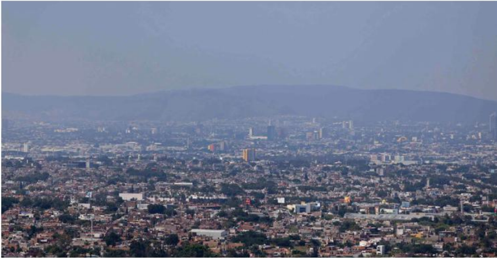
La temporada invernal representa uno de los periodos más críticos para la calidad del aire. FERNANDO CARRANZA