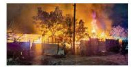
En cinco estados, 21 casos Por pirotecnia y campismo, los incendios de Año Nuevo