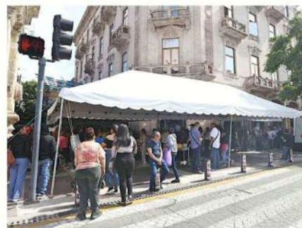
■ En caso de que se acuda a pagar las infracciones a alguna recaudadora el descuento será de sólo 50 por ciento.

Otro estímulo permanente durante todo el 2026 es el descuento del 70 por ciento en el trámite de cambio de propietario.