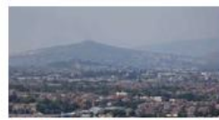
Contaminación ambiental Guadalajara inicia el año con mala calidad del aire