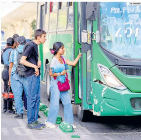
LINEAMIENTOS. En una primera etapa, la Tarjeta Única estará dirigida a estudiantes, adultos mayores, personas con discapacidad y otros grupos en situación de vulnerabilidad. Posteriormente, estará disponible para toda la población interesada.

A partir de abril próximo, quien obtenga el documento oficial pagará 11 pesos por viaje en el transporte público. Quien no lo tenga: 14