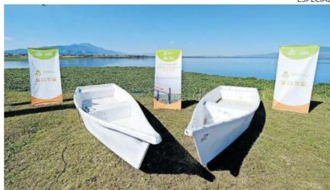
SECTOR PESQUERO. La Sader resaltó el apoyo a cooperativas mediante la adquisición de embarcaciones.

inclusión productiva mediante el programa Mujeres y Jóvenes por el Campo, apoyos a infraestructura rural con Empedrados al Estilo Jalisco y proyectos de mecanización agrícola y prácticas sustentables, como la Cosecha en Verde en el cultivo de caña de azúcar.