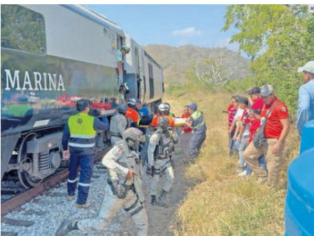
TRAGEDIA. Vagones volcados y fuera de las vías quedaron tras el descarrilamiento del Tren Interoceánico en una curva cercana a Nizanda, en Oaxaca, accidente que dejó 14 personas fallecidas hasta el momento.