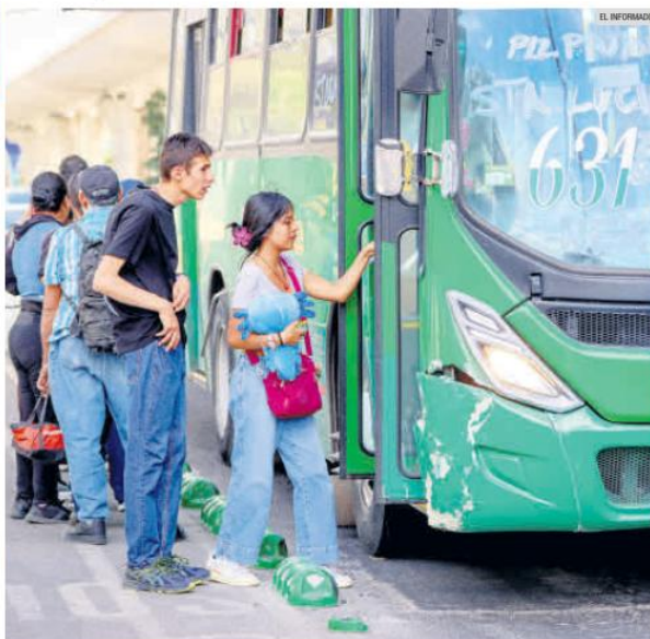
LINEAMIENTOS. En una primera etapa, la Tarjeta Única estará dirigida a estudiantes, adultos mayores, personas con discapacidad y otros grupos en situación de vulnerabilidad. Posteriormente, estará disponible para toda la población interesada.

A partir de abril próximo, quien obtenga el documento oficial pagará 11 pesos por viaje en el transporte público. Quien no lo tenga: 14