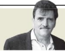
Enrique Serna "El olor a gasolina los excitaba más que el perfume femenino" - P. 26

Prevención. Senadores apremian a hoteleros a que nieguen el servicio a quienes no acrediten tutela de menores y presenten denuncias; el país, segundo destino para este delito, solo detrás de Tailandia, dicen