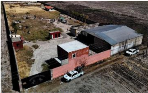
El hallazgo abrió debates sociopolíticos.