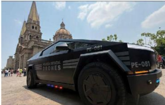
Las unidades generaron discusión.