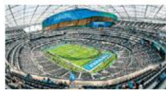
Federación de asociaciones La Copa del Mundo robó ya visitantes a fiestas navideñas

La Comisión de Turismo del Senado y la Comisión de Estudios Legislativos Segunda aprobaron por separado reformas a la Ley General en la materia a fin de evitar la trata de personas y la explotación sexual infantil una vez que se encendieron las alarmas a menos de medio año del certamen deportivo, sobre todo porque México es segundo en ese delito detrás de Tailandia. PÁGS. 10 Y 11