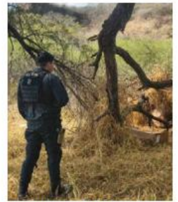
Techaluta, en la lista.

En Teocaltiche, en los primeros siete meses del 2025, 57 policías decidieron dejar la corporación; la policía de Villa Hidalgo también fue intervenida y desarmada, ante la sospecha de infiltración criminal. En Chiquilistlán, el desarme tuvo lugar en noviembre pasado, tras la detención de su comisario,