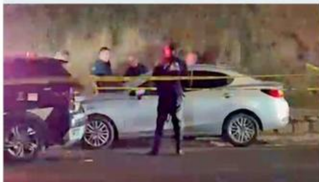
Una de las víctimas quedó en Bugambilias.

La pareja del fallecido, tras ser atacados, decidió acudir a su domicilio para luego ir por ayuda, sin embargo en el traslado se percató que su estado de salud no era conveniente.