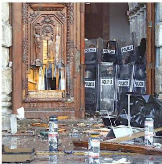
■ La CEDHJ analiza si emite una recomendación por los hechos.

“Las 21 quejas, además del acta de investigación, fueron turnadas a la Segunda Visitaduría, quien conoce en materia de Seguridad Pública y procuración de justicia para que integre estas quejas y esta acta de investigación y a partir de la integración, conforme lo establece la normativa interna de esta Comisión Estatal de Derechos Humanos, se determine si existe