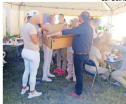
DDS. La convivencia fue promovida por la Dirección de Diversidad Sexual Jalisco.