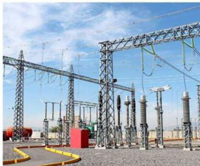
■ La CFE hará trabajos de instalación intercalada de postes con transición aérea.

Las labores consisten en la instalación intercalada de postes con transición aérea, trabajos que se realizarán en coordinación con la Secretaría de Infraestructura y Obra Pública, con el objetivo de optimizar la calidad y conti-