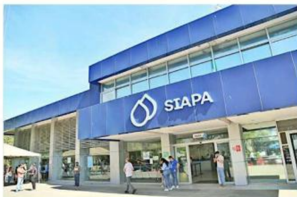
El Órgano Interno del Siapa da seguimiento al procedimiento de responsabilidad que se abrió por el caso.

Los reportes por falta de reconexión del servicio de agua presentaban tiempos de atención que iban de los 18 a