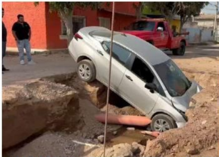
SOCAVÓN. Un auto cayó a un socavón que se produjo de la colonia Las Pintas, al cruce de las calles San Miguel y 6 de Enero, en una zona donde se reparaba la vía pública; conductor salió ileso.