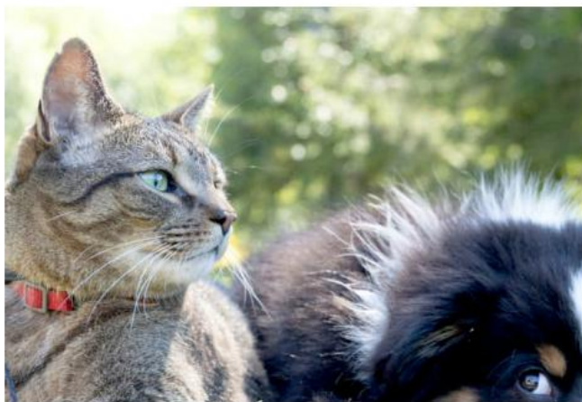
Con la vacunación, perros y gatos pueden evitar enfermedades como parvovirus y parainfluenza.

"Este es un buen momento para proteger a nuestras mascotas con su cuadro básico de vacunación. Muchas personas creen que basta con aplicar la vacuna contra la rabia, pero no es