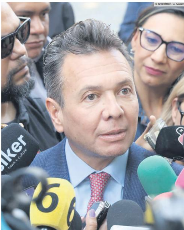
PREVENCIÓN. El gobernador de Jalisco, Pablo Lemus, tras la junta de seguridad en la que solicitó reforzar controles migratorios para prevenir delitos.

El reforzamiento de los controles migratorios y la colaboración con instancias federales buscan prevenir que personas con antecedentes penales ingresen al estado y participen en actividades delictivas. La coordinación entre la Fiscalía de Jalisco, la Policía estatal y el CNI se ha intensificado para atender casos de secuestro, tráfico de armas y fraudes asociados a extranjeros, especialmente colombianos, que operan en territorio jalisciense.