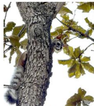
El ejemplar fue trasladado a la Unidad de Rescate de Fauna Silvestre.

Autoridades municipales reiteraron el llamado a la ciudadanía para no manipular fauna silvestre que aparezca en zonas urbanas y reportar de inmediato estos casos a instancias especializadas, a fin de proteger tanto a los animales como a las personas y favorecer su retorno seguro a la vida libre.