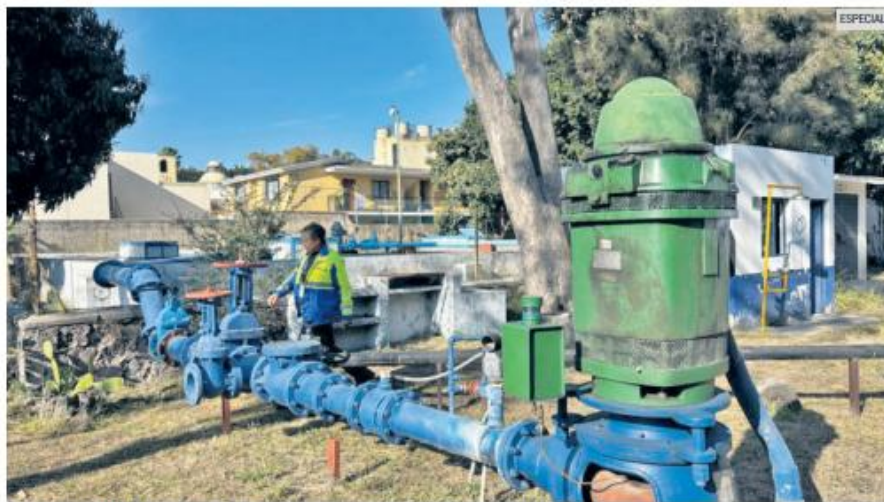
PREVENCIÓN. Personal del SIAPA realizó labores de mantenimiento y sustitución de piezas para restablecer el servicio de agua tras el megacorte programado.

no solo la recuperación del servicio, sino también el cuidado y la modernización de equipos e instalaciones clave. Según se informó, estos trabajos fortalecen la infraestructura y reducen el riesgo de fallas mayores, al tiempo que contribuyen a la continuidad en el abastecimiento de agua potable para la población.