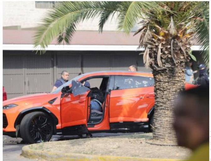
El gobernador dijo no estar de acuerdo con que le llamen empresario al fallecido.

Ante los vínculos que tuvo este hombre con algunos personajes políticos, Lemus Navarro dijo que la investigación de la Fiscalía no tendrá orientación política sino financiera.