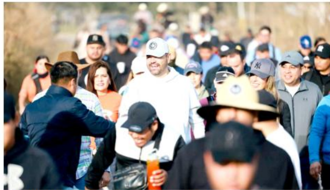
El Gobierno Municipal implementó un amplio operativo de seguridad.

Desde las primeras horas del día, fieles y visitantes comenzaron a sumarse al recorrido que, año con año, congrega a personas de distintas comunidades, fraccionamientos y municipios vecinos, quienes realizan ofrendas y mandas para pedir salud, prosperidad y bienestar para sus familias y para