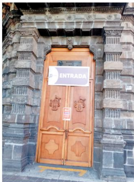
Hoy sí abrirá sus puertas.