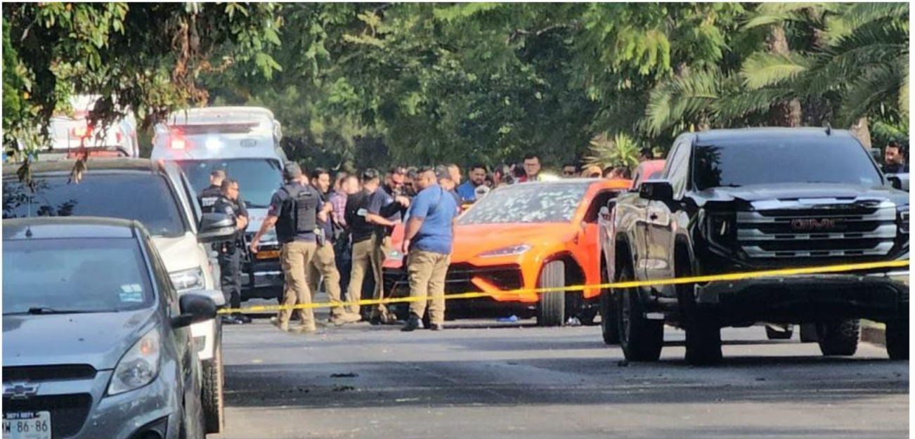
El homicidio ocurrió el pasado 29 de diciembre, en Zapopan; más de 30 sicarios participaron en el atentado. JUAN CARLOS MUNGUÍA