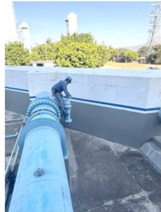
Realizaron limpieza, sustitución de piezas y actualización de equipos.

Finalmente, el Siapa informó que el servicio de pipas gratuitas continuará disponible para casos específicos que aún lo requieran e hizo un llamado a la ciudadanía a mantener un uso responsable del agua, agradeciendo la paciencia y colaboración mostradas durante el desarrollo de los trabajos.