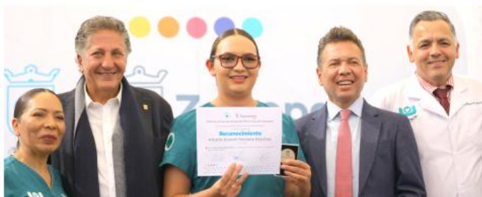
Se otorgaron reconocimientos a enfermeras y enfermeros por antigüedad y desempeño.

El director general del OPD Servicios de Salud Zapopan, Miguel Ricardo Ochoa Plasencia, detalló que las y los enfermeros son parte fundamental del sistema de salud, ya que son la primera línea de