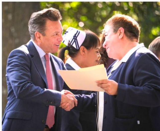
Lemus Navarro, elogió la labor que realiza el personal de enfermería en el Estado.

El mandatario jalisciense, Pablo Lemus Navarro, encabezó la celebración y aseguró que se busca mejorar las condiciones laborales del personal de salud