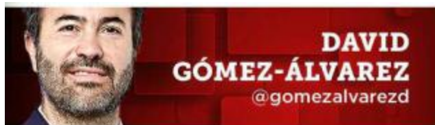
DAVID GÓMEZ-ÁLVAREZ @gomezalvarezd

No está en juego la permanencia de un partido en el poder ni la preeminencia de un proyecto de nación, sino la viabilidad del país.