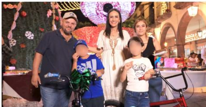
Alrededor de 2 mil personas acudieron para disfrutar de la rosca.