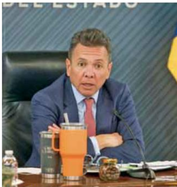
Primera. Pablo Lemus encabezó la primera reunión de seguridad del año refrendando la coordinación federal.

"En la primera reunión estatal de seguridad del año, acordamos