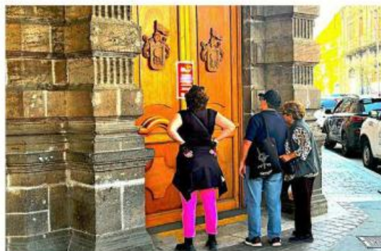
■ El Gobierno de Guadalajara suspendió ayer los pagos de impuestos, por lo que las recaudadoras estaban cerradas.

Contribuyentes comentaron que desde el sábado hay problemas con la red, incluso algunos tuvieron que esperar cuatro horas hasta que les dijeron que no había sistema.