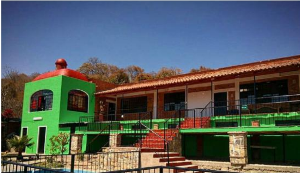
Cinco de los menores estaban en la Hacienda de los Niños La Piedrera.