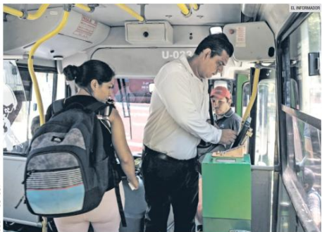
PROGRAMA. El registro para obtener la Tarjeta Única del transporte público iniciará el 12 de enero a través de la página oficial tarjetaunica.jalisco.gob.mx. La entrega comenzará a partir del 19 de enero.

En cuanto a la situación en Venezuela, defendió la operación que culminó con la captura de Nicolás Maduro y su esposa, alegando que la acción no se basaba en intereses petroleros, sino en la búsqueda de "paz en la tierra".