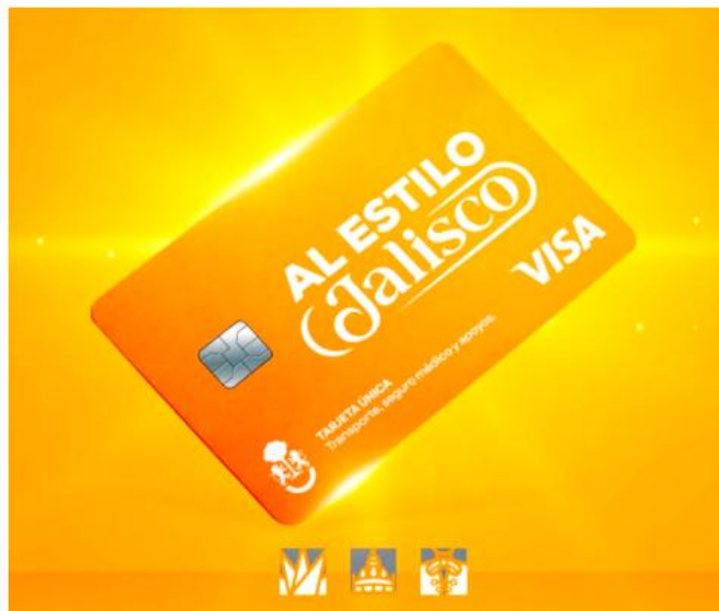
A esta tarjeta no se le dará un uso político, como ha acusado la oposición.

"Aquí pueden alcanzar tarjeta los ocho millones y medio de jaliscienses. Hay una meta de credencialización, pero eso no quiere decir que exista un tope de credenciales. Si hay ocho y medio millones de jaliscienses, que es toda la población que tenemos, que se quieran empadronar, a los ocho y medio les vamos a dar. No hay límites. Esto es bien importante decirlo. Entonces, cualquier persona, no necesariamente un estudiante, no necesariamente una persona adulta mayor, no necesariamente un familiar víctima de desaparición, las personas que vienen con alguna discapacidad que tienen un apoyo especial, no solamente ellos, van a recibir el apoyo, el subsidio. Cualquier persona en Jalisco, cualquiera que sea".