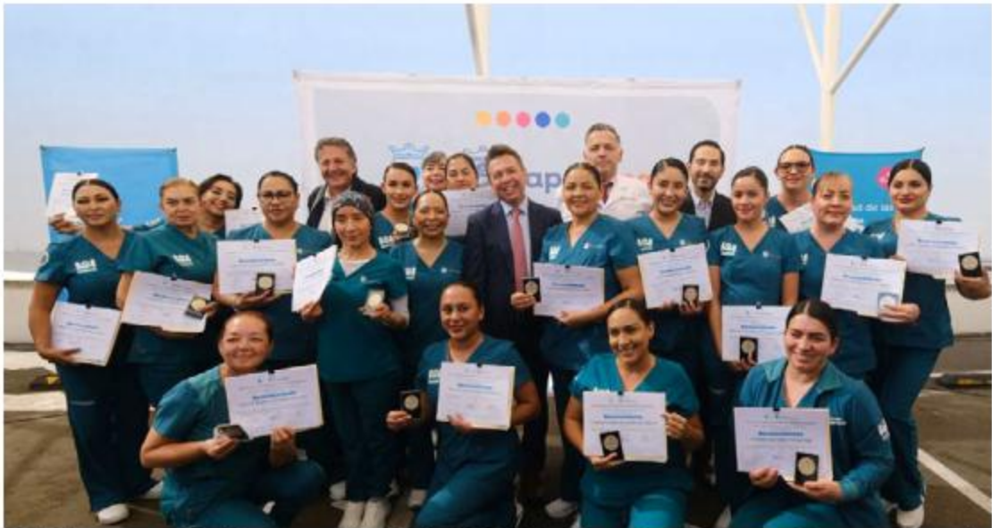
Pablo Lemus encabezó la ceremonia del Día de la Enfermera y el enfermero en Zapopan.