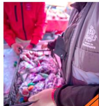
En el operativo decembrino participaron varias dependencias del municipio.

Durante las fiestas decembrinas, desde la Coordinación Municipal de Gestión Integral del Riesgo, Protección Civil y Bomberos de Guadalajara se contabilizaron cuatro incendios en vivienda que iniciaron a causa de productos elaborados con pólvora. Información de la División de Investigación de Incendios y Explosiones (DIIE) de la dependencia, señala que el primer incendio se registró el 24 de diciembre, en la Colonia San Antonio.