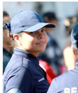
En este periodo, la policía recuperó nueve vehículos.

Debido a que se encontraban en una zona de difícil acceso, el rescate se realizó por aire con la aeronave y equipo de cuerdas.