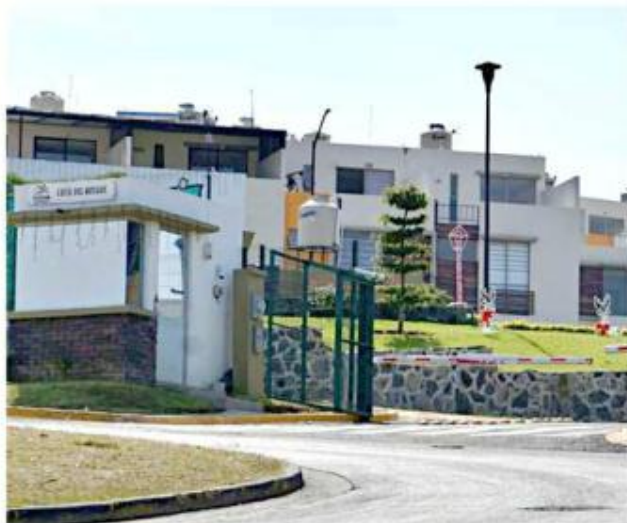
La familia fue privada de la libertad en Colinas de Tonalá.

Pablo Lemus, Gobernador de Jalisco, informó que