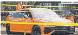
DICIEMBRE DE 2025. El asesinato de "El Prieto", su hija y su escuela en Zapopan evidenciaron la violencia de alto impacto en la metrópoli.

En el mismo lapso, Zapopan reportó 767 detonaciones de arma de fuego atendidas por su comisaría, con un saldo de 42 personas fallecidas y 68 lesionadas. Las colonias con más reportes fueron Mariano Otero, Miramar, Nuevo Vergel, Villas de Guadalupe, La Consta y Arenales Tapatitas.