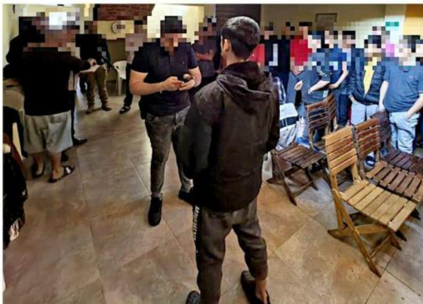
Las autoridades informaron de los hechos el viernes pasado.

Durante la intervención fueron localizados cinco hombres; cuatro de ellos contaban con denuncia vigente por desaparición y uno más con reporte, precisó la Fiscalía del Estado. Además, se detuvo a otro hombre que tenía una orden de aprehensión por estar presuntamente relacionado con el narcomenudeo.