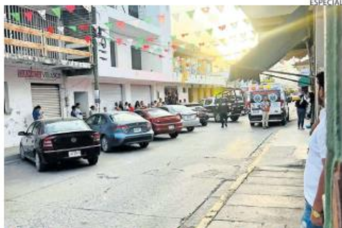
CÉNTRICO. El crimen se registró al interior de una tienda de ropa ubicada en la calle principal del municipio.

Tras el ataque, elementos de seguridad y servicios de emergencia acudieron al sitio, donde confirmaron el deceso y acordonaron el área para permitir las labores periciales y el levantamiento del cuerpo por parte de la Fiscalía del Estado (FE), que ya