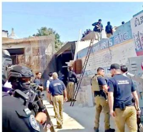
El criminal logró escapar por las azoteas.