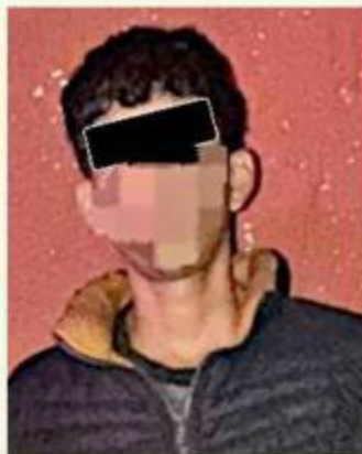
Los jóvenes estaban en la Nueva Central Camionera.