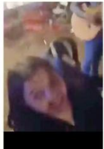
En el video se observa a la Alcaldesa divertida grabando a una mujer que entona la canción.

La polémica obligó a entonces Alcalde, Diego Rivera, actualmente detenido, a cancelar la presentación del grupo musical en el lugar que se tenía previsto en Tequila, aunque terminó tocando en otro sitio del Municipio.