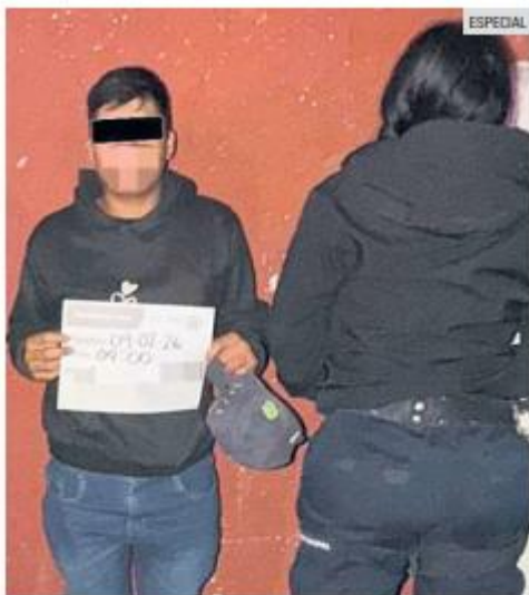
A SALVO. Uno de los adolescentes rescatados por policías de Tlaquepaque, en las inmediaciones de la Nueva Central Camionera.