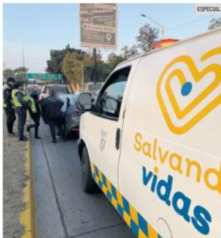
DETENIDO. Elementos de la Policía Vial remitieron al conductor a la CURVA tras dar positivo.