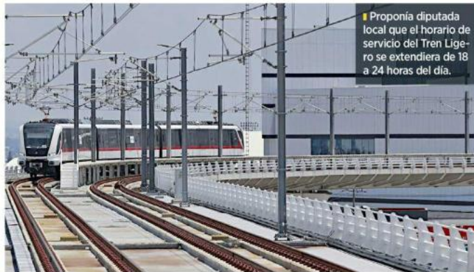
Proponía diputada local que el horario de servicio del Tren Ligero se extendiera de 18 a 24 horas del día.

que no exista circulación de trenes, la interrupción nocturna en los servicios de pasajeros permite realizar el mantenimiento esencial y la limpieza de las vías e instalaciones de manera segura y sin afectar a los pasajeros”, indicó Tejeda Coronado en el oficio.