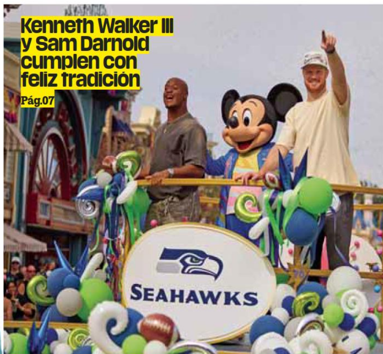
NFL El MVP del Super Bowl LX y el QB de Seahawks, cumplieron la tradicional visita a Disneyland.