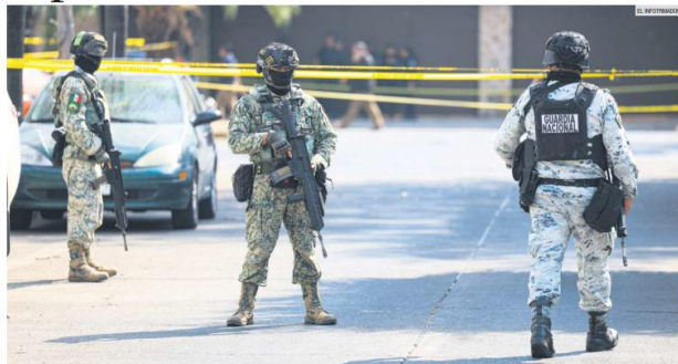
INSEGURIDAD. Diversos países han desarrollado protocolos especiales para responder a las balaceras y los hechos de alto impacto en espacios públicos.

Aplican operativos para atender balaceras: contención, reacción aérea, evacuación y persecución