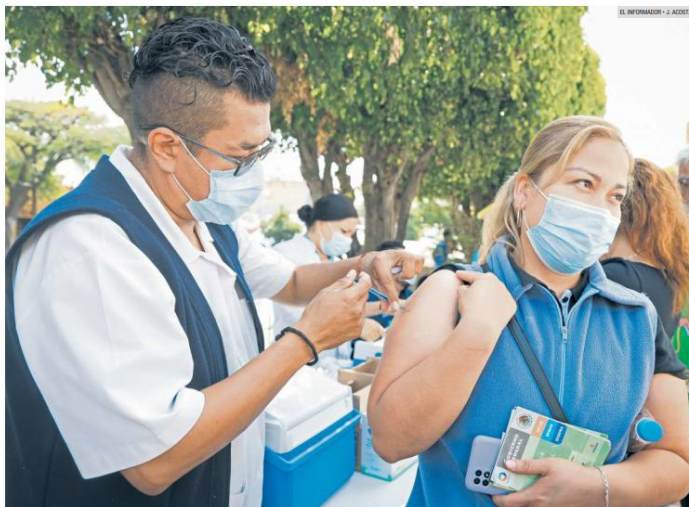
ALTA DEMANDA. Largas filas se registraron en los módulos de vacunación contra el sarampión el fin de semana, como parte de la estrategia para controlar el brote.