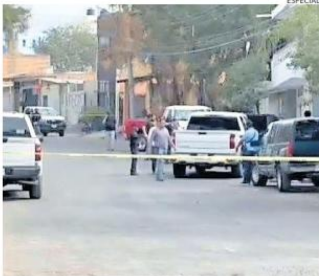
SOBRE LA AVENIDA PATRIA. El enfrentamiento con saldo mortal se registró en la zona de Santa Cruz de las Huertas.

De manera preliminar se reportó la detención de entre cuatro y seis