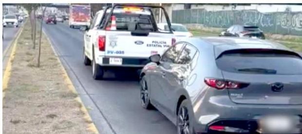
El conductor del vehículo derribó los conos delimitantes.

El operativo Salvando Vidas, es una estrategia de seguridad vial de carácter preventivo, cuyo objetivo es reducir de forma significativa los accidentes de tránsito, decesos y lesiones graves asociadas a la conducción bajo los efectos del alcohol.