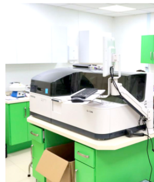
Los servicios se caracterizan por tener costos significativamente menores.

Torres Vázquez agregó que, conforme a lo establecido en la Ley de Ingresos del municipio, se aplican descuentos de hasta el 50 por ciento para personas adultas mayores y personas con discapacidad.