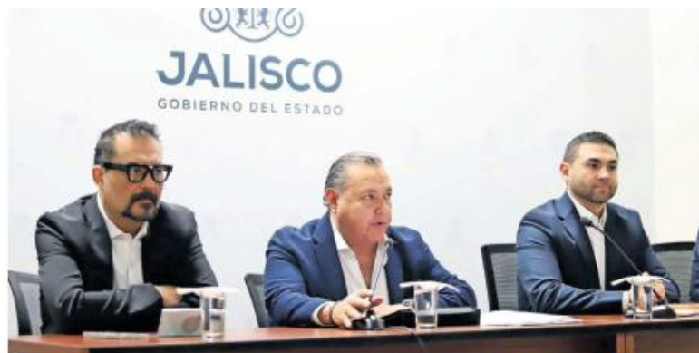
OFICINAS. El procurador social de Jalisco (al centro) resaltó el crecimiento en la cobertura de la Prosoc durante 2025.