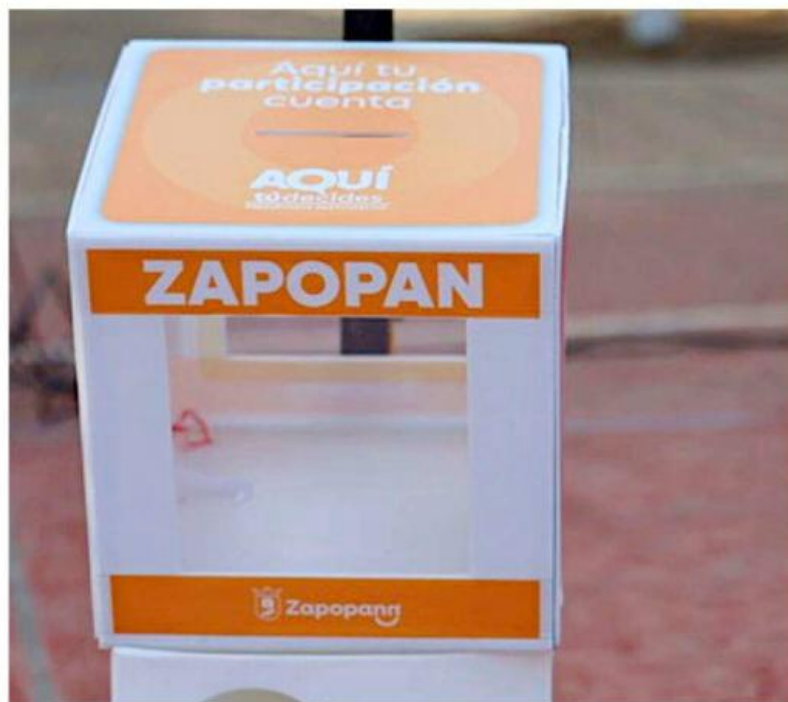
Los ciudadanos podrán emitir sus votos en este tipo de buzones que se instalarán en distintos puntos del municipio.

“Abrimos una convocatoria en cada mayo para que se inscriban personas que quieran conformar consejos so-