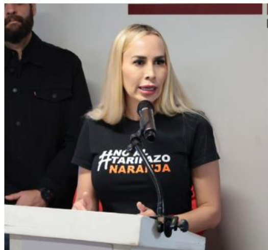
La morenista rechaza respaldo al alcalde detenido. ESPECIAL

“Por favor, la autonomía de los municipios es ante todo. Decirle que no va a poder hacer lo que él quiere, que poder siempre cuidar a los poderosos, porque también estamos viendo en redes sociales que están queriendo mentir, diciendo que hay una supuesta expropiación de Tequila en Cuervo, lo que es total y completamente mentira. Lo que se está haciendo es revisando, porque pues ahora sí que las fábricas tenían adeudos importantes de licencia, de predial, de áreas de cesión y obviamente no quieren pagar”.