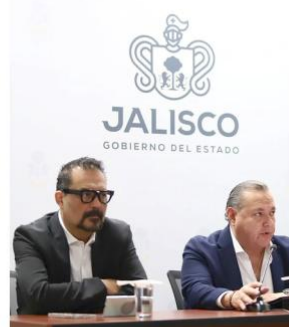
Plantearon la preliberación de mujeres presas por delitos menores.

En rueda de prensa también se informó que, a través de convenios con los municipios de Guadalajara, Tlajomulco, Tlaquepaque y Zapopan, la Procuraduría Social ha acudido a 26 colonias, donde se han otorgado más de 49 mil servicios, entre ellos 850 patrocinios o juicios, de los cuales 200 ya fueron resueltos de manera favorable.