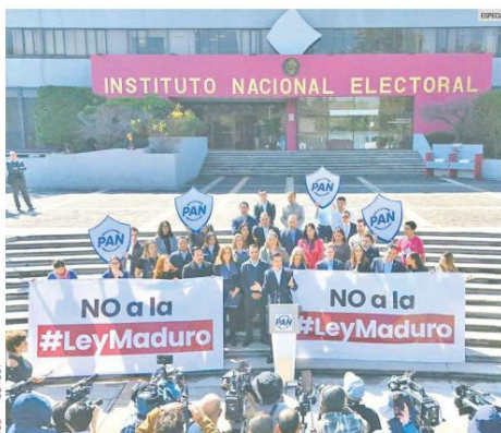
CONFLICTO. El choque entre Morena, PT y PVEM por la reducción de los plurinominales, el financiamiento y más fiscalización, volvió a frenar la reforma electoral. Pero PAN y PRI también fijaron una postura en contra.