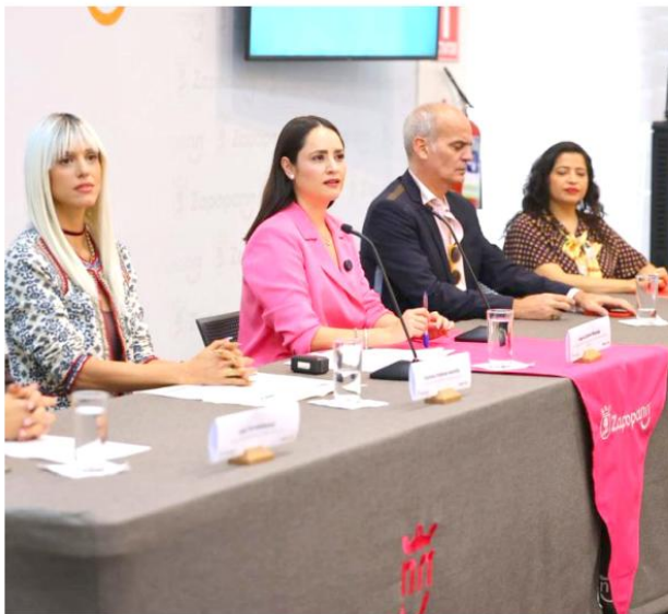
El evento se ha consolidado como un espacio que promueve valores.

Para esta edición, el programa contempla un área de juegos, cena al aire libre y mercado holístico