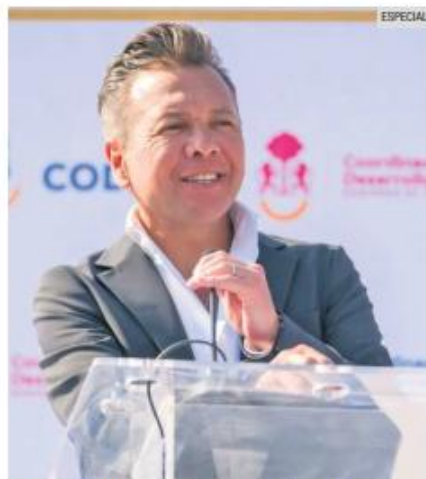
PABLO LEMUS. El gobernador informó que revisarán el proyecto del tren México-Guadalajara.