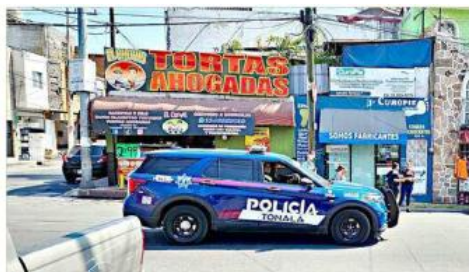
Los hechos fueron en el Centro de Tonalá.

Tras no localizar al sospechoso, las autoridades indagaron más en los alrededores y posteriormente se retiraron del sitio. Las investigaciones continuarán para lograr la aprehensión.