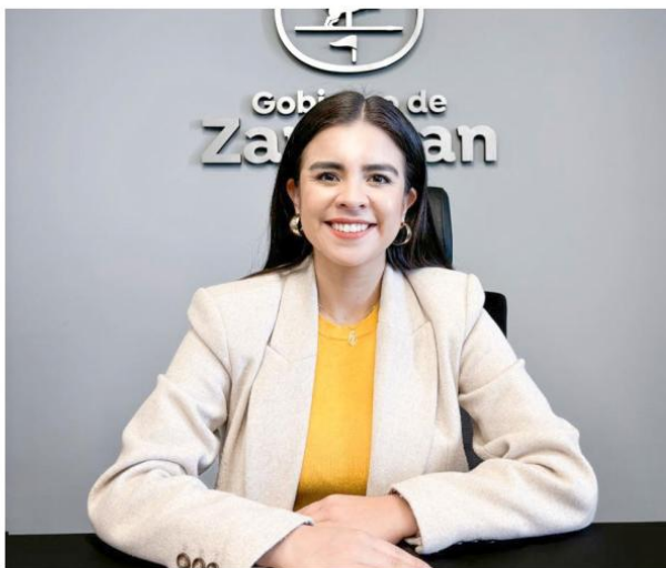
La ciudadanía puede elegir entre 30 proyectos, distribuidos en 10 zonas de la ciudad.

Los 30 proyectos no los propone el Gobierno, sino las y los vecinos organizados en consejos sociales. Estos consejos se forman con habitantes de las colonias y cada año pueden presentar propuestas.