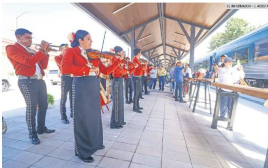
TURISMO. El pueblo de Tequila, uno de los principales atractivos turísticos que el Gobierno del Estado busca fortalecer rumbo al Mundial de Fútbol 2026.

La funcionaria reconoció que la detención del ex presidente municipal ha generado inquietud, especialmente en términos de percepción de seguridad. Sin embargo, conside-