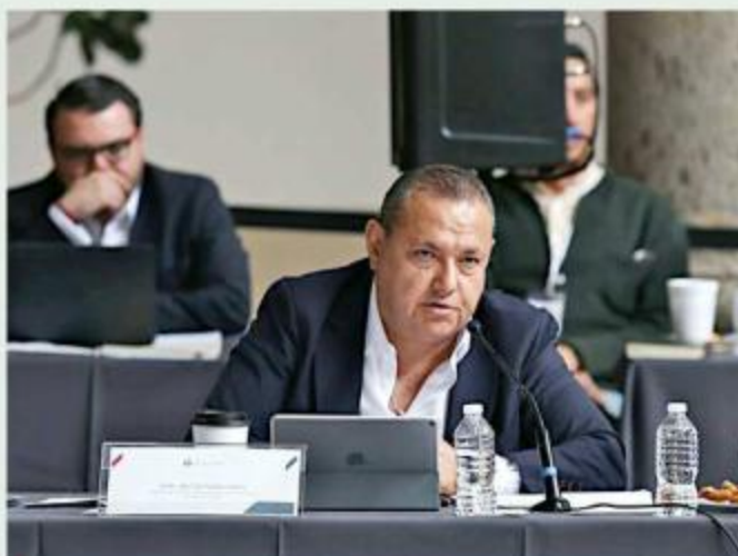
■ Héctor Pizano Ramos, titular de la Procuraduría Social.

“Tenemos más de 143 mil atenciones dadas el año pasado, tiene que ver con a todas las personas que estamos atendiendo a través del módulo itinerante, que ha sido para nosotros uno de los principales mecanismos para acercarnos a la gente en municipios de la Zona Metropolitana, llevamos a cabo módulos que atienden por lo menos al día 600 o 700 personas”, señaló el