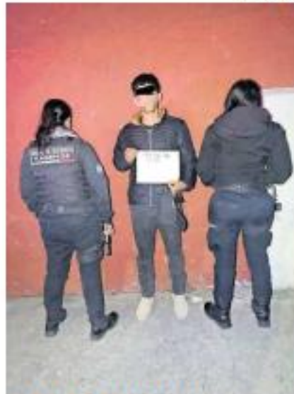
FUERA DEL ESTADO. Los menores buscaban ir a Guerrero tras promesas de empleo con altas percepciones.