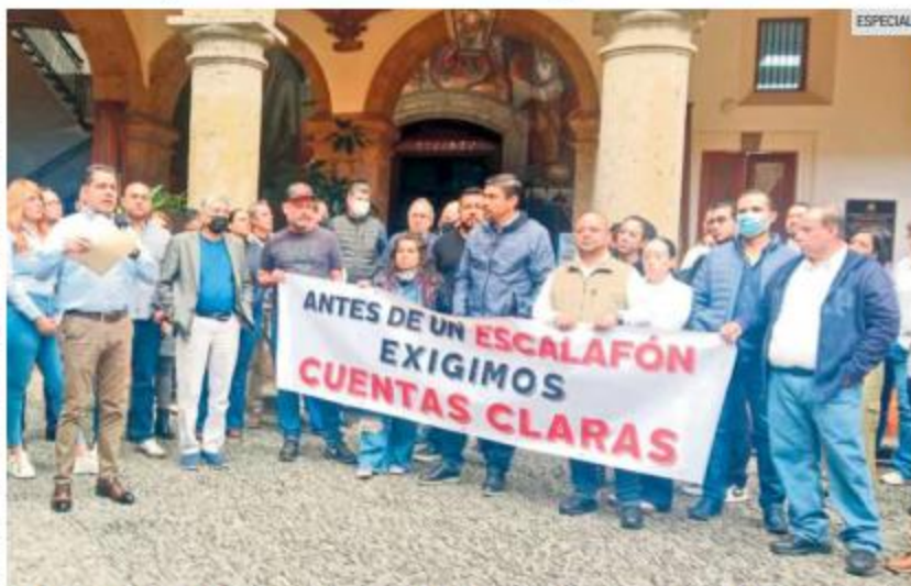
PROTESTAN. Agremiados del sindicato del Congreso de Jalisco se manifestaron para exigir la aplicación del escalafón y mayor transparencia interna.