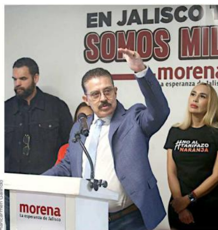
■ El senador de Morena, Carlos Lomeli, destacó que las nuevas medidas aplicarán para el proceso electoral de 2027.