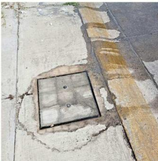
■ Denuncian vecinos que la fuga no ha sido atendida debidamente por el SIAPA.

“Se ha reportado de distintas formas al SIAPA, por teléfono, también yendo presencialmente. En una ocasión vinieron hace como unos dos meses, hicieron un trabajito así un poquito superficial y dijeron que si seguía el problema —por cierto, vinieron como a las 3 de la mañana—,