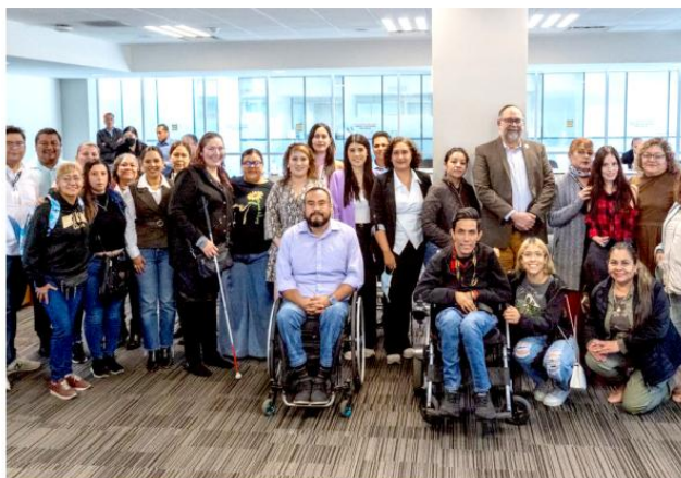
Se planteó la necesidad de diseñar programas de reincorporación educativa.

Durante el encuentro, las y los participantes coincidieron en que la inclusión no debe entenderse como la adaptación de las personas con discapacidad a los entornos existentes, sino como la obligación de que los espacios educativos, urbanos y administrativos se transformen para