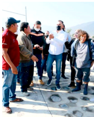
Gobierno de Tlajomulco

Para estas acciones se destinarán 5 millones de pesos.