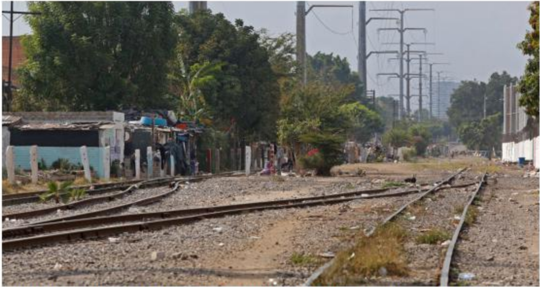
Abordará política y seguridad en Pueblo Quieto que sería parte de la ruta. FERNANDO CARRANZA