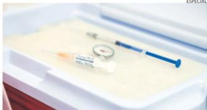
NOSOCOMIO. En el municipio hay varios módulos de inmunización y entre ellos se incluye el ubicado en el Hospital Tonalá Centro.

En materia de vacunación, la funcionaria indicó que desde septiembre del