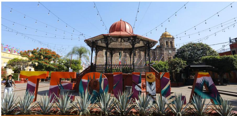
Lemus Navarro, se reunirá con empresarios tequileros, hoteleros y el sector turístico.

El Gobernador de Jalisco realizará un recorrido por el Pueblo Mágico para garantizar certeza y seguridad tras la designación de una alcaldesa interina