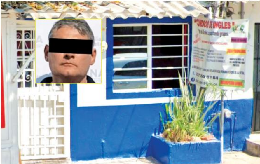
El maestro detenido ofrecía clases en la finca en donde se realizó el cateo. En el recuadro, el acusado.

La Fiscalía de Jalisco informó que inició la investigación del ca-