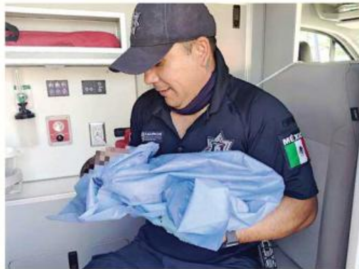
El bebé y la madre fueron reportados estables.

Minutos después arribaron paramédicos, quienes continuaron con la valoración de la madre y su hijo. Ambos fueron trasladados a un hospital y su estado de salud fue reportado como favorable, agregó la Policía municipal.