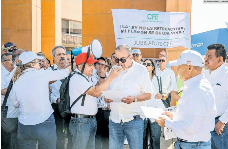
PROTESTAS. Jubilados de la CFE se manifestaron en el Centro Histórico de Guadalajara para rechazar la reforma a la Ley de Pensiones, que limitará sus ingresos. Advierten que la retroactividad de la medida reducirá sus pagos mensuales.

Para contener la inflación, la Presidenta acuerda con gasolineros que el precio no supere los 28.50 pesos por litro