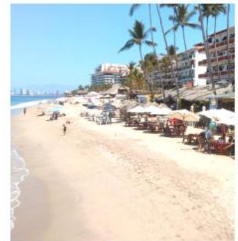
Se prevé alcanzar el 100 por ciento de ocupación hotelera en las vacaciones.

De acuerdo con el funcionario, los tres niveles de Gobierno trabajan en la reactivación del turismo, luego de que algunos destinos registraran cancelaciones tras los hechos violentos.