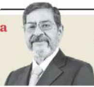
Jesús Rangel "La riesgosa apuesta del Banxico con el recorte de tasas" - P. 17