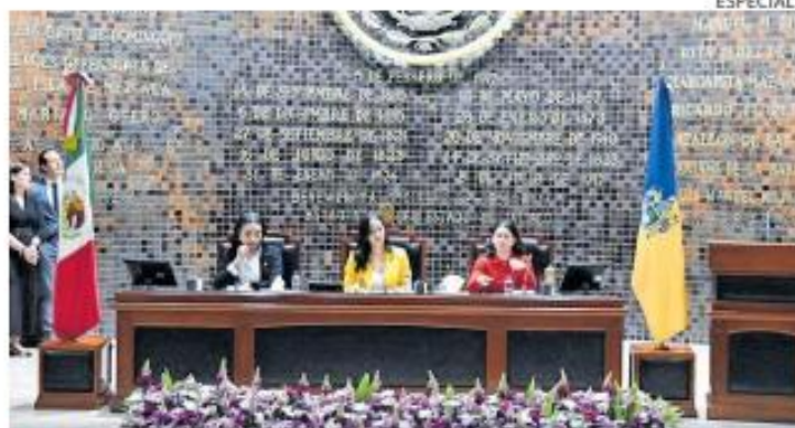
2026-2027. El decreto aprobado indica que el cambio de régimen será aplicable para el próximo proceso electoral.

dejará de elegir a sus autoridades mediante partidos políticos y adoptará un modelo basado en usos y costumbres, reconocido en el marco constitucional como parte del derecho de los pueblos