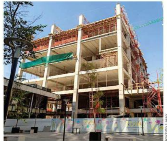
El complejo de la CCD, donde se construye la Torre B, se ubica en la Calle Independencia esquina con Baeza Alzaga.

El proyecto se prepara para entrar en su segunda fase de construcción, así como en una nueva etapa de promoción.