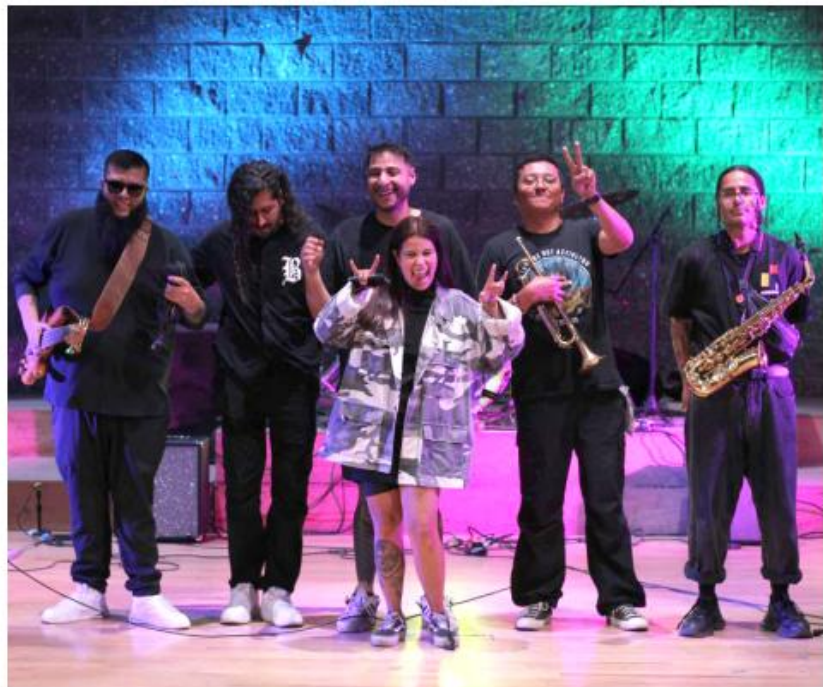
Gobierno de Zapopan

Está dirigida a artistas y agrupaciones del Área Metropolitana de Guadalajara