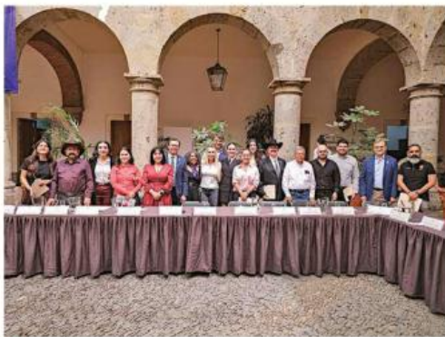
Los legisladores de Morena, Hagamos, Futuro y PT, sostuvieron una reunión con integrantes del partido morenista.