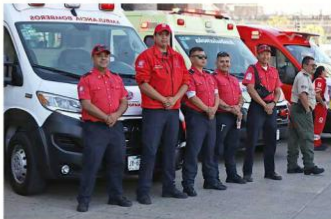
■ Los despliegues buscan que la población tenga unas vacaciones seguras.

Operativo Interinstitucional 2026, en la cual participarán más de 10 mil elementos, entre ellos 7 mil para resguardar la seguridad en el Estado.