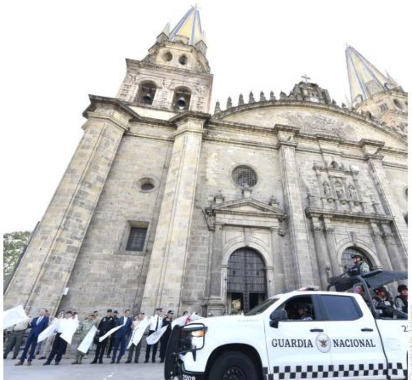
El gobierno de Jalisco dio el banderazo oficial al operativo de Semana Santa.

En el acto protocolario se exhibieron diversas unidades operativas, desde vehículos de respuesta inmediata