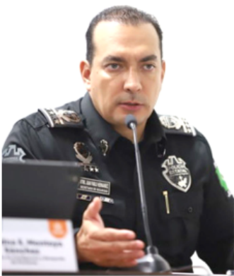
El secretario de Seguridad, admitió que la región ha carecido de una estrategia.

El secretario de Seguridad admitió que la región ha carecido de una estrategia de vigilancia constante en periodos anteriores. Ante este escenario, el compromiso institucional actual es establecer una presencia policial permanente en las comunidades de Jilotlán de los Dolores para garantizar el estado de derecho.