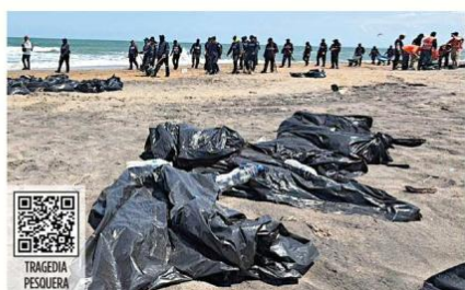
Decenas de bolsas con "chapo" se acumulan en una playa de Alvarado, Veracruz, mientras un pescador muestra los efectos en sus manos al recoger el hidrocarburo que sigue saliendo.

"Por eso en esta administración lo estamos corrigiendo, una vez que se detectó esta situación, y estamos preparando brigadas en las que vamos a ir a llevar servicios a la comunidad porque también nos estuvimos entrevistando y mencionaban abusos por parte de esta gente, pero por miedo no denunciaban".