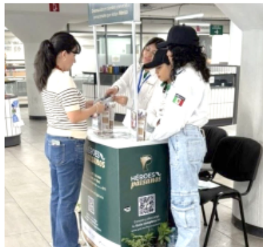
Gobierno de Guadalajara

El módulo se encuentra actualmente en operación.