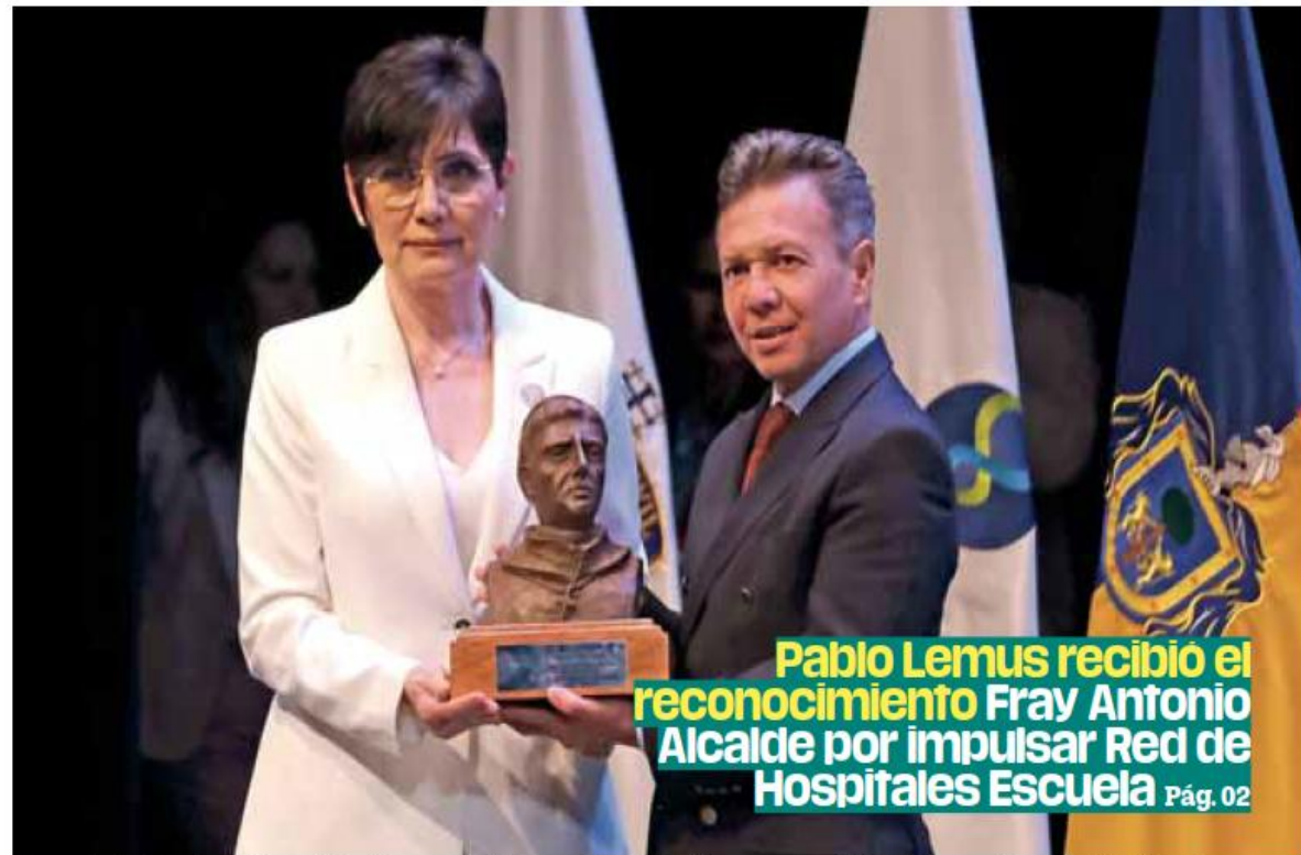
Pablo Lemus recibió el reconocimiento Fray Antonio Alcalde por impulsar Red de Hospitales Escuela Pág. 02

Economía. Una nueva amenaza para el bolsillo se aproxima para los mexicanos, pues el aguacate, limón, papa, tomate y jitomate sufrirán alza de precios por fertilizantes y energéticos; kilos alcanzarán los $100. / Pág. 03