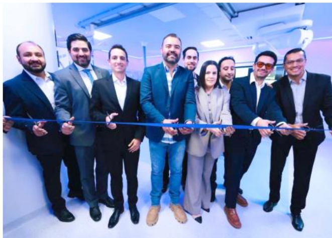
La Sala de Hemodinamia posiciona a este hospital como un referente en su tipo.

Esta nueva área no solo representa infraestructura hospitalaria, sino una apuesta por elevar la calidad de la atención médica en el municipio