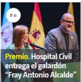
Premio. Hospital Civil entrega el galardón "Fray Antonio Alcalde"