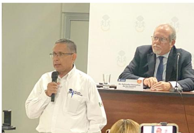
La Fiscalía del Estado informó que cuenta con más de 200 oficiales de prueba.

El titular de la Fiscalía precisó que, además de la búsqueda de personas aún no identificadas, continúa el proceso judicial en contra de Moisés N,