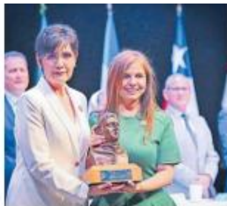
CRECIMIENTO. Planter Pérez afirmó que la UdeG mantendrá su compromiso de ampliar la red de Civiles.

El premio se entregó durante la inauguración de la última edición del Congreso Internacional de Avances en Medicina (CIAM).