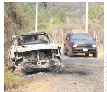
Actualmente, se realiza un proceso de registro y análisis de los casos.

En paralelo, indicó que alrededor del 70 por ciento de las cerca de 400 tiendas de conveniencia afectadas ya reanudaron operaciones, tras presentar sus denuncias correspondientes.