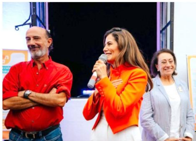
Está ubicado en la calle Marcos Castellanos (entre Pedro Moreno y López Cotilla).

Este atractivo integra obras emblemáticas como la Casa Barragán, la Casa Molina y el Edificio Alejandro Zohn