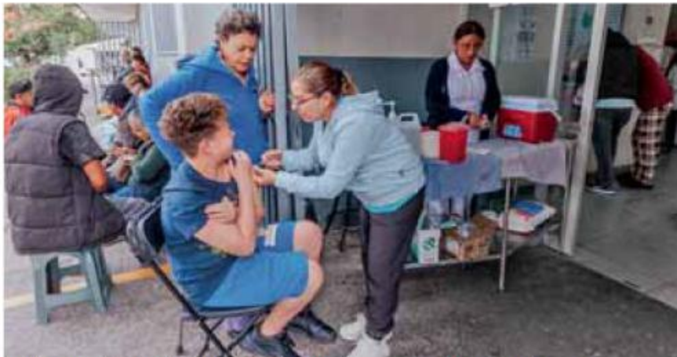
Dosis. Las medidas autoridades reforzaron las campañas de vacunación en todo Jalisco.

Registro. La dependencia reporta disminución de casos, pero mantiene estrategias activas de vacunación y prevención ante el riesgo de repunte durante el periodo vacacional