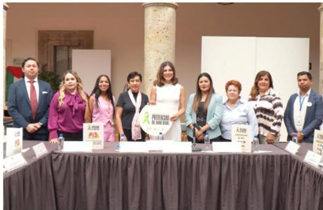
En México, el 35% tiene hipertensión arterial que pueden conducir a enfermedad renal.

Hasta el 8% de la población adulta pudiera presentar un grado de daño; es indispensable el diagnóstico oportuno y la atención integral