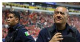
Protocolo mundialista Refuerzan estrategia contra trata y explotación infantil