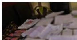
Indagan fraudes bancarios Desmantelan un call center clandestino en San Andrés

ALAN CASTELLANOS, GUADALAJARA Un presunto punto de control en los límites entre Michoacán y Jalisco, operado por grupo de autodefensas, fue detectado por autoridades de la Secretaría de Seguridad del Estado, la cual informó que los sujetos se identificaban como policías comunitarios que custodiaban campamentos en zonas serranas e iban en una camioneta rotulada como "Guardia Civil". PÁG. 2