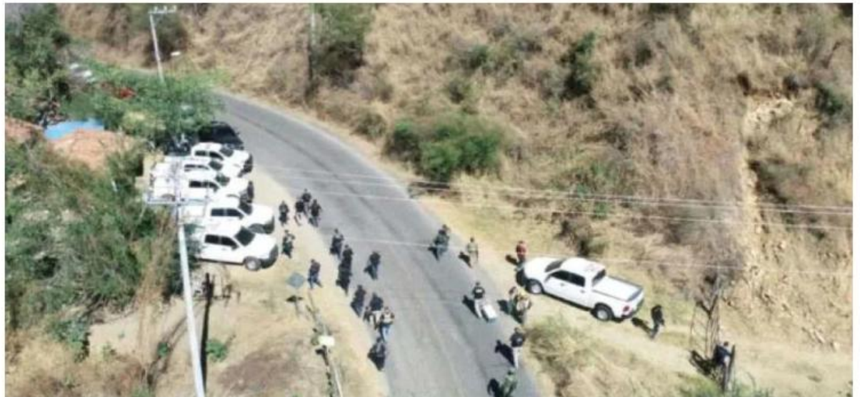
Autoridades refuerzan la presencia policial en la frontera entre ambos estados. MILENIO

A principios de este mes, los gobiernos de ambos estados acordaron la colaboración para fortalecer la seguridad con intercambio de inteligencia y operativos conjuntos en la región fronteriza, donde también se reforzará la presencia de autoridades de seguridad pública, y el apoyo de la Defensa y la Guardia Nacional. ■