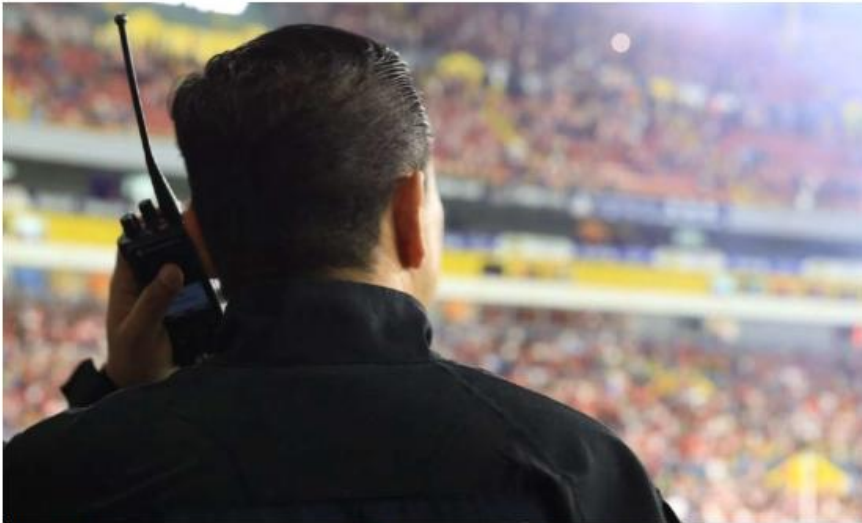
Elementos estarán atentos a la presencia de menores de edad. MILENIO

Plan. Autoridades capacitan a oficiales para evitar la incidencia en el Mundial ante el riesgo de incidencia por el turismo masivo