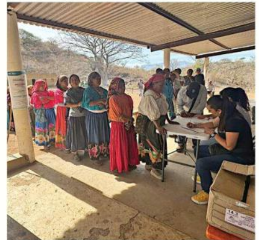
■ En mayo de 2025, habitantes de Bolaños votaron en consulta por modificar su régimen de gobierno.

sobre lineamientos, el decreto dice que iremos a consulta; en la consulta habrá que poner los lineamientos de ele-