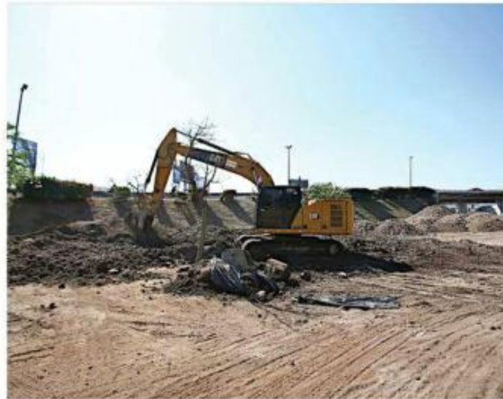
■ En la zona ya comenzaron las obras para habilitar el estacionamiento.

La Setran informó que, para despejar dudas y compartir avances del estacionamiento para taxis de plata-