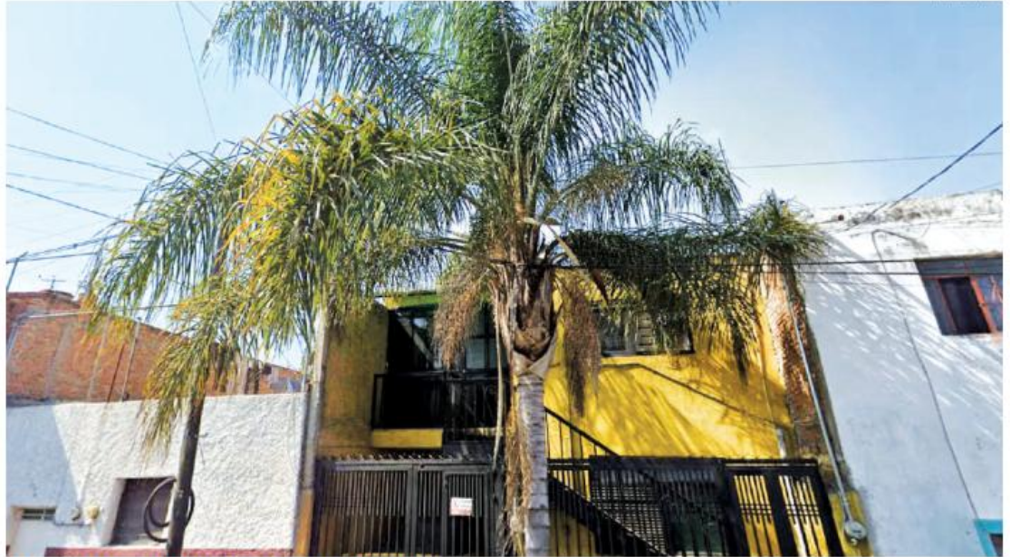
En una finca del barrio de San Andrés operaba el call center.

Los detenidos ofrecieron dinero en efectivo y vehículos a cambio de que los agentes los dejaran libres y se retiraran, pero el intento de soborno fue rechazado, por lo que las cinco perso-