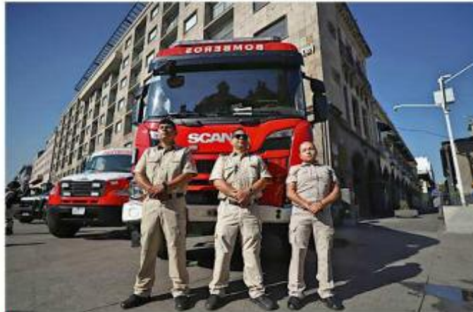
■ Miembros de Protección Civil brindarán apoyo en diversos puntos del Estado.