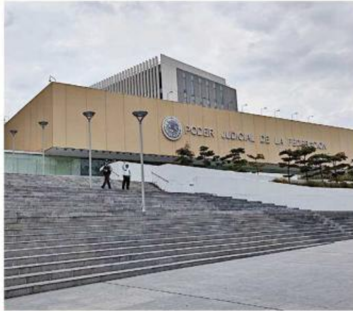
■ En 2027 está prevista otra elección de jueces federales.

"En siete estados el PE impulsó de manera discreta pero efectiva a la mitad o po-