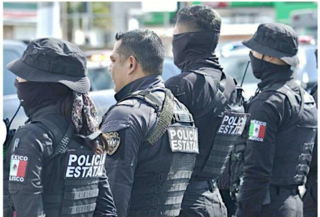
El Servicio de Inmigración y Control de Aduanas brindó instrucción a policías de Jalisco.