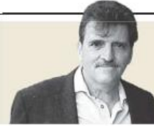
Enrique Serna "Ancianos con poder quizá sean un peligro para el género" - P. 23