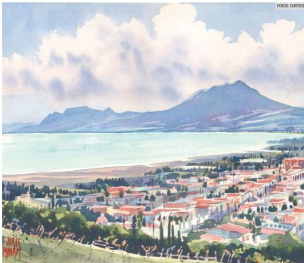
PAISAJE. Acuarela que muestra la belleza del municipio de Jocoitepec, en la Ribera de Chapala.

Entre las piezas seleccionadas se encuentran escenas de localidades como Cajititlán, la Barranca de Huentitán o el entorno del mercado de San Juan de Dios, lugares que forman parte del imaginario cotidiano del estado y que, en la obra de Monroy, adquieren una dimensión distinta a partir de la luz, el color y la composición. La exposición también permite observar la evolución técnica del artista y su persistencia en el uso de la acuarela como medio principal de expresión. La técnica, caracterizada por su transparencia y su capacidad para capturar matices de luz, se convierte en una herramienta para registrar el paisaje con una mirada atenta y sostenida.