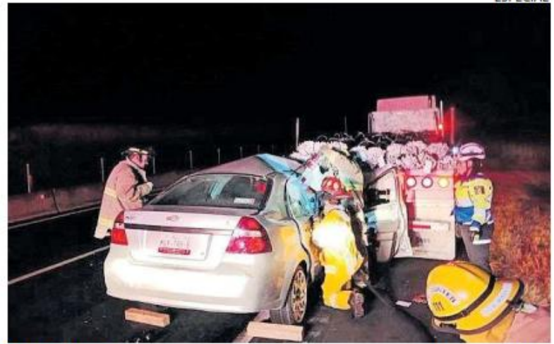
EN LOS ALTOS. El accidente registrado en la autopista Lagos de Moreno-Zapotlanejo dejó una persona muerta y cuatro más heridas.

meros de emergencia, el percance ocurrió en los carriles con dirección hacia Chapala, donde una camioneta familiar se impactó primero contra un muro y posteriormente volcó, quedando completamente destrozada.