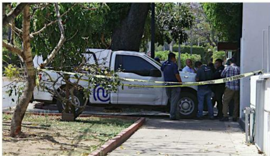
Personal forense trasladó el cuerpo del trabajador a la morgue.

Realizaba labores de mantenimiento en un edificio y da paso en falso