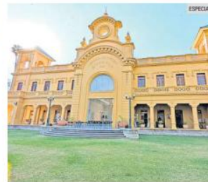
ARQUITECTURA. Fachada del Centro Cultural J. Jesús González Gallo.

El Centro Cultural se ubica en avenida González Gallo s/n, en el centro de Chapala, y mantiene horarios habituales de martes a sábado de 11:00 a 17:00 horas, y domingos de 11:00 a 14:00 horas. Todas las actividades del aniversario son de acceso libre.