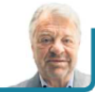
X: @JorgeGCastaneda Jorge Castañeda G.