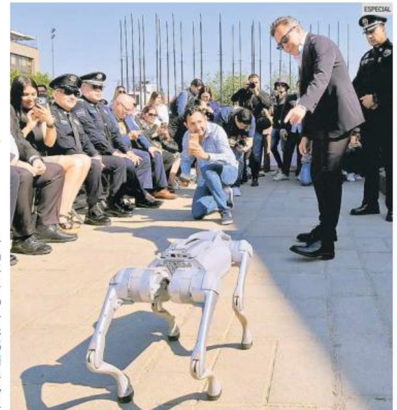
PABLO LEMUS. El gobernador presenta equipamiento de seguridad y muestra un perro robot antiexplosivos durante el acto oficial.

El equipamiento entregado implicó una inversión total superior a 206 millones de pesos. De este monto, el Gobierno de Jalisco aportó más de 87.5 millones de pesos. Los recursos federales sumaron 118.5 millones, provenientes del Fondo de Aportaciones para la Seguridad Pública y del Fondo para el Fortalecimiento de las Instituciones de Seguridad Pública.