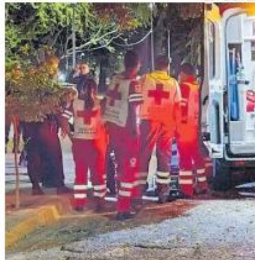
LA ZONA. El sujeto fue atacado en las inmediaciones del Parque Morelos.