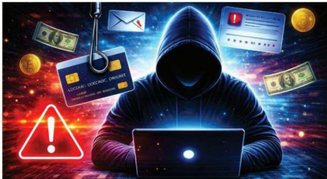
■ Hackers acceden a Big Data, entre otras tecnologías, para diseñar estrategias precisas.

que el mayor problema no es tecnológico, sino cultural.