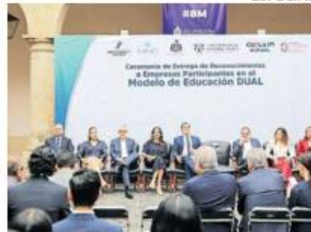
SEDE. Los reconocimientos se entregaron en un evento realizado en el Congreso local.