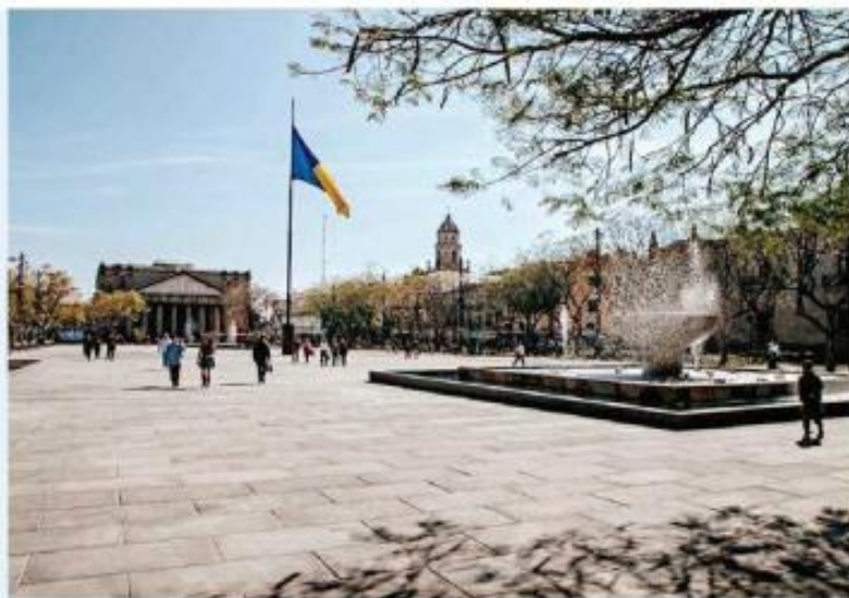
La Plaza Fundadores está considerada como uno de los hitos urbanos de Guadalajara.

Sin embargo, las actividades comerciales quedaron excluidas de estos espacios.