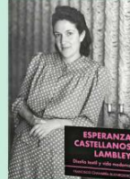
El libro "Esperanza "Plan" Castellanos Lambley: Diseño Textil y Vida Moderna" busca mostrar a la gran figura que fue esta mujer.

Otro de los hallazgos surgió de manera inesperada. A partir de la difusión de la investigación, personas que no habían sido localizadas inicialmente se acercaron para compartir piezas que conservaban: muestras de telas, prendas y, de manera destacada, un vestido tipo caftán . Estas piezas, que no llegaron a exhibirse, se integran al libro como parte de