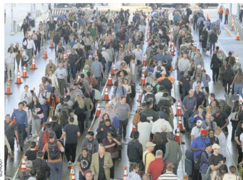
HOUSTON. Largas filas en filtros de seguridad saturan los aeropuertos de Estados Unidos ante la falta de personal, derivada del cierre parcial del Gobierno de Estados Unidos y el retraso en el pago a los trabajadores.