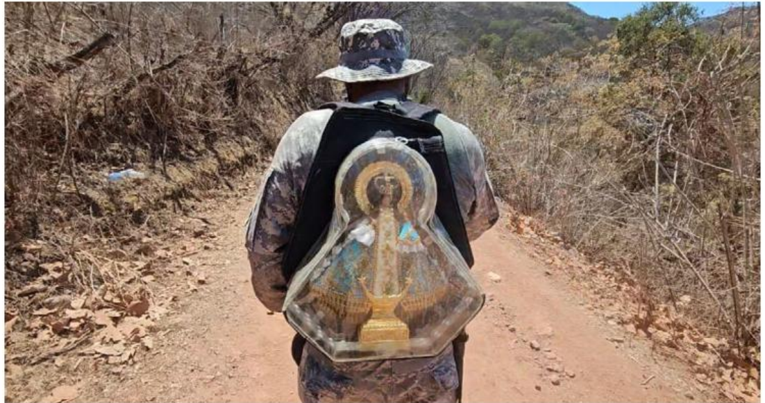
La meta de los fieles participantes: llegar a la Basílica de Talpa de Allende JUAN CARLOS MUNGUÍA

América confiesa que hizo su primer viaje en 1990, cuando las condiciones eran más rudimentarias, muy diferente a lo que actualmente se vive, sin perder el esencia contacto con la naturaleza. "Antes nos agarrábamos de las raíces de los árboles para bajar los cerros", relata.