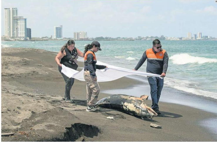
IMPACTOS. Tras el derrame de hidrocarburos se han retirado más de 430 toneladas de contaminantes y se han atendido más de 200 kilómetros de litoral afectado en Estados como Veracruz y Tabasco. Continúan las investigaciones para determinar el origen de la contaminación.