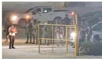
Elementos de la Marina tomaron la terminal marítima de Punta Venado en marzo de 2023.

La zona declarada en septiembre de 2024 como