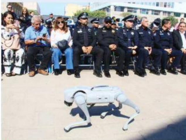
La entrega incluyó dos perros robots antiexplosivos.

“La tecnología y el equipo táctico marcan la diferencia para una intervención exitosa”.