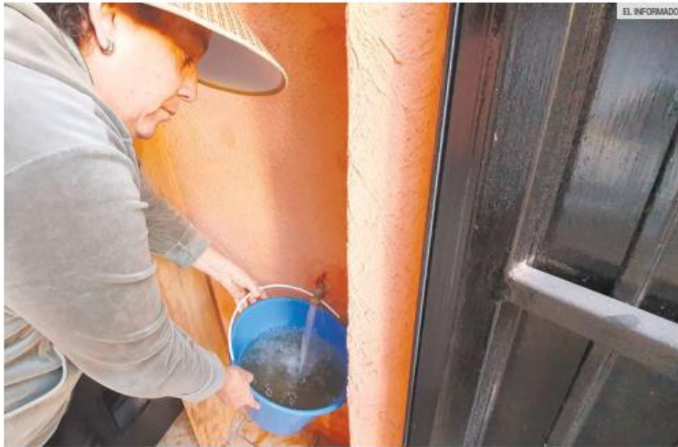
PENDIENTE. Una mujer recolecta agua turbia de la llave en su vivienda, evidenciando problemas en el suministro doméstico.

Entre las obras de largo plazo, el Gobierno estatal contempla la construcción de un segundo acueducto Chapala-Guadalajara, así