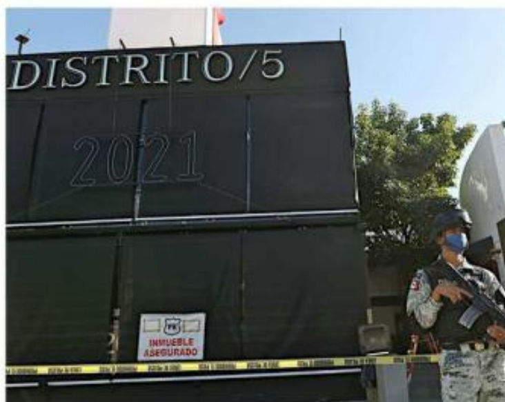
■ El asesinato ocurrió el 18 de diciembre de 2020.

Explicó que en esta etapa se plantean incidentes y excepciones antes de revisar las pruebas. Después se depuran y se desechan algunas.