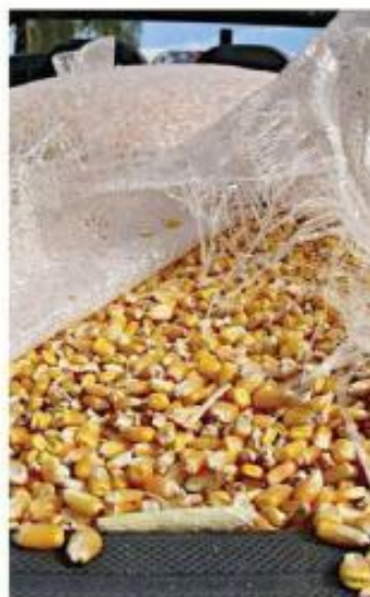
■ Productores de maíz de Tlajomulco recibirán un apoyo extra de 300 pesos por tonelada.

Tlajomulco fue el primer Municipio a nivel nacional en crear un fondo para maiceros. Zapopan y Tala, también en Jalisco, siguieron sus pasos y aportarán, cada uno, 150 pesos extra por tonelada de maíz blanco.