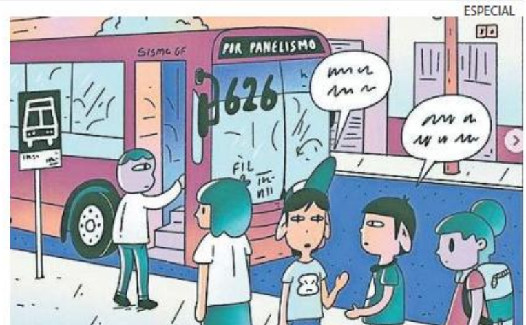
FERIA. La historieta se publicará de forma mensual durante 2026 por los diez del Salón del Cómic + Novela Gráfica.