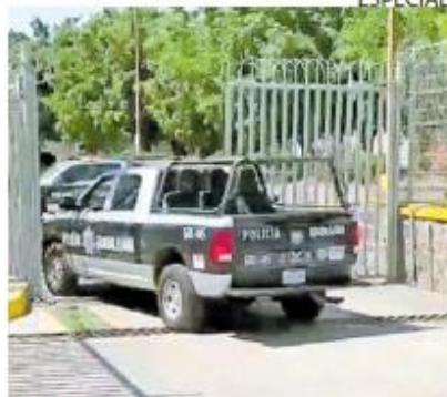
CADAVÉR. Elementos municipales de Guadalajara confirmaron el hallazgo.