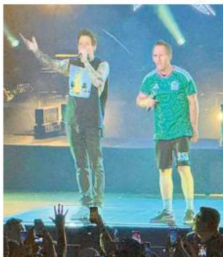
VELADA. El público coreó cada tema mientras un mar de luces acompañó los momentos más emotivos de la noche.