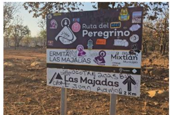
La travesía comprende horas con la naturaleza J.C. MUNGUÍA

En esta Semana Santa, mientras las pisadas vuelvan a llenar los senderos, la familia Vázquez Santana estará nuevamente en el camino, al igual que muchas más que, paso a paso, confirman que la devoción se hereda y la tradición se camina. —