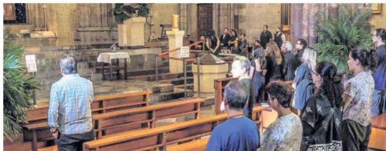
TEMPLO EXPIATORIO. Entre vitrales y silencio, familiares, amigos y artistas se reunieron para darle el adiós en un ambiente íntimo.