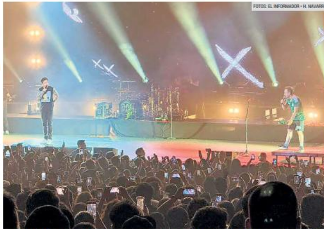
SIMPLE PLAN. La banda ofreció un show cargado de energía y nostalgia, con un repertorio que hizo vibrar al público de principio a fin.