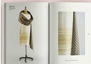
Francisco Chavarría recuperó muchas piezas diseñadas por "Plan" y las integró al volumen.

Más que rescatar a una figura olvidada, Esperanza "Plan" Castellanos Lambley: Diseño Textil y Vida Moderna , (que está de venta en Editorial Arquitécnica, -Eclipse 2685-), propone otra forma de entender el diseño en México: una en la que los textiles, los interiores y los objetos domésticos también construyen modernidad, concluye Chavarría.