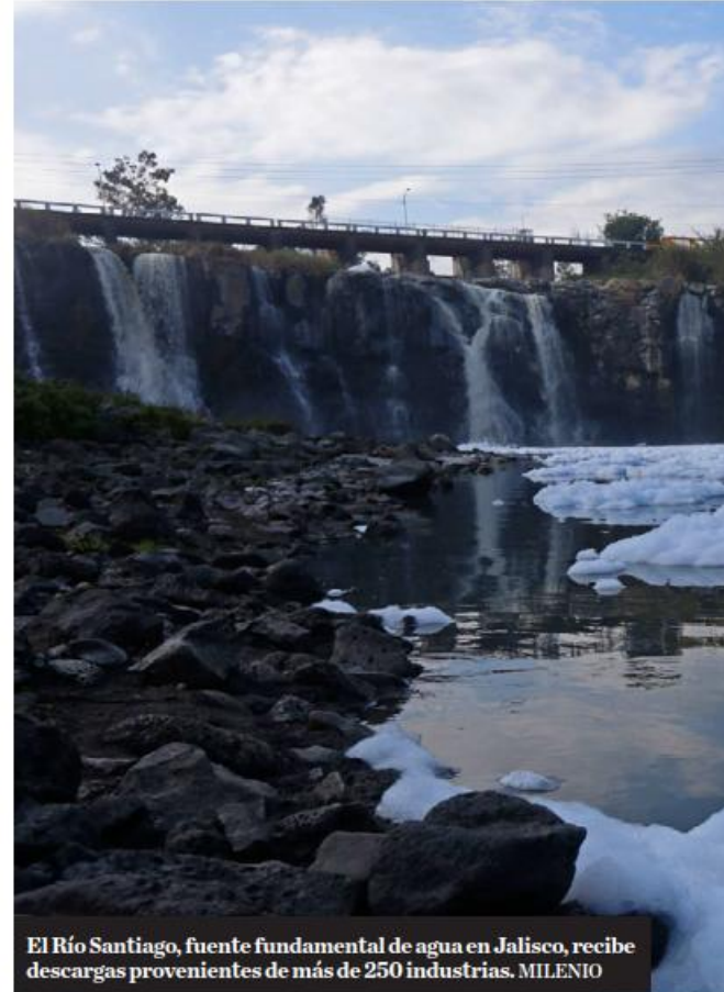
El Río Santiago, fuente fundamental de agua en Jalisco, recibe descargas provenientes de más de 250 industrias.

Entre las medidas de modernización anunciadas figuran la incorporación de tecnología para la detección de fugas, la habilitación de un chatbot para que la ciudadanía reporte problemas en la red y