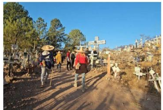
El "Espinazo del Diablo", el tramo complejo J.C. MUNGUÍA