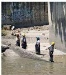
■ Bomberos sacaron el cuerpo del agua.