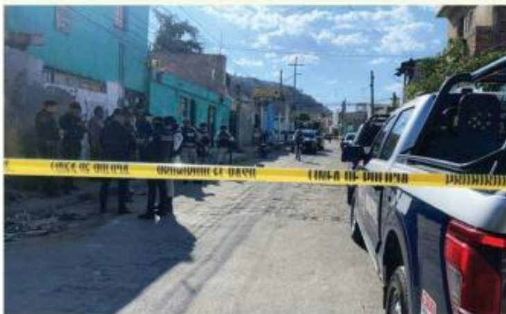
La agresión ocurrió en Santa Ana Tepetitlán.

En el lugar, las autoridades retuvieron a un adolescente, quien fue señalado por una de las víctimas como presunto participante en la agresión.