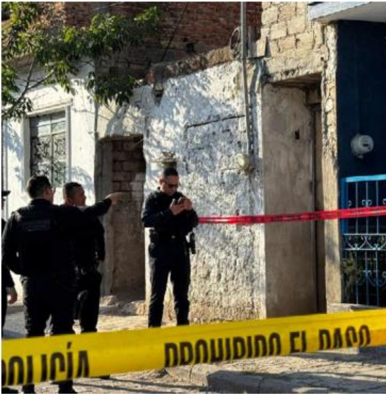
Los hechos se registraron en Santa Ana Tepetitlán.