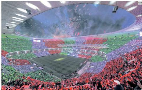
IMPONENTE. El Estadio Azteca reabrió sus puertas y recibió a más de 81 mil aficionados para el encuentro amistoso entre la Selección Mexicana y la de Portugal. El recinto vivirá el partido inaugural de la Copa del Mundo 2026.

Al medio tiempo, los aplausos comenzaron a mezclarse con los primeros silbidos. La expectativa seguía viva, pero ya no era la misma.