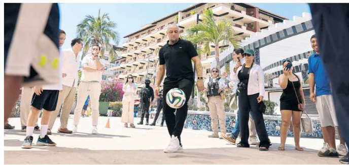
ESTRELLA. El ex futbolista brasileño Roberto Carlos fue captado demostrando sus habilidades con el balón, en Puerto Vallarta; un destino ideal para los amantes del fútbol.

terrazas y restaurantes comienzan a llenarse mientras la ciudad se prepara para su vida nocturna. La cercanía entre el Malecón, el centro histórico y la playa convierte a esta zona en uno de los espacios más transitados por visitantes y habitantes locales. Allí se puede observar la mezcla entre tradición mexicana y vida cosmopolita que ha definido a Puerto Vallarta durante las últimas décadas.