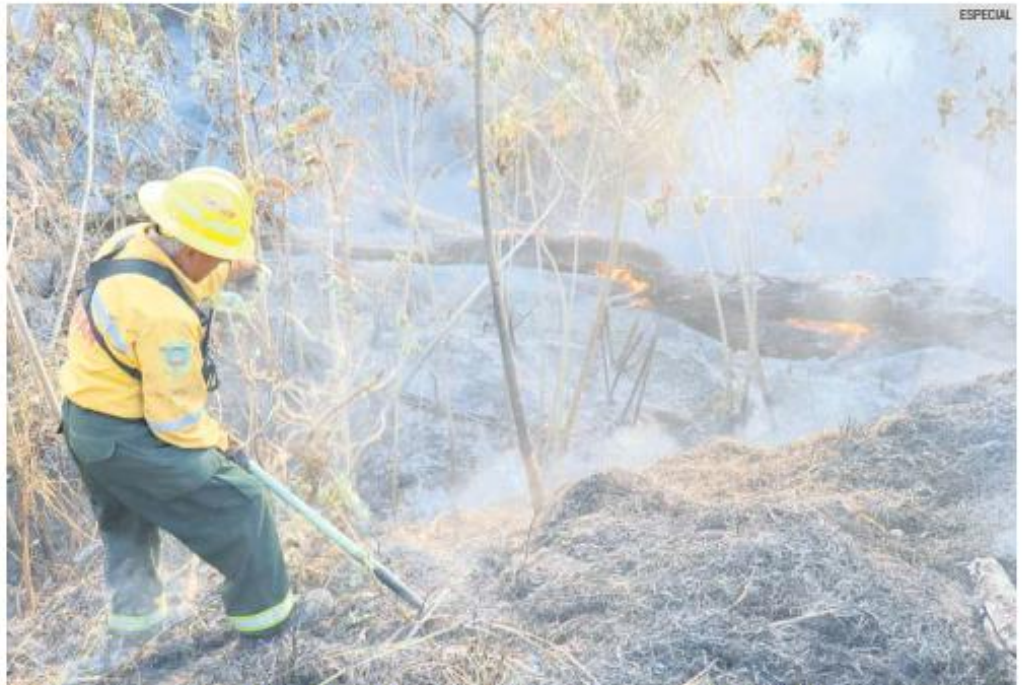
CONTROL. Brigadistas y bomberos sofocaron el incendio en el Bosque El Centinela, donde se afectaron varias hectáreas de vegetación.

Hasta el momento, las autoridades no han determinado las causas que originaron el incendio.