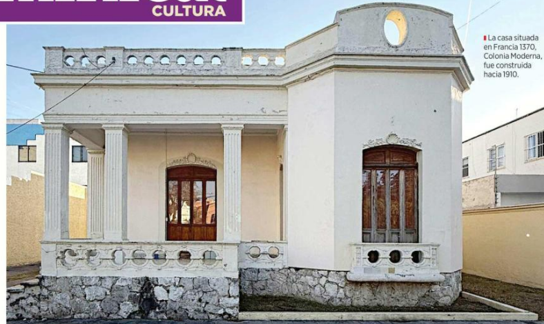
La casa situada en Francia 1570, Colonia Moderna, fue construida hacia 1910.

"Estamos tratando de ser muy respetuosos con la intervención, en el interior habrá muy pocas modifi-