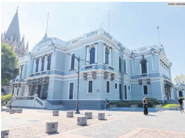
MUSA. El recinto ofrece un abanico de actividades para disfrutar las vacaciones con un toque de cultura.

Las vacaciones, al final, también pueden ser eso. Un espacio para mirar distinto, para dejar que el arte haga su trabajo silencioso. Y en medio de la ciudad, ese silencio tiene un lugar concreto.