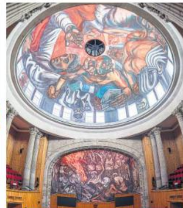
BELLEZA. Una parada obligada para los visitantes del recinto son los murales de José Clemente Orozco.