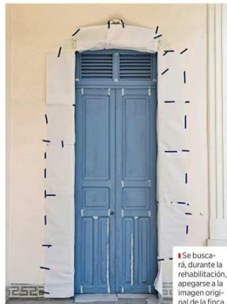
Se buscará, durante la rehabilitación, apearse a la imagen original de la finca.

En la parte posterior del terreno se habilitarán espacios destinados a experiencias culturales de escala más reducida. Entre ellos se contempla un bar para encuentros privados y una terraza que podrá utilizarse para talleres, degustaciones gastronómicas, catas o actividades sensoriales vinculadas con la producción artística, la idea es que la casa funcione con distribuciones dinámicas a lo largo del tiempo, que reúna distintas vocaciones dentro de una misma propiedad, detalla López Macías.