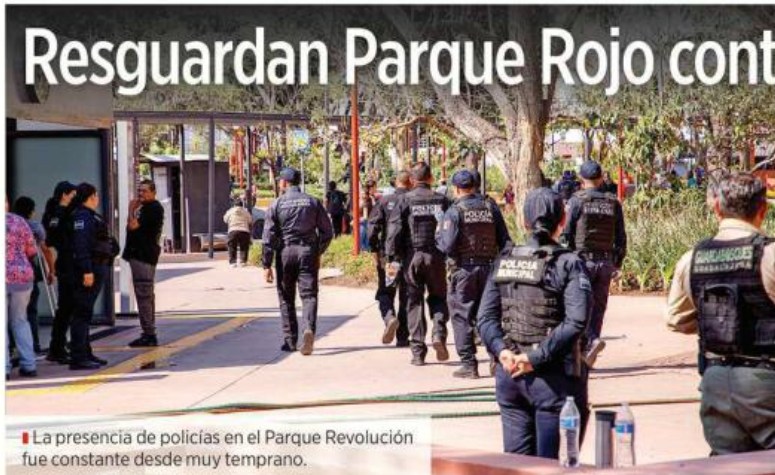
La presencia de policías en el Parque Revolución fue constante desde muy temprano.