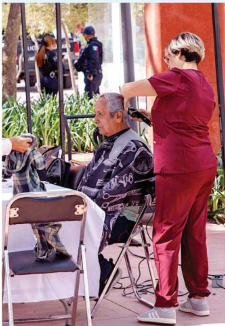
Entre las actividades que se desarrollaron hubo clases de pintura y hasta servicios de corte y belleza.