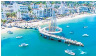
PAISAJE. La foto muestra el famoso Muelle de la Playa Los Muertos.

Al sur del centro histórico se encuentra la Zona Romántica, uno de los barrios más emblemáticos del puerto. Sus calles empedradas, llenas de galerías, restaurantes y pequeños hoteles, conservan un ambiente bohemio que ha atraído durante años a artistas, viajeros internacionales y residentes extranjeros. Este barrio también es conocido por su carácter incluyente.