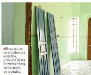
El espacio es de arquitectura ecléctica, y fue una de las primeras fincas en esa parte de la ciudad.