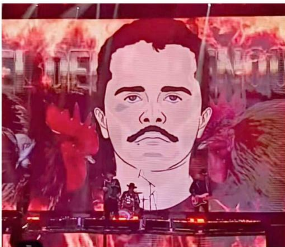
El grupo proyectó imágenes de Nemesio Oseguera Cervantes, abatido el pasado 22 de febrero.

Barranco minimizaron la polémica al principio, la avalancha de problemas apenas comenzaba.