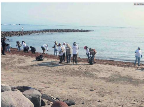
SANEAMIENTO. Autoridades reportan el control del derrame en el Golfo de México, mientras pescadores resienten el impacto económico.

El costo de estas medidas varía, pero existen opciones accesibles. Soluciones básicas de protección pueden oscilar entre los 900 y cinco mil pesos anuales para pequeñas organizaciones, mientras que las plataformas más avanzadas, con funciones como el respaldo en la nube o las redes privadas virtuales, implican inversiones mayores.