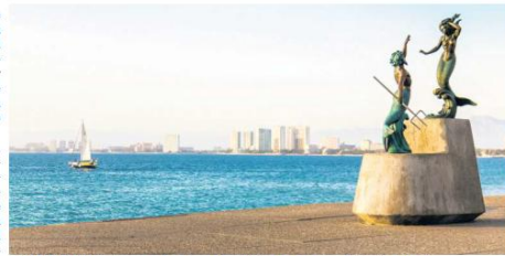
ARTE URBANO. Esta imagen captura la escultura 'Tritón y la Nereida' en el Malecón de Vallarta.

Con la mirada puesta en junio del 2026, Puerto Vallarta se prepara para recibir a visitantes que llegarán atraídos por el fútbol, pero que encontrarán mucho más que un destino de playa. Hallarán una urbe que durante décadas ha aprendido a recibir al mundo con hospitalidad. Cuando comience el Mundial, el eco de los partidos se escuchará desde Guadalajara hasta la costa del Pacífico.