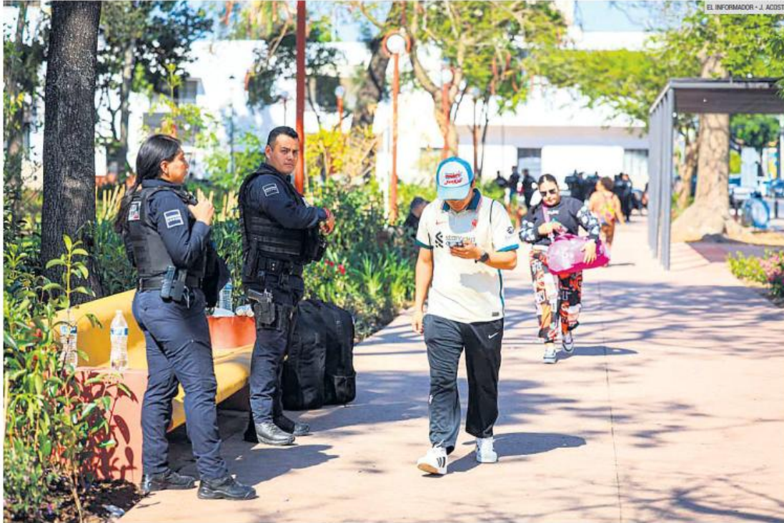
VIGILANCIA. Elementos de la Policía de Guadalajara resguardan el Parque de la Revolución para reforzar la seguridad y mantener el orden en la zona.

Más de 500 vendedores aceptan reubicación en distintos puntos de la ciudad tras acuerdos