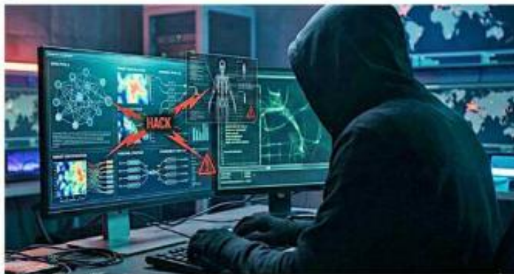
Los datos de usuarios pueden ser utilizados por hackers.

Explicó que el Big Data permite procesar millones de datos de manera automática, no solo sobre lo que una persona consume, sino sobre sus hábitos, ubicaciones, interacciones y patrones de comportamiento, información que puede ser aprove-