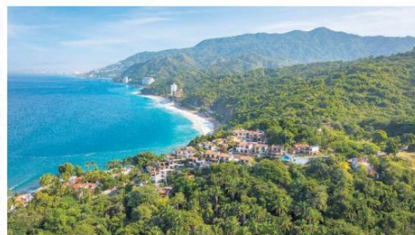
BELLEZA. Vista panorámica de la costa de Puerto Vallarta, la cual está rodeada de las montañas de la Sierra Madre Occidental.

Puerto Vallarta se encuentra en un punto donde la geografía mexicana muestra uno de sus contrastes más atractivos. Las montañas de la Sierra Madre Occidental descienden abruptamente hacia el mar, creando un paisaje donde la selva tropical se encuentra con la costa.