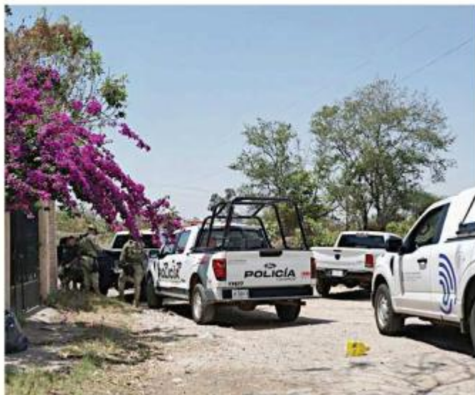
La víctima fue localizada en Hacienda de Vidrio.

El colono declaró haber salido de su casa cerca de las 10:00 horas, pero dijo que no vio a la víctima ni escuchó disparos. De manera preliminar, las autoridades estimaron que el afectado tenía unos 30 minutos de haber muerto, con relación al momento del hallazgo.