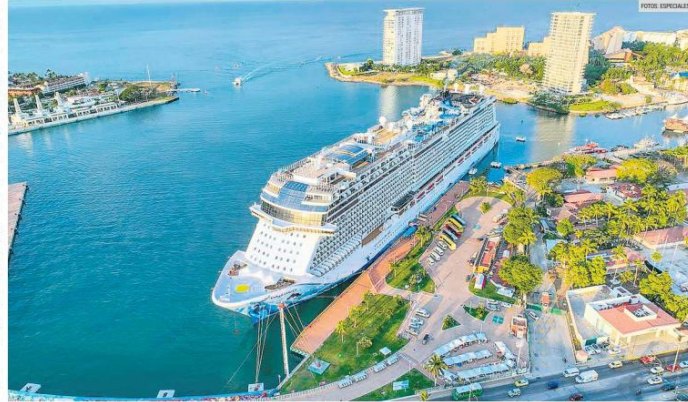
TURISMO. El momento capturado en esta foto es la llegada del crucero Norwegian Bliss al puerto de Puerto Vallarta, Jalisco.