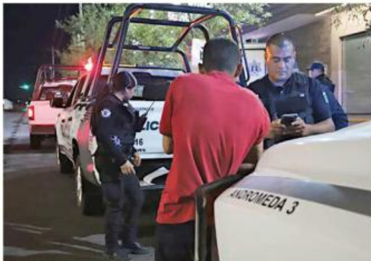
■ Policías municipales resguardaron a la persona.

Las autoridades de Tlaquepaque informaron que con este caso suman 79 personas resguardadas en situaciones relacionadas con ofertas laborales falsas, una práctica que puede esconder casos de reclutamiento forzado.