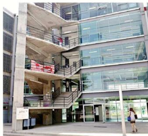
La agresión sexual ocurrió en un baño neutro del CUCSH de la UdeG.

“Es una violación a la seguridad de las personas, por lo que vamos a levantar los muros para que no haya posibilidad de pasar por debajo de las divisiones. No podemos permitir que se propicie este tipo de conductas”, señaló.