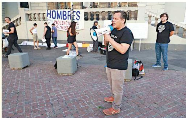
■ Miembros del colectivo explicaron los efectos negativos producidos por la "manósfera".

Durante la concentración explicaron que existe una ur-