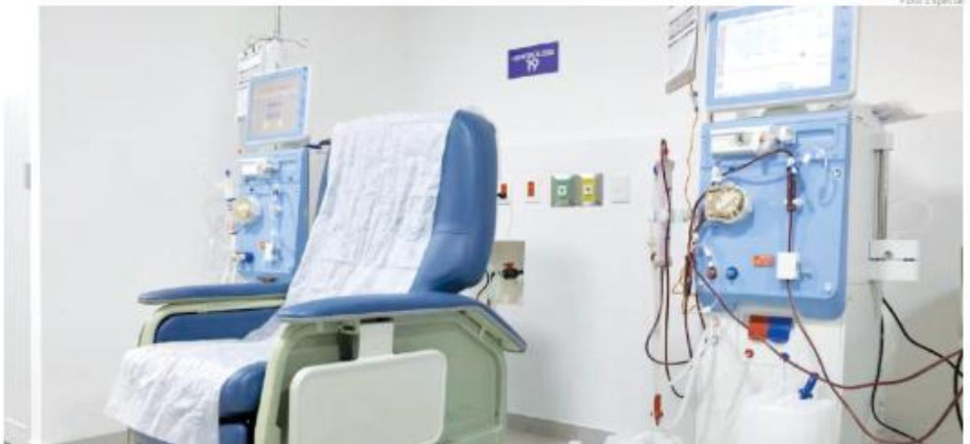
Hay nuevos equipos de hemodiálisis en la UNIMEF Fray Antonio Alcalde.

Aseguró que ambos espacios de atención cuentan con equipo de primer nivel en el área de sesiones y en los consultorios de nefrología, así como en to-