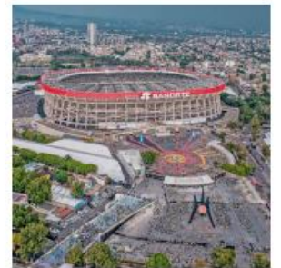
Estadio Ciudad de México