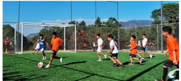
El nuevo espacio cuenta con una superficie recuperada de 2 mil 67 metros cuadrados.

En el marco de esta gira, se llevó a cabo la edición número 94 de las Brigadas Yo Jalisco, un programa que acerca servicios integrales a comunidades de difícil acceso. Durante la jornada, los habitantes pudieron acceder a trámites del Registro Civil, servicios de salud, asesorías jurídicas, renovación de licencias de conducir y una feria del empleo. El gobernador reiteró su compromiso