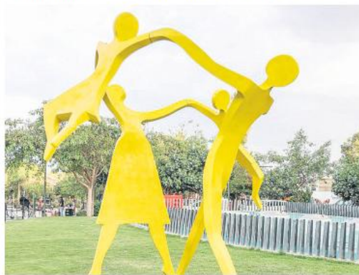
"FAMILIA". Una pieza de Victor Javier Andrade.