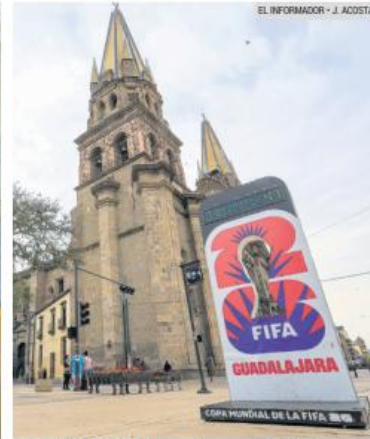
PATRIMONIO. Turistas y locales disfrutarán de la identidad y el espíritu que ofrece el anfitrión.