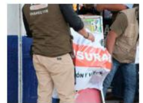
Quitarán máquinas.

El ayuntamiento tapatío aprobó la firma del convenio con el Gobierno de Jalisco para reforzar la inspección y vigilancia en negocios y retirar las máquinas tragamonedas en el municipio. PÁG. 3