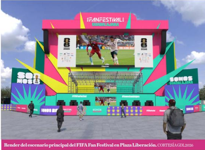
Render del escenario principal del FIFA Fan Festival en Plaza Liberación.