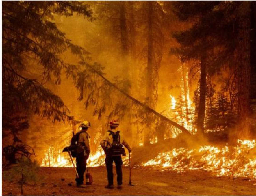
Los incidentes han afectado más de 27 mil hectáreas de superficie este año.

ferente al Bosque de la Primavera se reportaron 29 incendios con una afectación de 482 hectáreas, lo que representó un 75 por ciento menos a comparación con 2025.