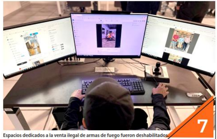
Espacios dedicados a la venta ilegal de armas de fuego fueron deshabilitados.

“Está conformada por 20 uniformados, los cuales tienen perfil de ser egresados en áreas como ciberseguridad, cómputo forense, programadores, ingenieros en informática. De igual manera, nos hemos dado cuenta y entendemos los retos que nos marca la seguridad. Los delincuentes han estado migrando porque es más seguro para ellos estar realizando algunas actividades como suplantación de identidad”.