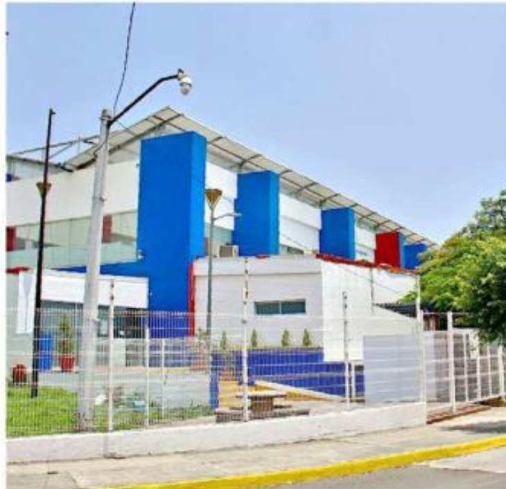
El IJCF nunca tuvo un cuerpo completo, sino fragmentos óseos, indicó su titular.

Explicó que el 1 de julio de 2016, las autoridades atendieron un reporte sobre nueve tambos de 50 litros de capacidad con un olor peculiar. Al analizar el contenido se dieron cuenta de que