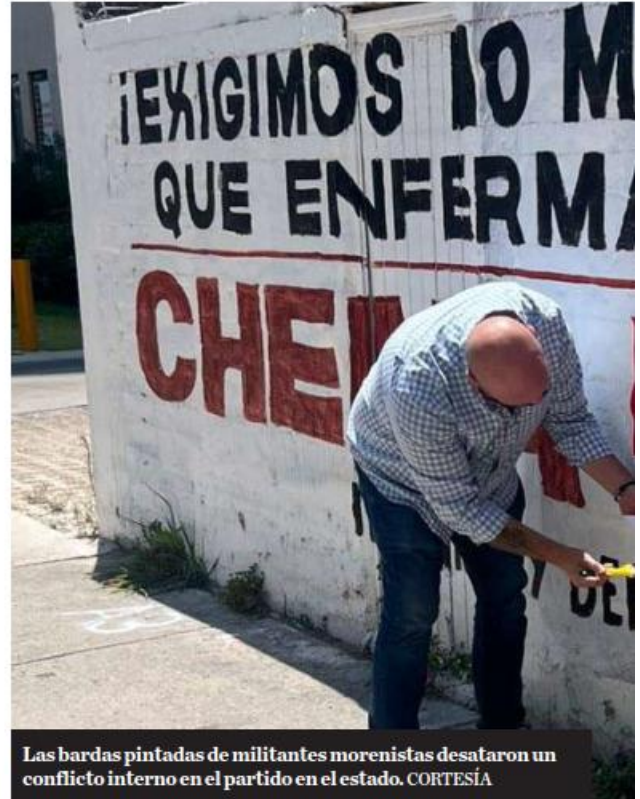
Las bardas pintadas de militantes morenistas desataron un conflicto interno en el partido en el estado.