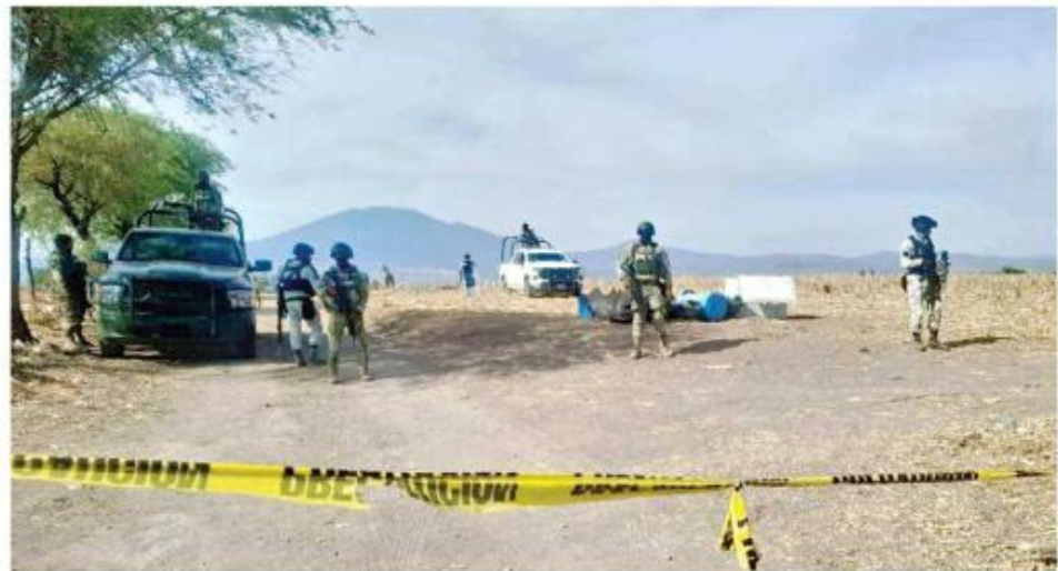
En el Rancho La Vega encontraron a jóvenes que habían sido reclutados por el narco.

"La aprehensión de Fernando 'N' representa un avance relevante en las investigaciones que desarrolla la FGR para esclarecer hechos