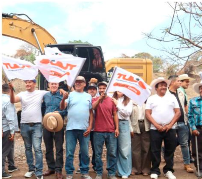
Las labores se concentran en la zona de Cerro Viejo.

Queremos actividades culturales, venta y promoción de artesanías y gastronomía sabrosa. Buscamos que en este lugar se sigan promoviendo las técnicas tradicionales para que los