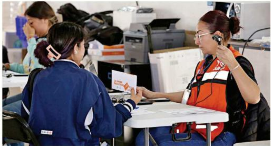
El programa del Gobierno de Jalisco beneficia a niñas y niños de entre 5 y 12 años de edad. Deben tramitar Tarjeta La Única.

“Está abierta la plataforma para pre registros hasta el 15 de junio para que las personas que dejan hasta el final su pre registro —lo sabemos que eso nos gusta hacerlo a algunas personas— pues que tengan todavía chance estos últimos 15 días para ir a recoger la