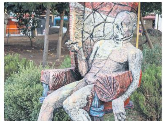
"SILLA DEL PODER". Obra urbana de Niko Garavi.