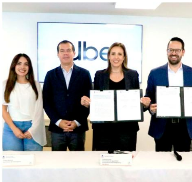
LA SISEMH firmó un convenio con la empresa Uber.

La estrategia se integrará a los programas Pulso de Vida y Nos Movemos Seguras, enfocados en la protección de víctimas