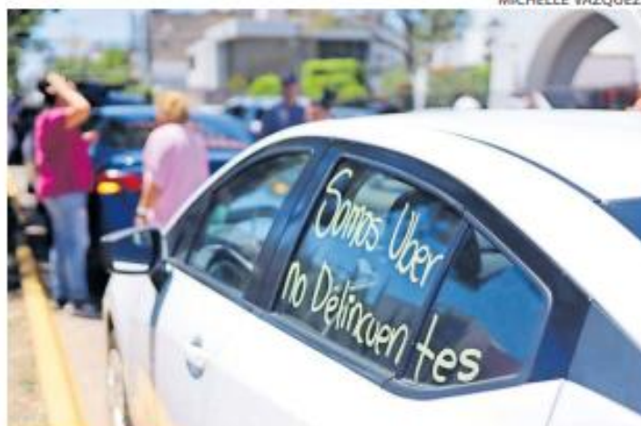
NORMALMENTE. Los operadores de empresas de redes de transporte exigen que se les deje operar en los aeropuertos sin sanciones.

A la par dijo que ha mantenido reuniones con legisladores federales con la finalidad de que se modifiquen las