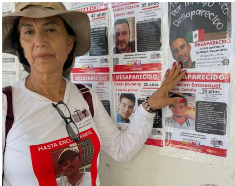
Durante diez años estuvo pegando fichas de búsqueda.

La búsqueda también cobró factura en su salud. Durante una jornada en Puerto Vallarta contra un hongo que afectó sus pulmones. Después desarrolló cáncer de colon. Aun así, con el dolor físico y emocional a cuestas, siguió bus-