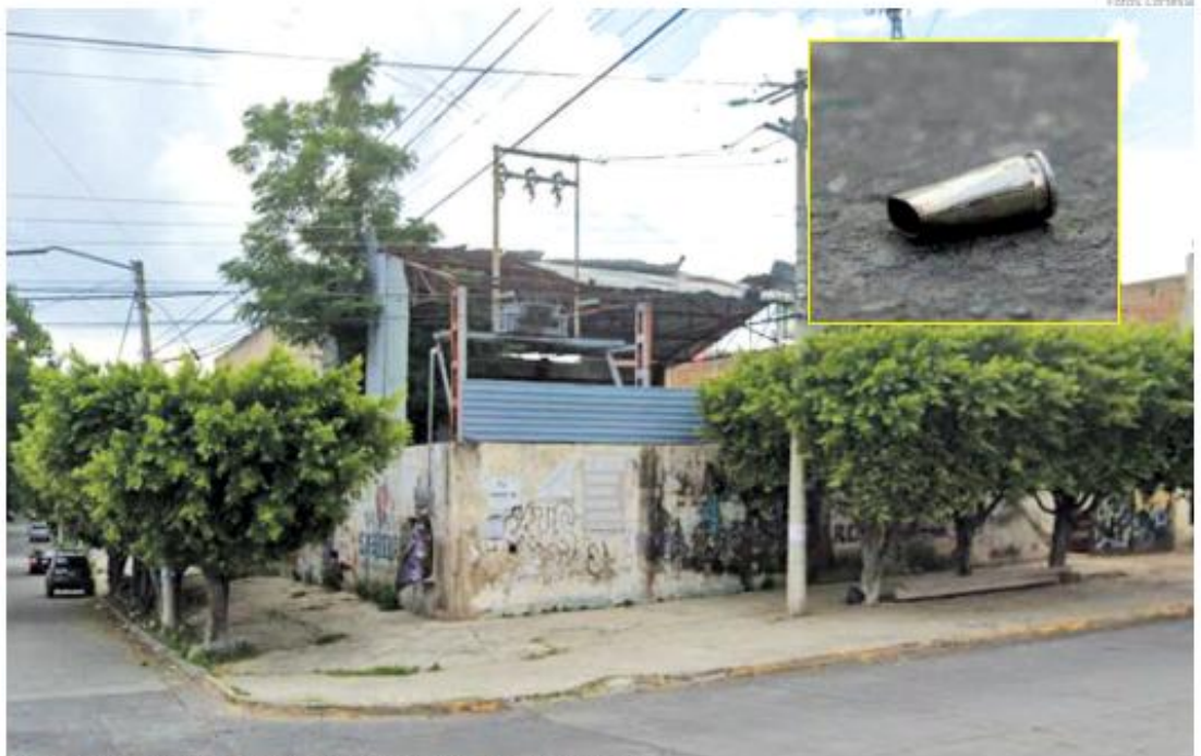
El joven repartidor murió cerca del cruce de Roberto Weeks y Fabián Carrillo.

LO ASESINAN TRAS PERSEGUIR A LADRONES Individuos que habían cometido un