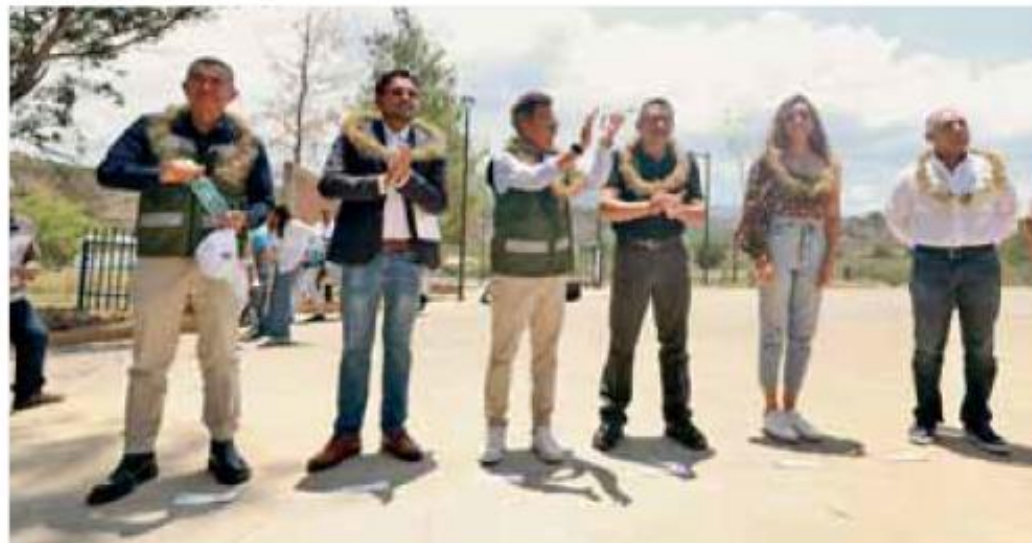
Gira de trabajo. El gobernador entregó obras y anunció más inversión en municipios de Jalisco.