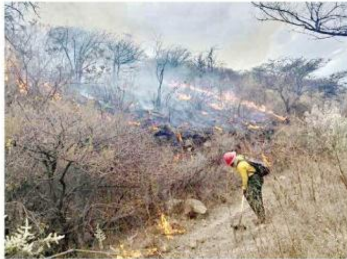
■ Hasta el 13 de mayo, en Jalisco ocurrieron 515 incendios forestales; 29 de ellos fueron en el Bosque La Primavera.

“El índice promedio de incendios forestales, esto quiere decir si promediamos la cantidad de incendios por superficie de cada año, el promedio anual hasta el año pasado era de 105 hectáreas, en este momento es de 54. O sea, estamos con una reducción también muy importante en la superficie por