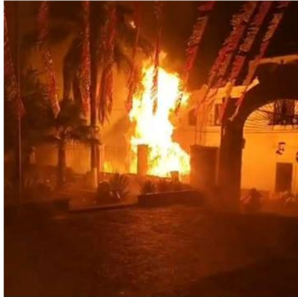
El incidente ocurrió durante las fiestas patronales.

De acuerdo con la Unidad de Protección Civil y Bomberos de Jalisco, las chispas provenientes