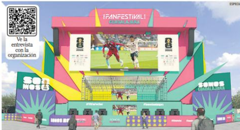
CENTRO TAPATIO. La Plaza de la Liberación será sede principal del FIFA Fan Festival, con transmisiones gratuitas de partidos, actividades culturales, gastronomía y espectáculos durante el Mundial 2026.

Uno de los anuncios más relevantes fue que el acceso será gratuito y sin registro previo. El ingreso dependerá del aforo, bajo el es-