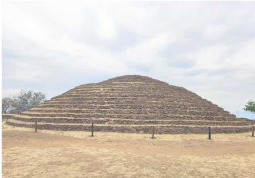
HISTORIA. Pirámide de la Iguana tras su intervención, en la Zona Arqueológica de Guachimontones