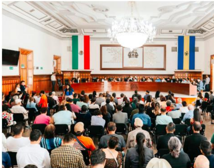
Sin apoyo federal, se redujo la capacidad para financiar proyectos estratégicos.

El Cabildo solicitará a la Cámara de Diputados que se restablezca el desaparecido Fondo Metropolitano