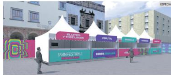
EXPERIENCIA. Música, fútbol, comida típica y actividades culturales harán del corazón de Guadalajara un punto de encuentro internacional

El corazón tapatío ofrecerá una experiencia mundialista en plazas, museos y algunos restaurantes