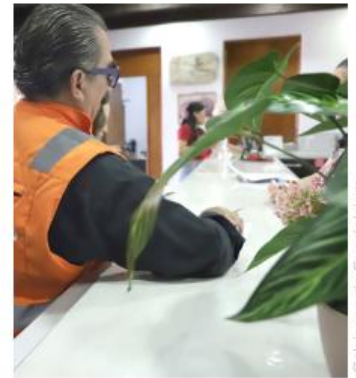
La mayoría no contaba con contrato de recolección de residuos.

El operativo continuará en otros tramos del Corredor Vallarta hasta revisar todos los establecimientos de la vialidad. Alerta Limpia Comercial ya se ha aplicado en los corredores López Cotilla, Pedro Moreno e Hidalgo, como parte de la estrategia municipal para mantener una Guadalajara limpia y ordenada.