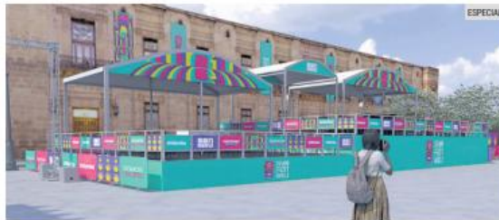
AMBIENTE. El Centro de Guadalajara será un espacio de convivencia diaria donde aficionados de todo el mundo podrán acudir incluso cuando no haya partidos.