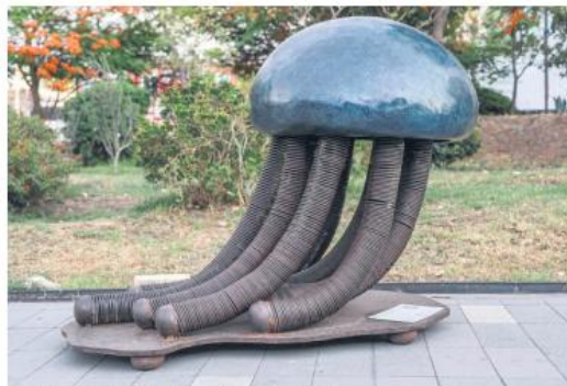
"CARICIAS QUE QUEMAN". Obra de Maritza Vázquez.