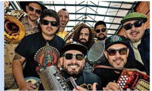
■ Kumbia Boruka será una de las bandas invitadas para la Fiesta de la Música de este sábado.

Algo distintivo en esta nueva faceta de La Fiesta de la Música es que habrá una segunda parte para el mes de octubre en el barrio de San Andrés, cuya fecha exacta y programación se darán a conocer más adelante.