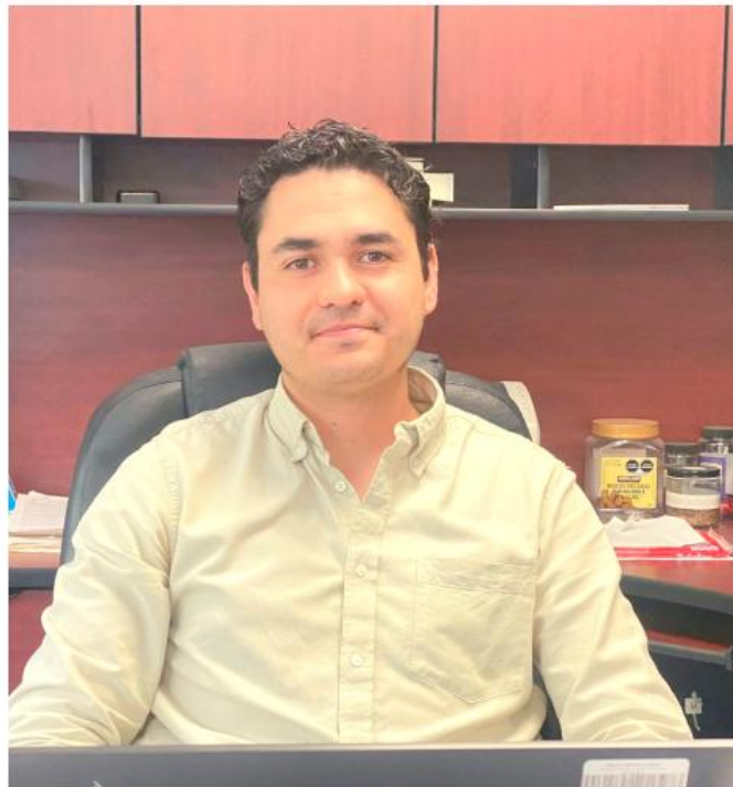
La región costa presenta cambios en el comportamiento del fuego.

Graf Pérez señaló que las lluvias atípicas registradas durante marzo y abril contribuyeron a reducir la propagación del fuego y evitar escenarios más críticos. Sin embargo, advirtió que los incendios continúan generando impactos en la calidad del aire, en el entorno ambiental y en zonas cercanas a áreas forestales.