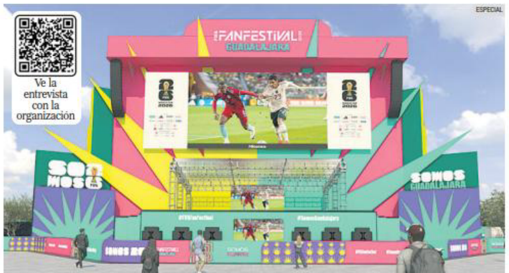
CENTRO TAPATÍO. La Plaza de la Liberación será sede principal del FIFA Fan Festival, con transmisiones gratuitas de partidos, actividades culturales, gastronomía y espectáculos durante el Mundial 2026.

Uno de los anuncios más relevantes fue que el acceso será gratuito y sin registro previo. El ingreso dependerá del aforo, bajo el es-