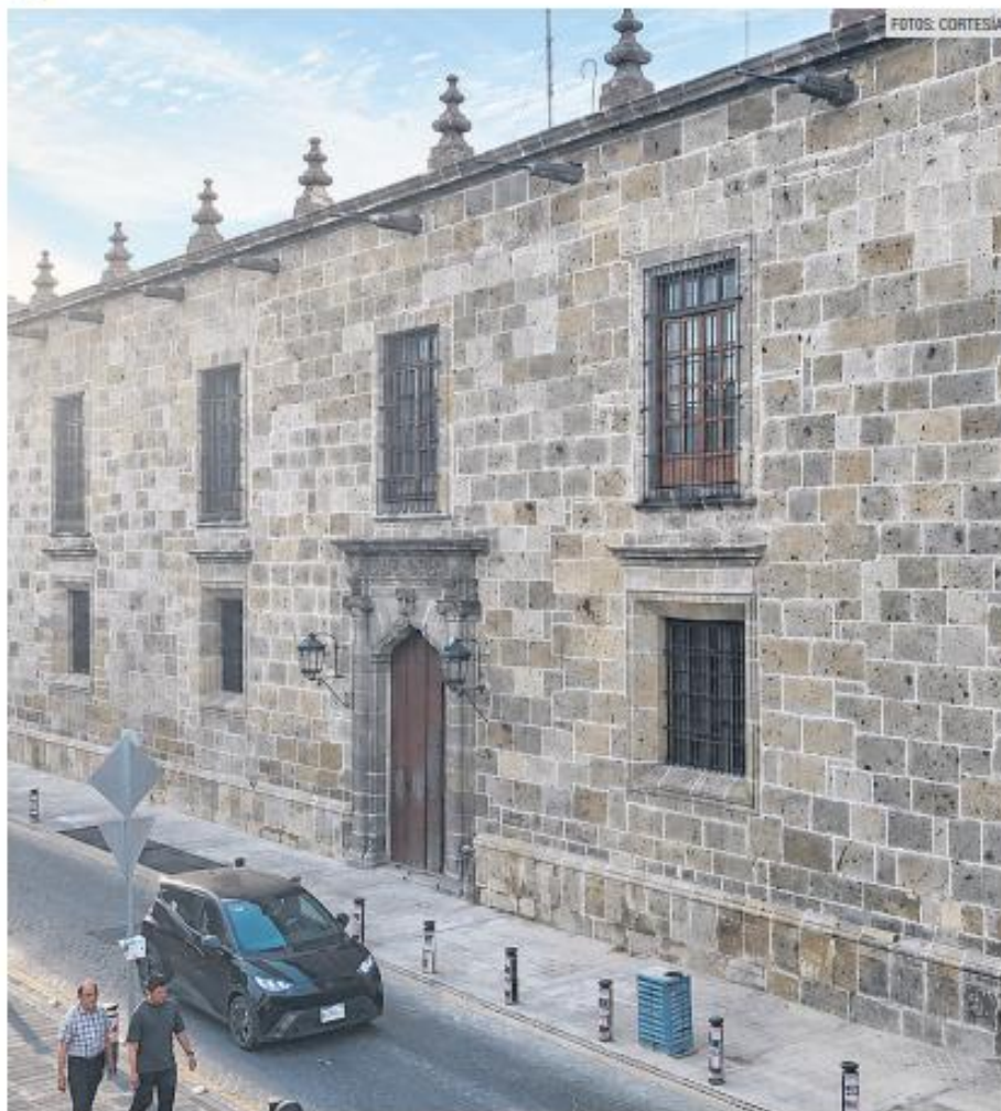
ARQUITECTURA. Fachada del Museo Regional de Guadalajara.

Con una inversión de 11 millones de pesos, buscan fortalecer dos espacios fundamentales para la memoria cultural de Jalisco