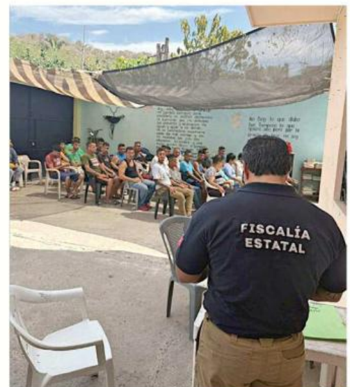
Propone diputado que la Fiscalía del Estado inspeccione los centros de rehabilitación, para verificar que las personas están internadas de manera legal.

“Porque a final de cuentas, el uso, abuso de sustancias tiene que ver con un problema de salud pública que estamos viviendo no sólo en la Zona Metropolitana (de Guadalajara), sino en el Estado; y nosotros creemos que, a partir de esto, podríamos saber también un censo de cuántos, mujeres y hombres, están en esta condición y qué acciones tenemos que tomar”, acotó.