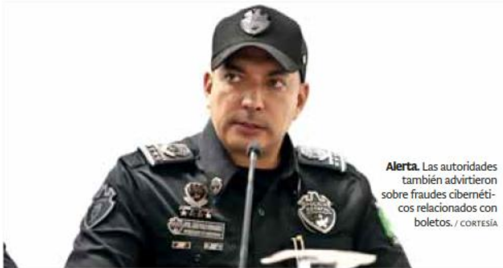
Alerta. Las autoridades también advirtieron sobre fraudes cibernéticos relacionados con boletos.

Vigilancia. El operativo contempla vigilancia en zonas turísticas, corredores gastronómicos y espacios como el Centro Histórico