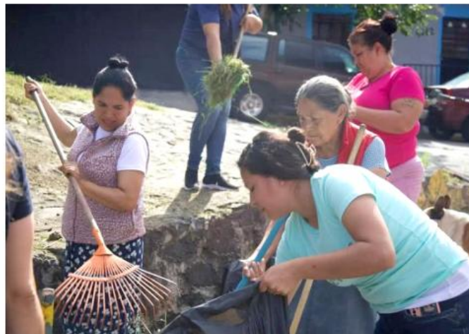
El programa busca fortalecer el tejido social mediante iniciativas.

Fue lanzada la convocatoria para la segunda edición del programa en busca de resolver problemáticas en las colonias