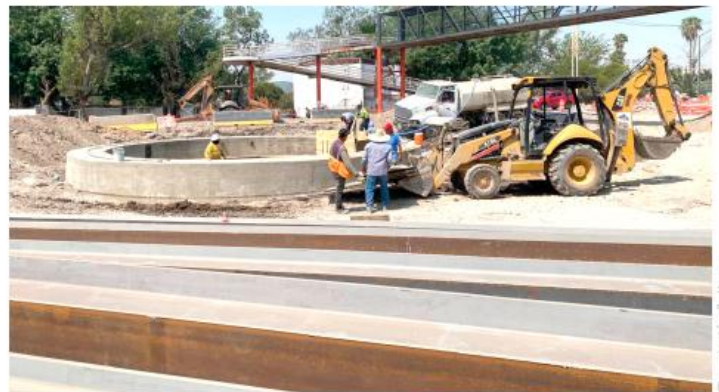
La obra no estará lista para el Mundial.