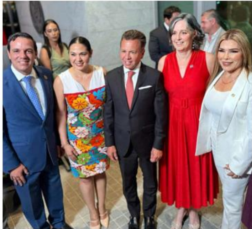
Autoridades estatales acompañaron a la cónsul.