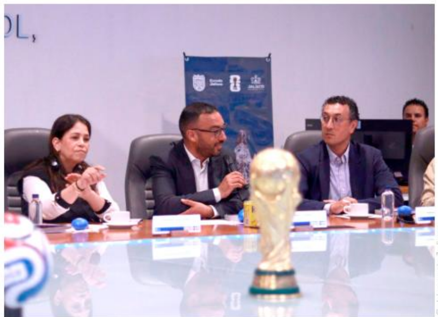
Personal de la SISEMH expuso la política pública Pulso de Vida.