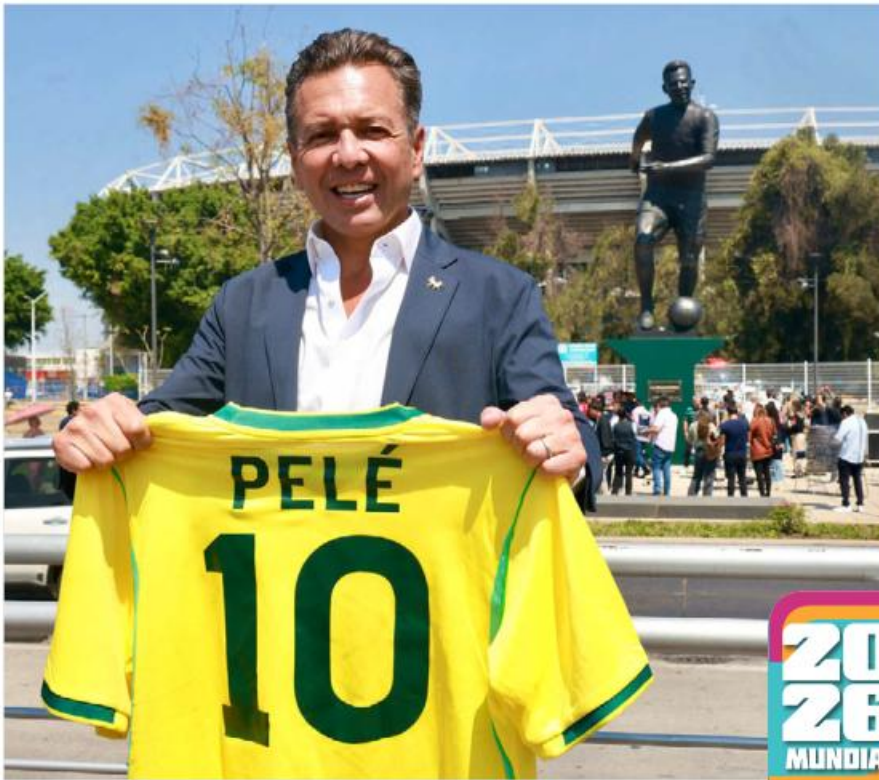
Lemus, emocionado por la estatua de Pelé.