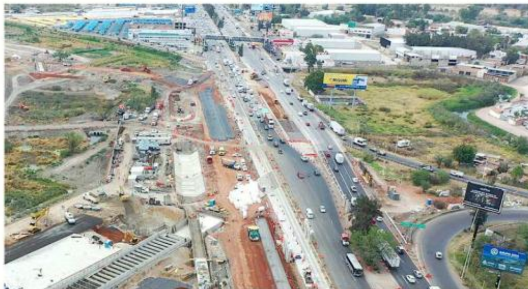
Las obras sobre Carretera a Chapala, a la altura del aeropuerto, continúan.

la Línea 5 del Tren Ligero, el titular de la SIOP insistió en que la fecha de terminación del proyecto es el 4 de junio, por lo que actualmente trabajan en los últimos detalles.