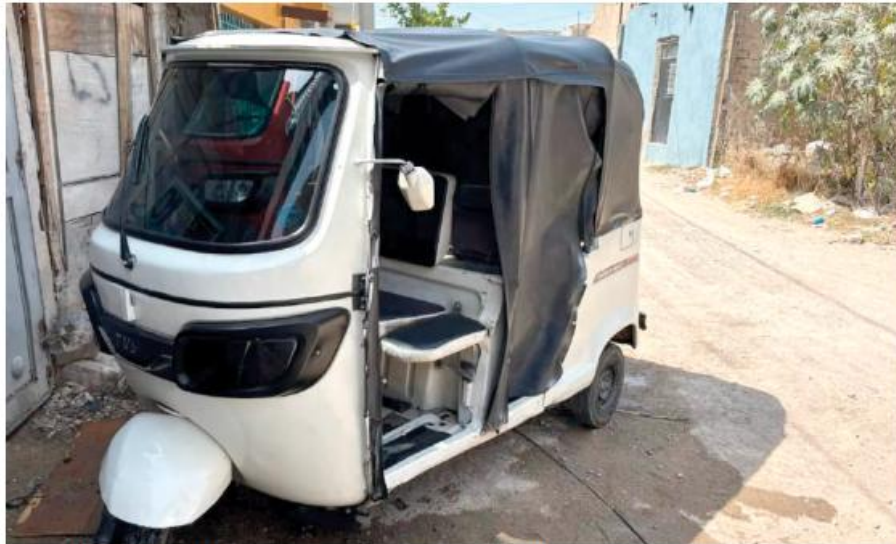
Los mototaxis son un vehículo inseguro que genera siniestros viales.

Añadió que el vehículo de mototaxi no puede reconocerse como una unidad que realiza traslados, debido a que se trata de un vehículo inseguro. Hacer