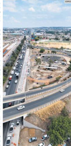
ALERTA. En el cruce de la Carretera a Chapala y el ingreso al Aeropuerto Internacional de Guadalajara, será instalada la estructura del nuevo puente que forma parte del proyecto de modernización y ampliación rumbo al Mundial de fútbol.

El Gobierno de Jalisco también confirmó que el próximo 4 de junio entrará en operación la Línea 5 de transporte público sobre Carretera a Chapala, sistema de electromovilidad que conectará el aeropuerto con distintos puntos de Guadalajara mediante autobuses eléctricos equipados con aire acondicionado, Wifi y accesibilidad universal.