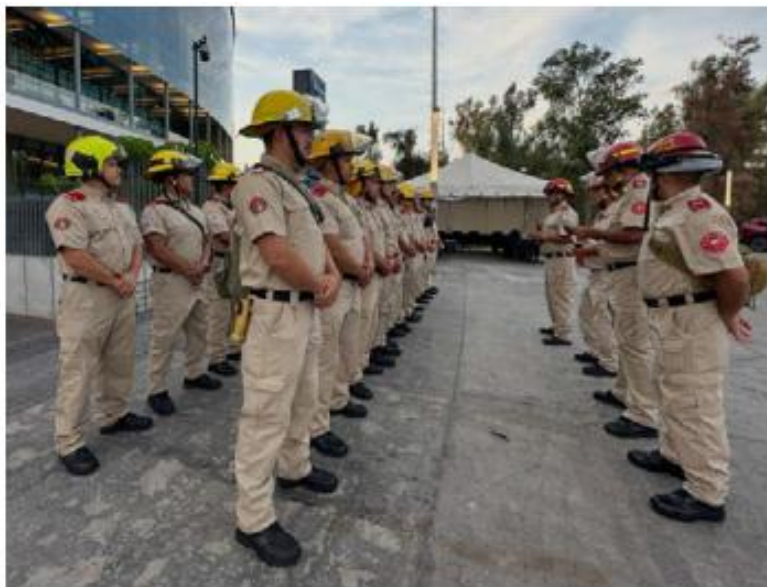
PREVENCIÓN. Bomberos de Guadalajara participaron en un operativo preventivo para salvaguardar a los asistentes al concierto de Grupo Frontera en la Arena Guadalajara este jueves.