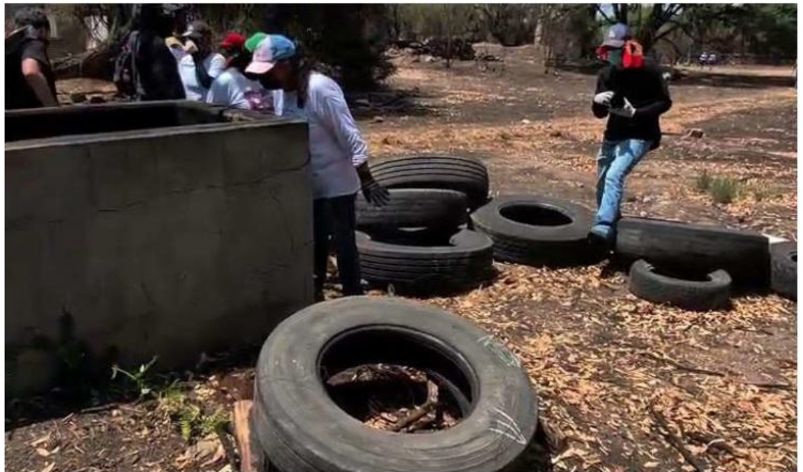
El predio se encuentra en la comunidad de Plan de los Rodríguez. DANY BÉJAR