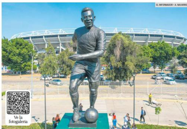
ESCALA MONUMENTAL. "La Canarinha", dedicada a Pelé, fue instalada frente al Estadio Jalisco y a un costado de la Plaza Brasil, sobre la Calzada Independencia. La obra, creada por el escultor mexicano Alejandro Velasco, mide 9.5 metros de altura.