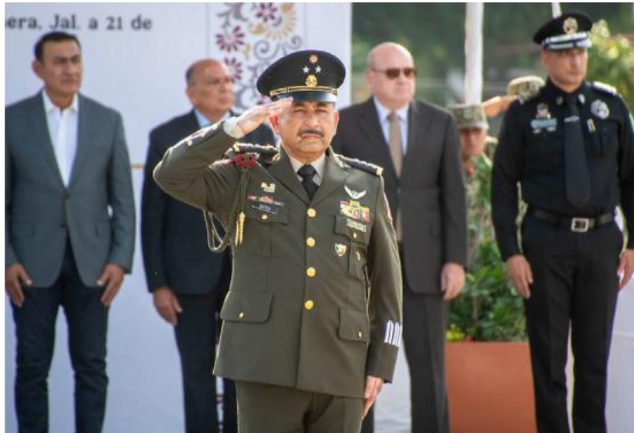
Este jueves se llevó a cabo la ceremonia en La Mojonera, en Zapopan.