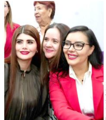
El proceso legislativo sumó el respaldo de todos los grupos parlamentarios.

Con este avance, el Poder Legislativo busca consolidar un marco jurídico sólido que proteja activamente los derechos humanos de las mujeres.