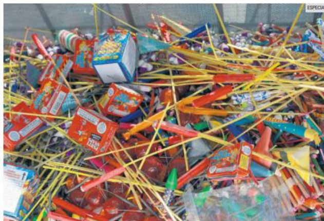
SEGURIDAD. Los trabajadores de la industria de la pirotecnia en el Estado han solicitado reglas claras para la operación y distribución segura de sus productos.

Zamora Nuño señaló que gran parte de la venta irregular ocurre en tianguis, fiestas patronales, ferias y comercios no autorizados, donde se comercializan productos sin supervisión ni controles mínimos de seguridad.