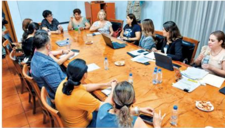
La mesa de diálogo se realizó en el Congreso del Estado.

Ambas diputadas, promotoras de la iniciativa para crear la Ley de Autismo en Jalisco, realizaron una mesa de trabajo con diversos colectivos que apoyan la propuesta. Otras asociaciones que difieren