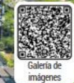
Galería de imágenes

Asimismo, las autoridades confirmaron que durante los días de partido del Mundial se restringirá la circulación de transporte de carga pesada sobre Periférico después de las 3:00 de la tarde, con el objetivo de agilizar la movilidad y reforzar la seguridad vial en la ciudad.