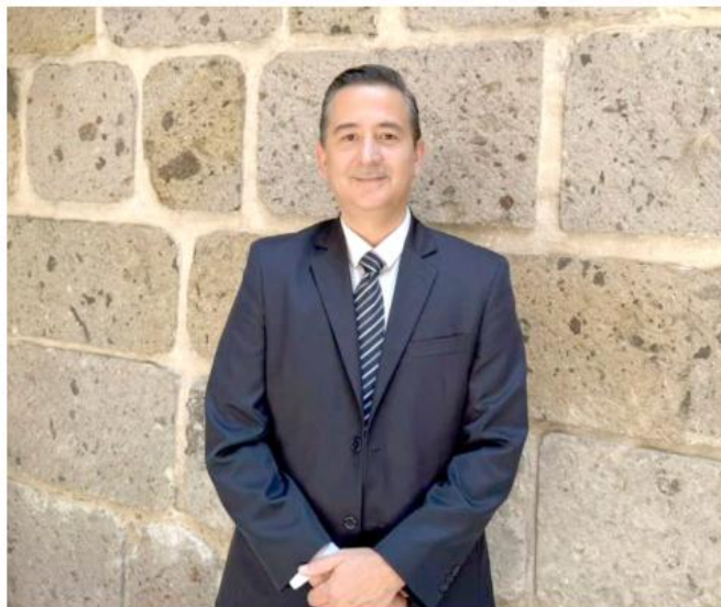
Se evaluó la transparencia, disciplina financiera y contabilidad gubernamental.

El funcionario estatal calificó este logro como una "radiografía de la operatividad de las dependencias y entidades en el