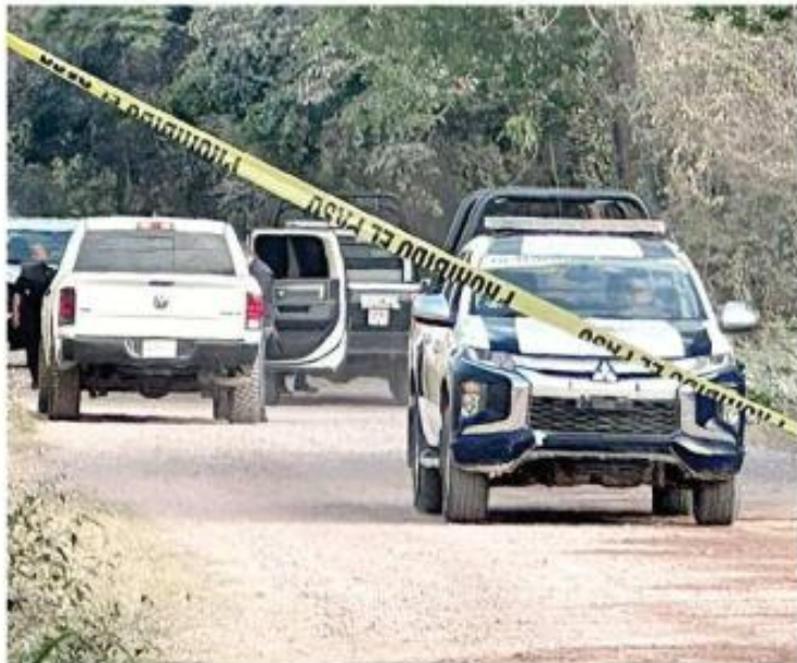
■ El caso se investiga como un feminicidio.