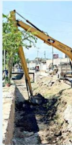
El Canal Tizapán, en la Colonia Guayabitos, es intervenido por el Gobierno de Tlaquepaque.

“Esto debe ser un canal de agua pluvial y no un tiradero”, expresó la Presidenta Municipal.