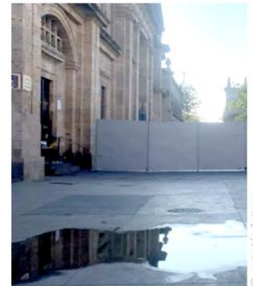
Quadratín Jalisco Quedó cerrado el ingreso a la estación Centro de la Línea 3 del Tren Ligero.

El funcionario estatal detalló que, aunque los accesos a Plaza de Armas y Plaza Liberación estarán restringidos, las oficinas públicas ubicadas en la zona, como el Congreso del Estado, el Poder Judicial y dependencias del Gobierno estatal, continuarán operando de manera habitual.