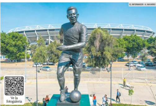
ESCALA MONUMENTAL. "La Canarinha", dedicada a Pelé, fue instalada frente al Estadio Jalisco y a un costado de la Plaza Brasil, sobre la Calzada Independencia. La obra, creada por el escultor mexicano Alejandro Velasco, mide 9.5 metros de altura.