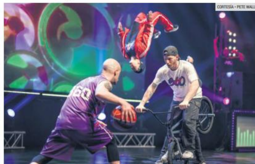
GIRA. El grupo actualmente se presenta en el Laboratorio de Arte Variedades, en Guadalajara.