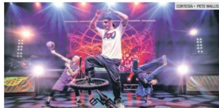
DIVERSION. Las actuaciones están acompañadas por música en directo que incluye beatboxing y loops para crear una atmósfera energética.

Las funciones serán hoy, viernes 22, a las 20:30 horas; y mañana sábado 23, a las 17:00 y 21:00 horas. La entrada será libre hasta agotar localidades.