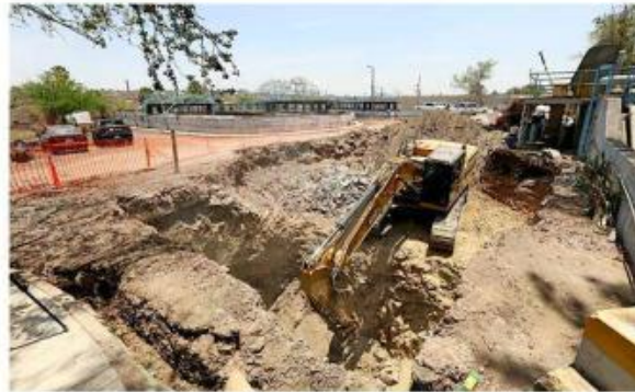
Una vez concluidas, las plantas de tratamiento serán operadas por la CEA.

vas precisó que los trabajos comenzaron desde noviembre del año pasado.