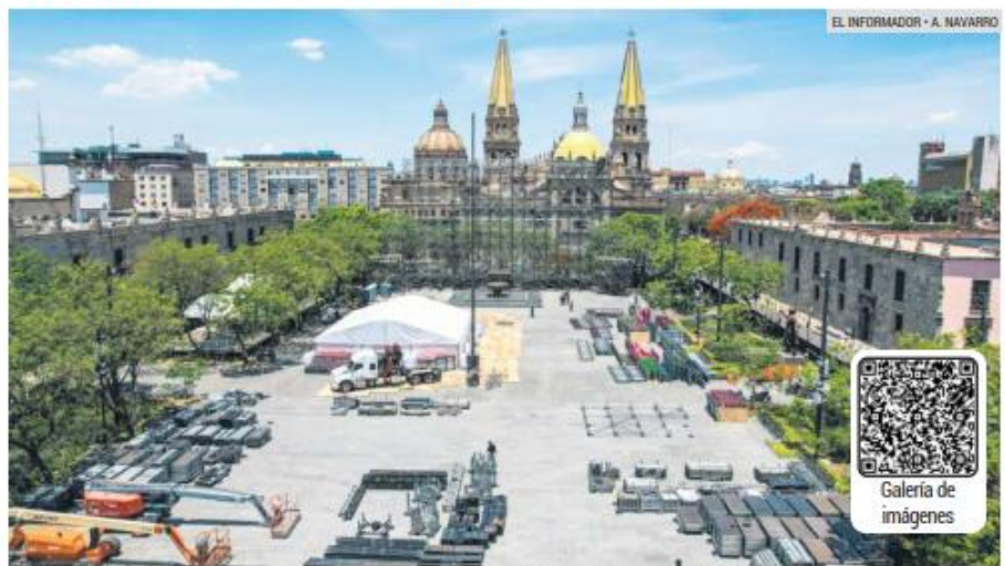
ARMADO. Instalan vallas, escenario y pantalla gigante en Plaza de Armas y Plaza Liberación.