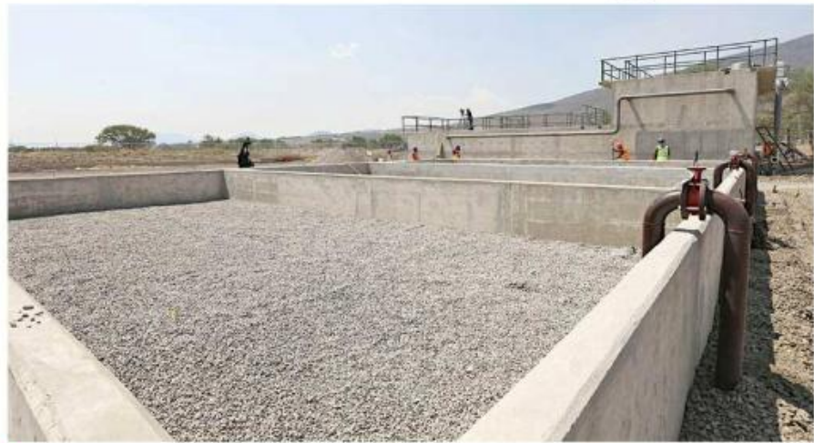
Las obras de infraestructura hidráulica anunciadas por la Conagua están enfocadas en el saneamiento del Río Santiago.