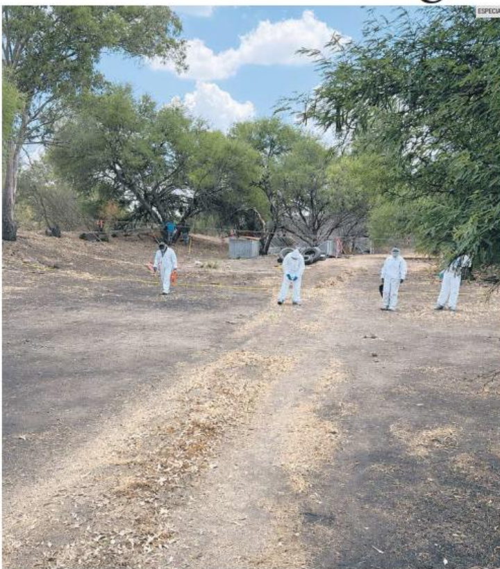
BÚSQUEDA. Personal de la Fiscalía del Estado ya trabaja en zonas aledañas al terreno localizado por colectivos el pasado fin de semana.

“Para considerarse horno o crematorio se requiere una estructura construida expresamente para esos efectos, con materiales capaces de concentrar altas temperaturas”, explicó.