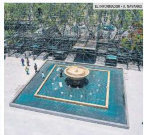
PREPARACIONES. Crecen adecuaciones en el Centro Histórico para recibir a los aficionados del Mundial.

cada frente a Palacio de Gobierno, fue cerrada temporalmente debido a los trabajos que se realizan en la zona.