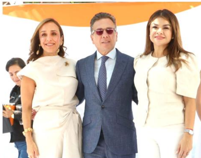
La consolidación de este centro es el resultado directo de una agenda legislativa.