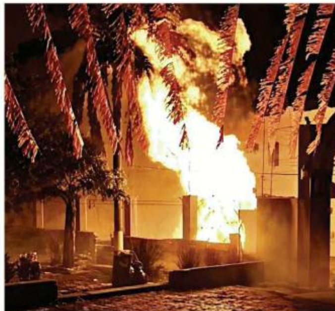
■ Una explosión con juegos pirotécnicos en Amatitán, ocurrida el 14 de mayo, dejó a tres personas fallecidas.