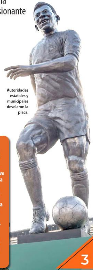
Autoridades estatales y municipales develaron la placa.