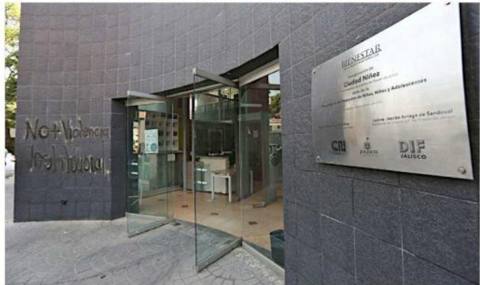
■ Ciudad Niñez enfrenta problemas de movilidad e infraestructura.

“¿Por qué lo mandan a Ciudad Niñez? El Poder Judicial debería tener otros recursos para atender este tema”, señaló.