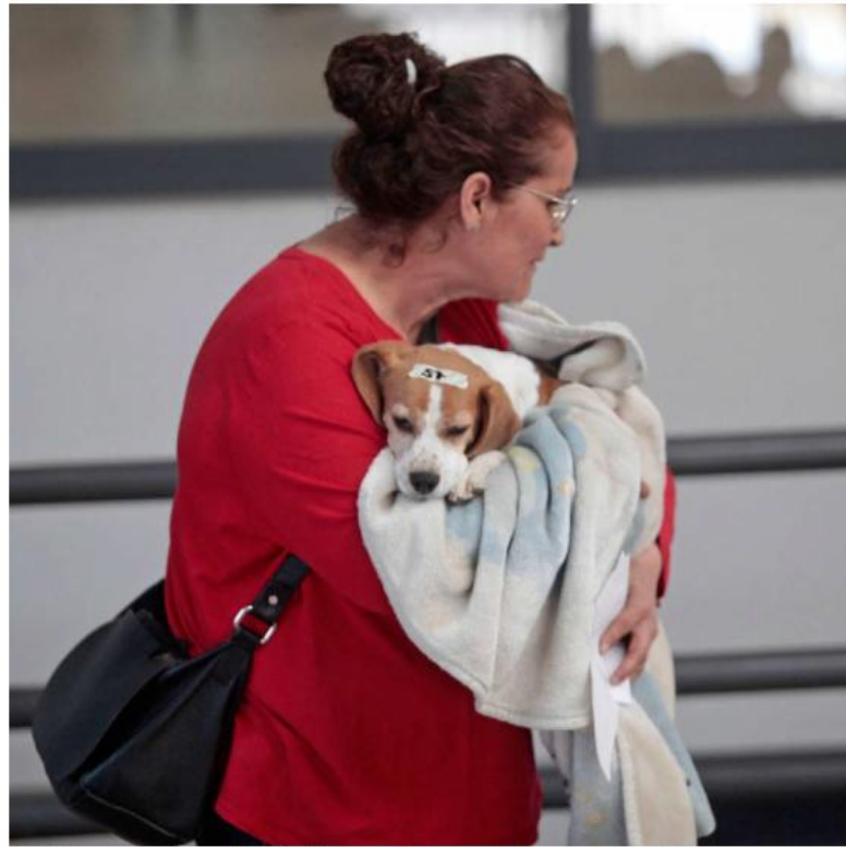
En México se abandonan 500 mil animales al año y ocupa el tercer lugar en maltrato. MILENIO

Zapopan tiene el Centro Integral de Salud Animal Zapopan (CISAZ), con clínica veterinaria, área de adopciones y registro mediante microchip. De cada cien perros que ingresan, cinco son reclamados por sus dueños. Los noventa y cinco restantes no se perdieron, sus familias los dejaron ahí y no regresaron. Tlajomulco, con más de 700 mil habitantes, tiene una Unidad de Acopio y Salud Animal que en su propia página web advierte que no es una perrera ni un albergue. No reciben animales abandonados por sus dueños ni realizan recolección permanente de animales callejeros, de acuerdo con su propio sitio oficial.