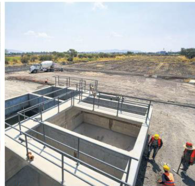
AVANCES. Se trabaja en una planta tratadora en Poncitlán.