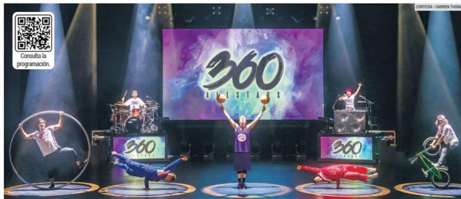
TALENTO INTERNACIONAL. El espectáculo reúne a campeones mundiales destacados en BMX breakdancing, baloncesto freestyle y acrobacias de circo contemporáneo.

"Tenemos campeones mundiales, personas con récords mundiales y músicos premiados. Todos fueron elegidos de muchos países diferentes para formar este equipo de estrellas", señaló Peterson.