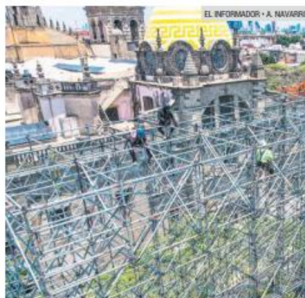
EVENTO. Comenzó el montaje donde los espectadores podrán ver los encuentros.