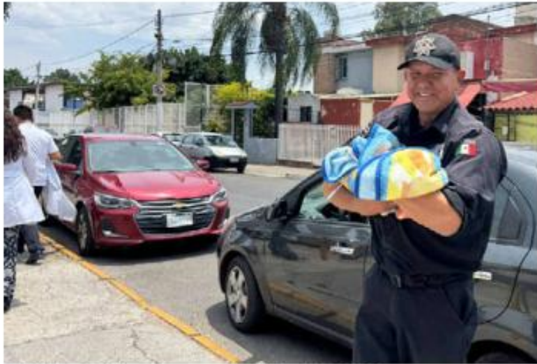
PARTO. Policías y personal médico del DIF Zapopan apoyaron en un parto dentro de un taxi que se dirigía al Hospital General de Occidente. Ambos se reportan en buen estado de salud.