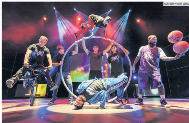
ESPECTACULAR. Artistas que forman parte del show australiano que combina diversas disciplinas urbanas.

"Nos queremos mucho y la pasamos increíble juntos en escena. El público puede sentir esa energía y se divierte con nosotros. Por eso la gente sale tan feliz del espectáculo, porque es auténtico y genuino".