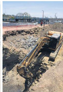
INSUFICIENTE. La planta de tratamiento de aguas residuales en Juanaacatlán trabaja con descargas altamente contaminadas, por lo que se invertirá en ella para ampliar sus capacidades.