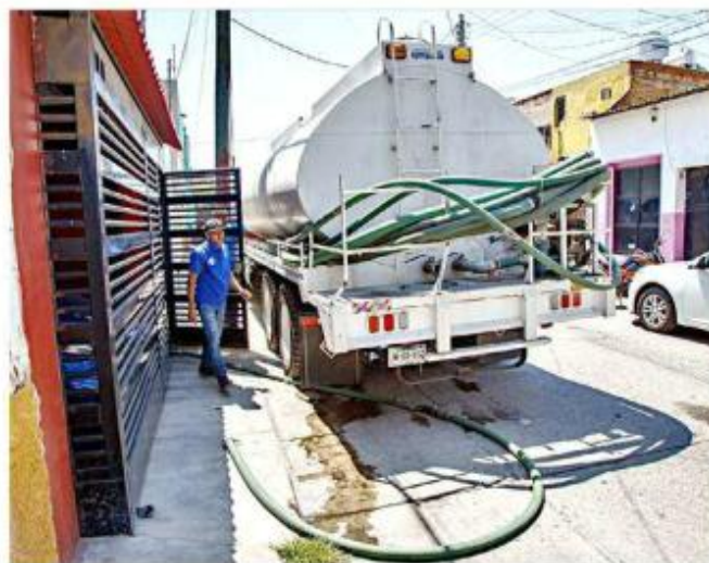
■ El SIAPA ofrecerá servicio de pipas gratuitas para los afectados.

Inicialmente, la suspensión estaba programada para ayer, sin embargo, la CFE reprogramó sus maniobras, lo que obligó al SIAPA a recorrer un día la interrupción