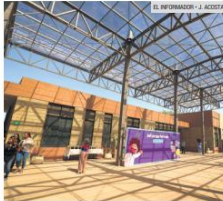
INSTALACIONES. El complejo en Tepetitlán tuvo una inversión de 160 millones de pesos. Su capacidad es para atender a 440 personas de la región Altos Sur.