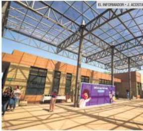
INSTALACIONES. El complejo en Tepatlán tuvo una inversión de 160 millones de pesos. Su capacidad es para atender a 440 personas de la región Altos Sur.