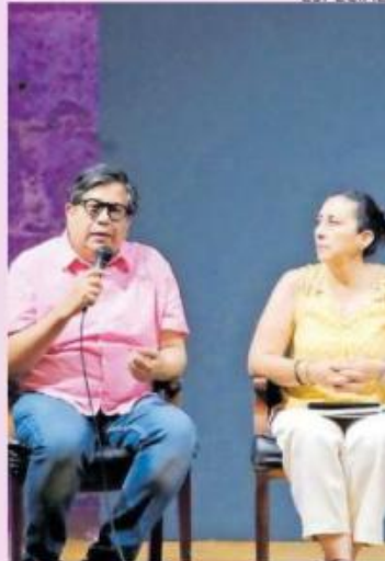
APOYOS. Artistas plantearon sus dudas sobre Proyecto Producción.

al monto máximo y varias se ubicaban alrededor de ese promedio.