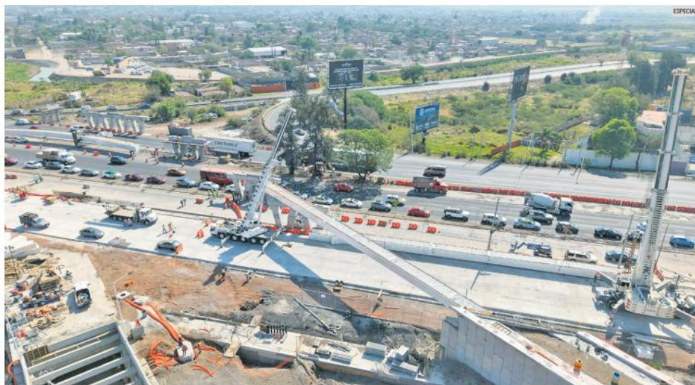
A TODA PRISA. Trabajadores realizaron maniobras de instalación de estructuras metálicas sobre Carretera a Chapala, como parte de las obras de conectividad vial rumbo al Mundial de 2026.

La remodelación vial busca agilizar movilidad rumbo a la justa internacional de futbol