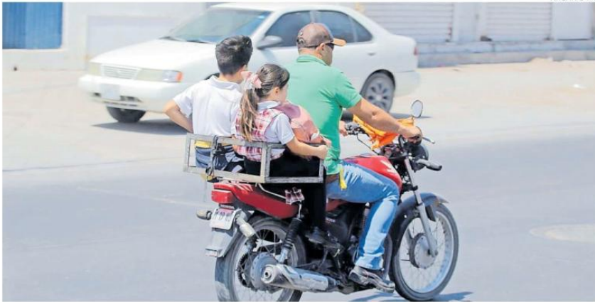
AL ALZA. Desde el IMSS también se advierte que han crecido los accidentes en escolares y preescolares que viajan con adultos en moto.