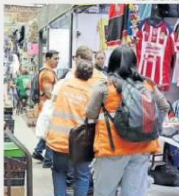
SOCIALIZACIÓN. El personal municipal realizó recorridos en negocios del primer polígono.