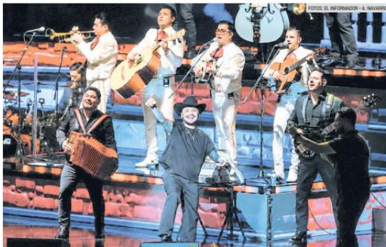
CHRISTIAN NODAL. El cantautor ofreció un concierto donde interpretó viejos y nuevos temas.

La noche terminó entre gritos, versos y copas. “Guadalajara, quién se la va a amanecer conmigo”, gritó Nodal.