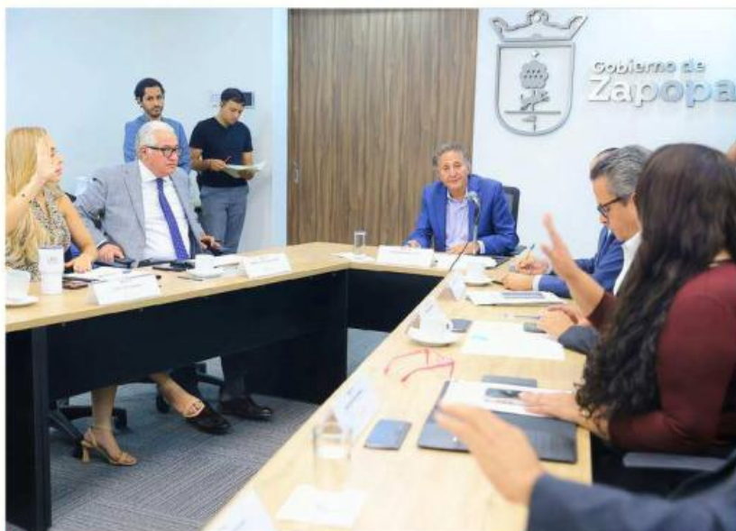
El Gobierno de Zapopan celebró ayer la Sesión Ordinaria del Consejo Municipal de Gestión Integral de Riesgos.

Durante la sesión del Consejo Municipal de Gestión Integral de Riesgos, autoridades municipales presentaron las acciones