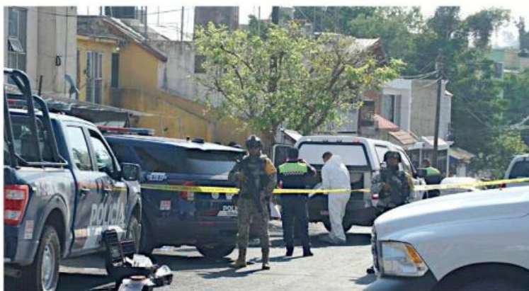
■ Dos personas murieron dentro de la vivienda ubicada en Loma Dorada.

Además, otras cuatro personas resultaron lesionadas y fueron llevadas a distintos puestos de socorro; hasta ayer no se había informado las edades de los afectados y el parentesco que tenían entre sí.