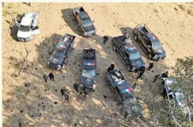
El FBI, agentes de Jalisco y fuerzas federales se coordinaron para localizar al estadounidense.

Miembros de la Secretaría de la Defensa Nacio-