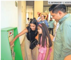
SALA DE ATENCIÓN. El centro brindará terapias de lenguaje, estimulación cognitiva, atención sensorial y acompañamiento integral para familias.