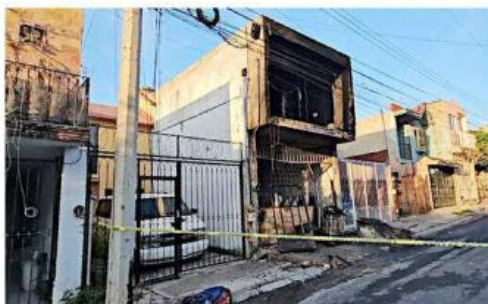
■ Vecinos llamaron al 911 tras ver fuego en la casa.

Vecinos de la zona señalaron que el fuego avanzó rápidamente y que intentaron combatirlo.