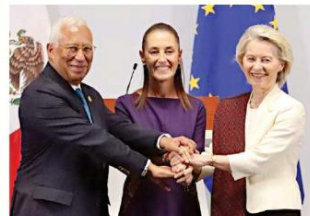
António Costa, presidente del Consejo Europeo, Claudia Sheinbaum y Ursula von der Leyen, presidenta de la Comisión Europea, firmaron el acuerdo global modernizado.