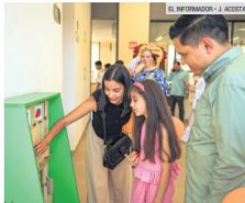
SALA DE ATENCIÓN. El centro brindará terapias de lenguaje, estimulación cognitiva, atención sensorial y acompañamiento integral para familias.