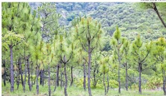
EFFECTO POSIBLE. El estrés de vegetación podría incrementar el riesgo de incendios en La Primavera.

climáticas y al aumento de combustibles ligeros por las lluvias del año pasado se logró reducir la superficie afectada por incendios forestales a 971 hectáreas, cuando el promedio histórico de los últimos diez años era de alrededor de 2 mil 500 hectáreas.