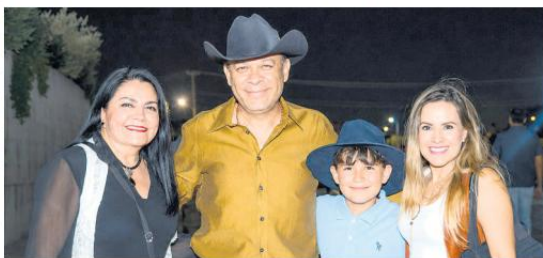
FAMILIA PÉREZ. Seguidores de todas las edades disfrutaron del concierto.