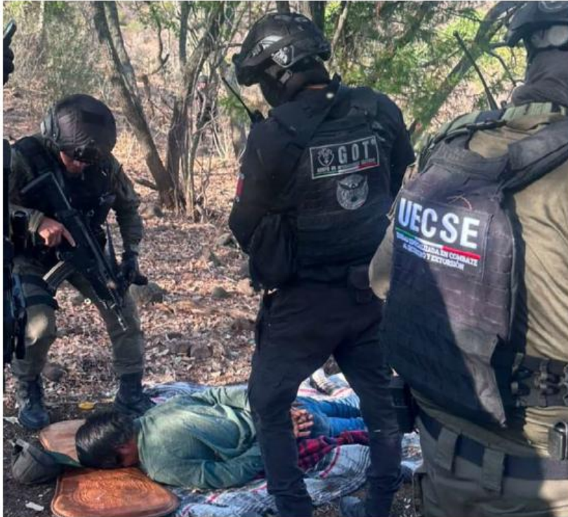
El operativo se realizó en la zona serrana de Jalisco.

Después de realizar labores de inteligencia e investigación, elementos de seguridad lograron ubicar al ciudadano norteamericano en una zona de difícil acceso y montaron un operativo especial para su conseguir su liberación.