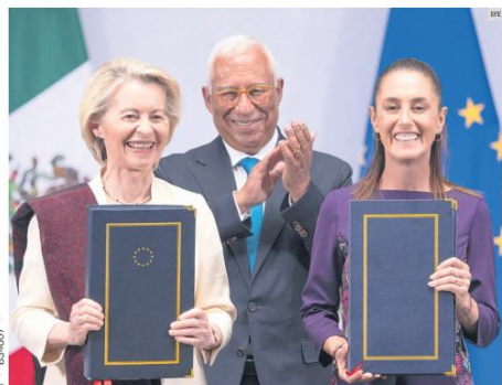
PALACIO NACIONAL. Claudia Sheinbaum y la presidenta de la Comisión Europea, Ursula von der Leyen, encabezaron la firma del Acuerdo Global Modernizado entre México y la Unión Europea. António Costa, presidente del Consejo Europeo, también fue testigo y participante de la VIII Cumbre.