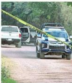
El crimen ocurrió en la Colonia Parque Las Palmas.

La Fiscalía de Jalisco informó que las otras dos mujeres asesinadas el 10 y 15 de mayo tampoco han sido iden-