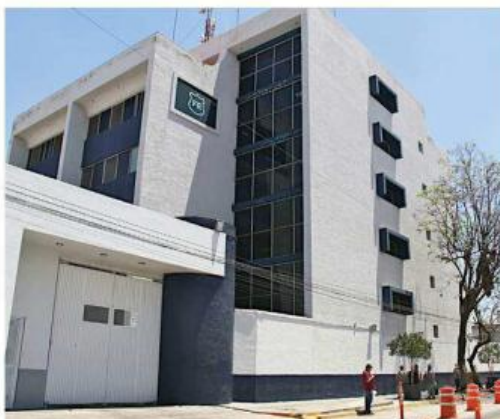
El mando señalado es titular del área de Robo a Vehículo de Carga Pesada de la Fiscalía del Estado.

"Cuando empecé a ver que la que está firmando soy yo, la que se va a meter en problemas soy yo, y al rato que venga Contraloría, Visitaduría, Fiscalía Anticorrupción, la que va a dar la cara soy yo, empecé a rebelarme y decir: 'no voy a sacar órde-