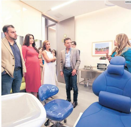
APERTURA. El gobernador Pablo Lemus y la presidenta del DIF estatal, Maye Villa, junto al alcalde Miguel Ángel Esquivias y su esposa, Priscilla Franco, inauguraron el Centro Regional de Autismo y Discapacidad Intelectual en Tepetitlán.

Jalisco consolida una red estatal de atención con clínicas operando en Guadalajara y Zapopan, además de nuevos complejos proyectados en Vallarta, Zapotlán y Lagos