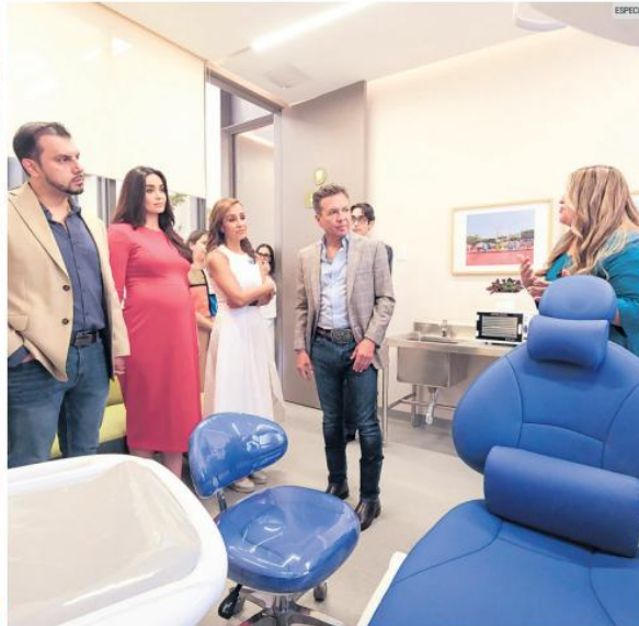
APERTURA. El gobernador Pablo Lemus y la presidenta del DIF estatal, Maye Villa, junto al alcalde Miguel Ángel Esquivias y su esposa, Priscila Franco, inauguraron el Centro Regional de Autismo y Discapacidad Intelectual en Tepatlán.

Jalisco consolida una red estatal de atención con clínicas operando en Guadalajara y Zapopan, además de nuevos complejos proyectados en Vallarta, Zapotlán y Lagos