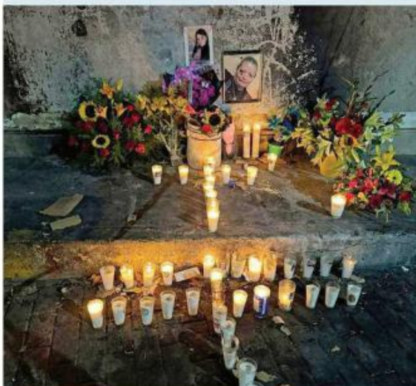
■ Habitantes recabaron fondos para ayudar a las familias.

Quedaban tres días de fiesta y, tras el accidente, se decretó luto en Amatitán.