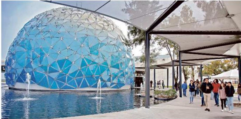
■ A lo largo de sus primeros 12 meses, el Planetario Lunaria ha ofrecido 170 talleres de ciencia a sus visitantes.

La entrada al Planetario será gratis hoy