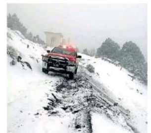
El frío azotó con rudeza en el Nevado de Colima.

También recomendó a los visitantes revisar las condiciones del o los vehículos con los que se pretenda llegar a la zona. Hasta el momento la UEPCBJ no re-