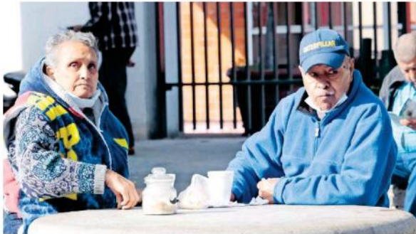
El frío sorprendió a los tapatíos durante el fin de semana.

El Instituto de Astronomía y Meteorología de la Universidad de Guadalajara por su parte, señaló que la masa de aire frío propiciará disminución en la temperatura en la Zona Metropolitana de Guadalajara y probabilidad de chubasco. Destaca el SMN que iniciará el solsticio de invierno en el Hemisferio Norte.