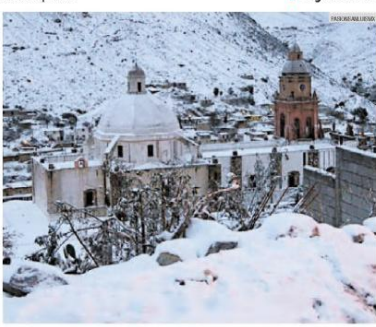
REAL DE GATORCE. San Luis Potosí se pintó de blanco y mostró al mundo estas postales.

Vendedores de piñatas en México luchan por mantener la costumbre de las posadas. VIDEO: https://bit.ly/2MkJud3