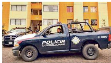
En El Sauz fue encontrado el cadáver de un hombre.

"Quienes matan no se ponen a pensar en el daño que hacen, me levanto y lo veo (en foto), y siento como si no fuera cierto, como si fuera un sueño, pero la realidad es otra ¿qué hago?", lamentó.