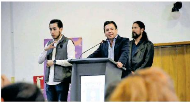
El alcalde de Zapopan se dijo abierto para dialogar con el Gobierno Federal.

con el Gobierno Federal para llegar a acuerdos sobre los recortes a las participaciones federales y a la fecha ha sostenido diálogo como diversos actores políticos, entre ellos con el secretario de Hacienda para dialogar no solamente sobre