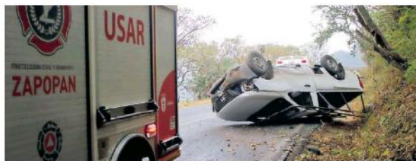
Los hechos en la carretera a Saltillo.

tosí, Zacatecas, Aguascalientes, Hidalgo, Veracruz, Puebla, Tlaxcala y el Estado de México, y de 0 a 5 grados Celsius y heladas en montañas de Jalisco, Michoacán, Guanajuato.