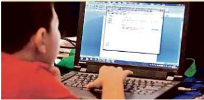
La fundación PAS sugiere enseñar a los niños sobre los riesgos que existen al utilizar las redes sociales.

De acuerdo con la Encuesta Nacional sobre Disponibilidad y Uso de Tecnologías de la Información en los Hogares 2018, realizada por el INEGI, hay 887 mil 968 niños de 12 a 17 años en Jalisco que usan Internet, así como 583 mil 203 usuarios de 6 a 11 años.