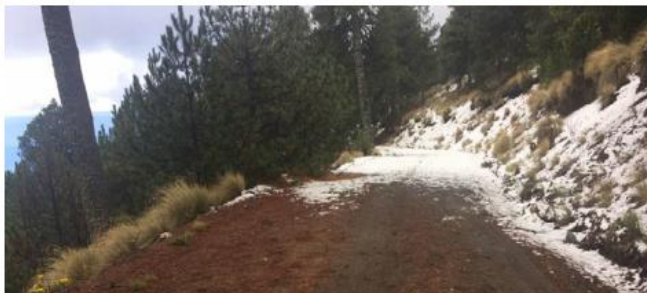
Se presentó una acumulación de nieve de hasta 3 cm.