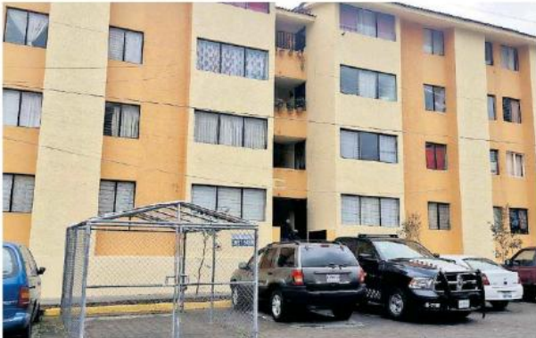
El hallazgo se dio cerca de las 11:00 horas en un departamento del cuarto nivel de la Torre C.