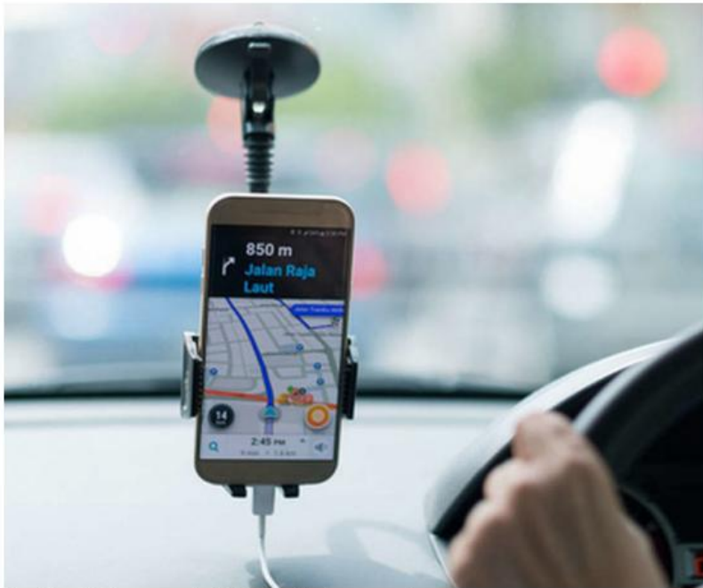
Con Uber y Didi, suman más de 24 mil vehículos.

Cabe señalar que a diferencia del procedimiento que se llevó en la pasada administración, para el registro de asociados y vehículos éstos acuden a su res-