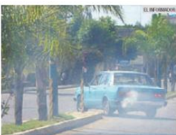
SMOG. Reducir contaminantes: el fin de la NOM 016.

Prohibición La legisladora aseguró que solicitaron prohibir el MTBE como oxigenante, como sucede en Estados Unidos, y hacer una sustitución por el etanol porque éste se puede producir y beneficiar a regiones que se dedican al cultivo de maíz y caña de azúcar.