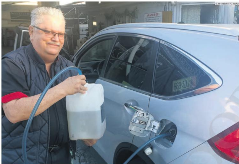
EN FUNCIONES. En diversos puntos de la metrópoli es posible adquirir etanol, un biocombustible hecho a partir de la caña de azúcar.

ENERGÍA LA NOM 016 PROHÍBE LA COMERCIALIZACIÓN EN GUADALAJARA, CIUDAD DE MÉXICO Y MONTERREY