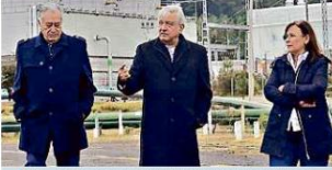
Bartlett, director de CFE; el Presidente y Nahle, titular de Energía, visitaron ayer una central geotermoelectrícula.