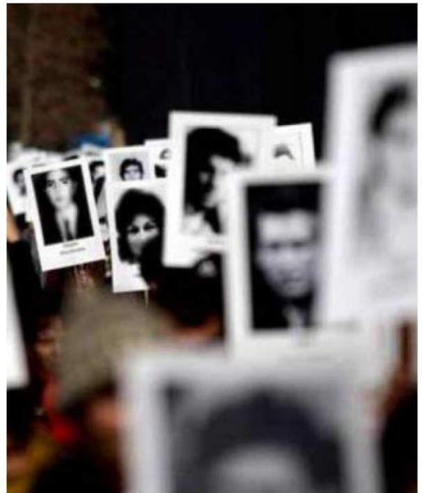
El número de víctimas va al alza.

De enero a octubre, la Fiscalía del Estado de Jalisco inició 648 carpetas de investigación, junio fue el mes con más incidencia al reportarse 95 casos, le siguió enero con 81, mayo 73, febrero con 71, julio 69, marzo 62, abril 60, agosto 56, septiembre 42 y octubre 39.