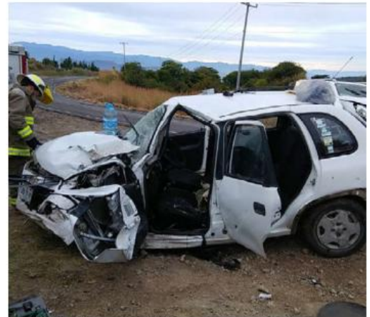
El golpe fue frontal.

Desde el pasado 18 de octubre, la Secretaría de Transporte autorizó un aumento a la ruta 380 que es identificada como Troncal 19 o T-19. Su recorrido inicia en la colonia Barro Nuevo en Tonalá y su derrotero es el circuito del periférico. El ministerio público aseguró el video para deslindar responsabilidades. ■