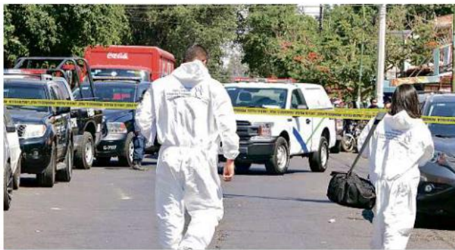
El crimen ocurrió el pasado 6 de abril en un negocio de la Colonia Lomas de Polanco.

"La verdad hasta me la pensaba (en hablar del caso) porque de todos modos ya le muero y no me lo van a regresar ni nada; pero igual créame que me siento bien mal en la forma de que él solamente estaba trabajando y se me hace bien injusto que