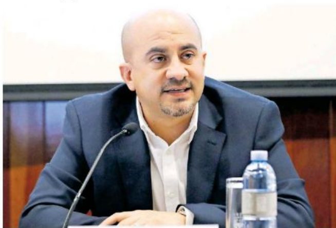
Asegura el alcalde que el problema se ha solventado.

Aunque señaló que existe el compromiso de que a inicios del año siguiente se entreguen los restantes, admitió que el problema que se ha tenido en la ciudad