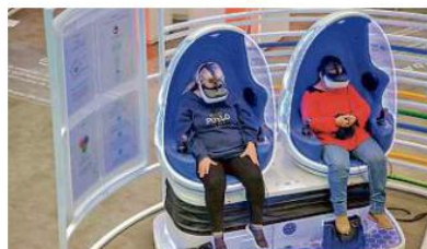
■ La inmersión en la realidad virtual es una de sus atracciones.