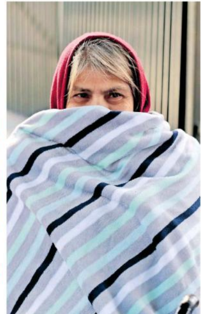
Saque chamarras y paraguas que el fuerte frío seguirá.

sierras de Sonora, Chihuahua, Durango, Coahuila y Nuevo León, de -5 a 0 grados Celsius y heladas en cordilleras de los estados de Baja California, San Luis Po-