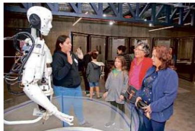
■ Este robot es exhibido dentro del Planetario.

El planetario Lunaria fue construido durante la pasada administración por la Secretaría de Innovación Ciencia y Tecnología (SICYT).