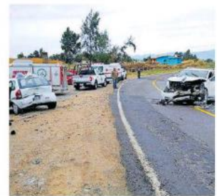
Fuerte encontronazo entre un auto compacto y una camioneta.

informó que serán peritos de Ciencias Forenses los que determinen con exactitud la causa de la colisión. Así suman ya 17 personas que han perdido la vida en accidentes carreteros desde que inició operativo invernal de las autoridades estatales el pasado 13 de diciembre.