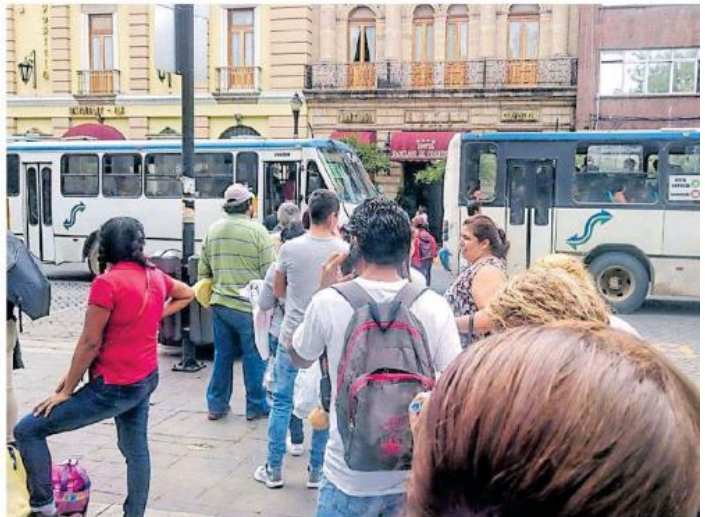
Algunos usuarios se dicen inconformes por la calidad del servicio.

CIDENTAL selalaron que las alcancias son las que marca la norma técnica, así la saco el Gobierno del Estado, y no pueden dar cambio. 'Porque sería muy tardado el abordaje. Así que hay que cargar la cantidad exacta', manifestaron.