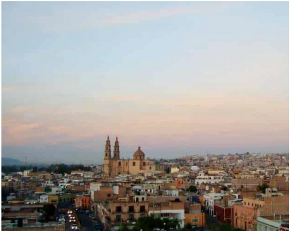
Están etiquetados 150 mdp para la reconstrucción completa que conduce de la autopista de Aguascalientes a Teocaltiche.