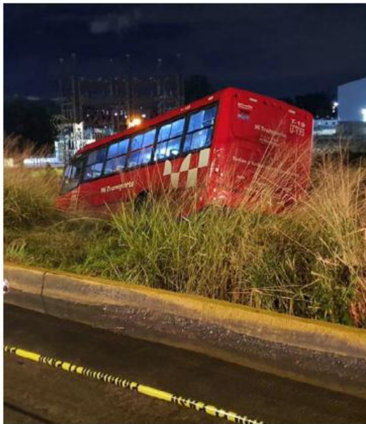
El chofer de la unidad huyó del lugar.

Al arribar al sitio, los agentes viales también localizaron un vehículo Neón con placas JHX-4794, pero del impacto quedó sobre el acotamiento y en sentido contrario al que circulaba. De acuerdo con las primeras versiones, dicho vehículo particular