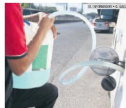
REALIDADES. Venta de etanol en Guadalajara.

Lamentó que en México se siga utilizando como oxigenante de gasolinas el metil-terbutil éter (MTBE), que ya está prohibido en otros países, pues “se ha demostrado que las mezclas del etanol a 10% tienen un beneficio al medio ambiente y los vehículos que circulan en el país pueden utilizarlo sin mayor riesgo”.