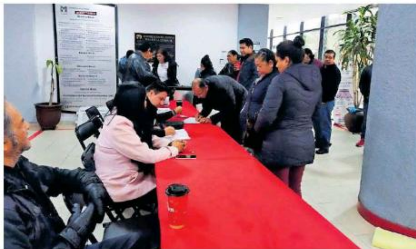
Acudieron afiliados priistas a cada una de las cuatro sedes en Guadalajara.

Se registró poca afluencia en las cuatro sedes donde se llevó a cabo el comicio