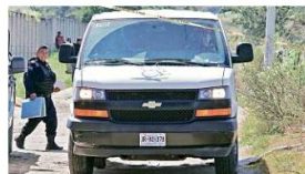
El cadáver de un hombre embolsado fue descubierto en una brecha de San Sebastián El Grande, en Tlajomulco.

Entre el medio día del viernes y la tarde de ayer, tres personas fueron asesinadas en Jalisco. Ayer, un cadáver fue abandonado en una brecha de San Sebastián El Grande, en Tlajomulco. El cuerpo estaba envuelto en plástico negro y amarrado con cinta canela; fue dejado en una zona conocida como Tabachines, en la brecha Hidalgo, entre Nogal y Jamaica. Había algunas partes del