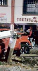
TUMBA POSTE. Una camioneta Tacoma se impactó contra el poste de luz y uno de teléfono dejando varios vehículos dañados.

Además de las dos fincas ya mencionadas, la Fiscalía del Estado aún espera una orden de cateo para indagar en una tercera que es derivada de la séptima detención ocurrida el 6 de noviembre. Este año se localizó además la segunda fosa más grande de la que se tenga registro en Jalisco, pues del 3 de septiembre pasado hasta el 24 fueron extraídas un total de 138 bolsas con restos humanos de La Primavera, en Zapopan. Aquella ocasión localizaron en una fosa 119 bolsas y en una pileta otras 19.