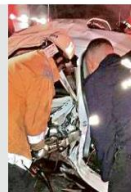
Un fallecido y 3 rescatados fue el saldo de un choque R. Michel cerca de Lázaro Cárdenas.