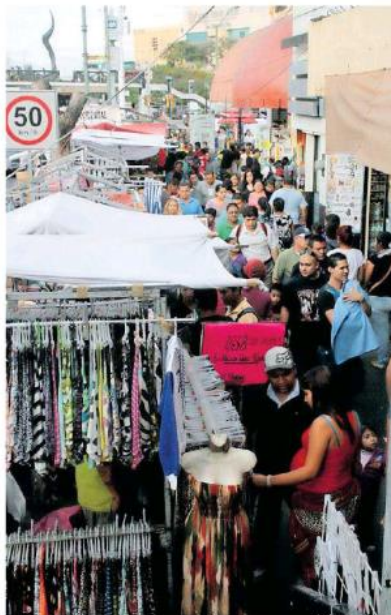
De todo se vende - y hasta se compra- en la Calzada Independencia.

Además, en el ayuntamiento tapatío tienen detectado -tras los operativos- que parte de la mercancía que más se vende son plumas, llaveros, audífonos, cargado-