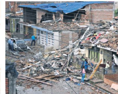
SALDO. El ataque del viernes por la noche dejó cuatro muertos y 10 heridos.