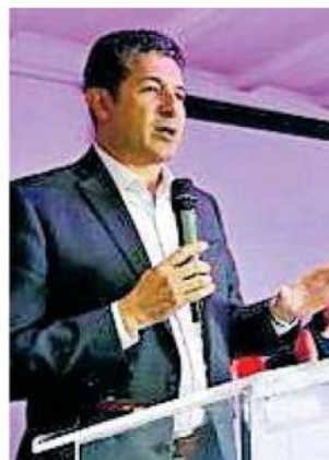
El secretario de Educación, Juan Carlos Flores.

Destaca que "La causa del problema no es la falta de recursos, sino las condicionantes normativas derivadas de las dos últimas reformas constitucionales en materia educativa, que exige el Gobierno Federal para efectuar los pagos".