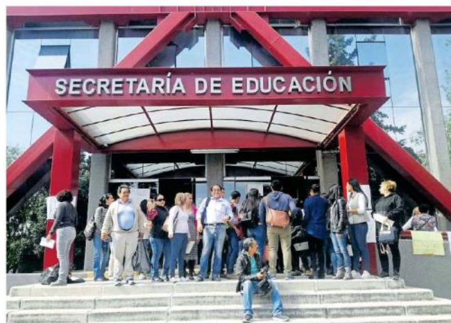
El gran problema es la centralización de la nómina.

Agregaron que también hay casos extraordinarios como el pago de incentivos que no fueron gestionados por la pasada administración.