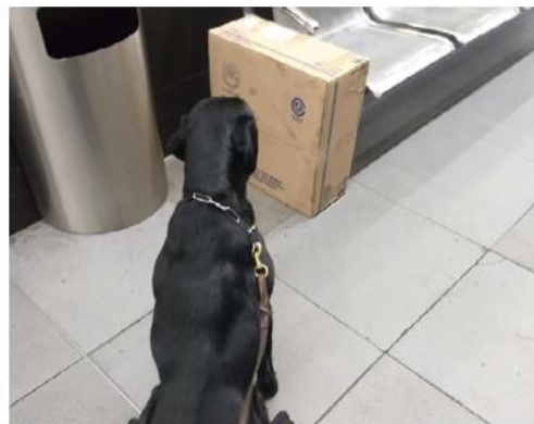
Binomios caninos ayudaron a la detección. ESPECIAL

la aparente droga fue puesta a disposición del Agente del Ministerio Público Federal donde se iniciarán las indagatorias correspondientes, además de determinar el peso exacto y tipo de sustancia asegurada, para proceder a la investigación pertinente.