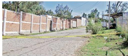
La Fiscalía inició el pasado viernes el cateo en una finca en la Colonia El Mirador.

En el segundo día de labores en la finca de El Mirador, en Tlajomulco, sumaron ya 54 secciones anatómicas pertenecientes a cuerpos humanos que han sido extraídas, informó la Fiscalía del Estado. La dependencia expresó que la Fiscalía Especializada en Personas Desaparecidas inició el pasado viernes un cateo en una finca en la Colonia El Mirador para localizar restos humanos. Ayer sumaron un total de 54 restos humanos extraídos tras dos días de trabajo en la zona, los cuales fueron trasladados al Instituto Jalisciense de Ciencias Forenses (IJCF) para realizar las pruebas periciales correspondientes y poder determinar el número total de víctimas. La dependencia aseguró que las labores de búsqueda de personas desaparecidas continuarán en el lugar has-