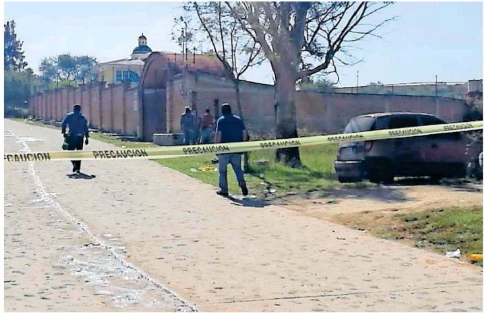
Todas las partes humanas encontradas en Tlajomulco fueron trasladadas al Servicio Médico Forense.

"La sociedad civil se está organizando para buscar e identificar aquellas inhumaciones clandestinas, llamadas fosas