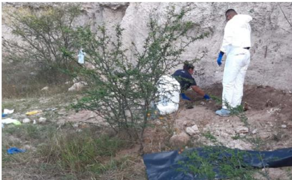
Fueron encontrados en la comunidad de El Chayotillo. ESPECIAL