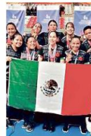
El equipo de fútbol femenino de Guadalajara sumó un bronce.