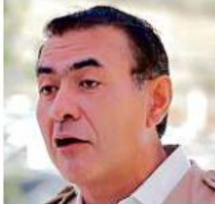
Salvador Zamora Alcalde de Tlajomulco

En caso que algún servidor público, que no esté facultado, que no haya estado invitado, que no tenía nada que hacer ahí, por supuesto que sí (procede sanción)".