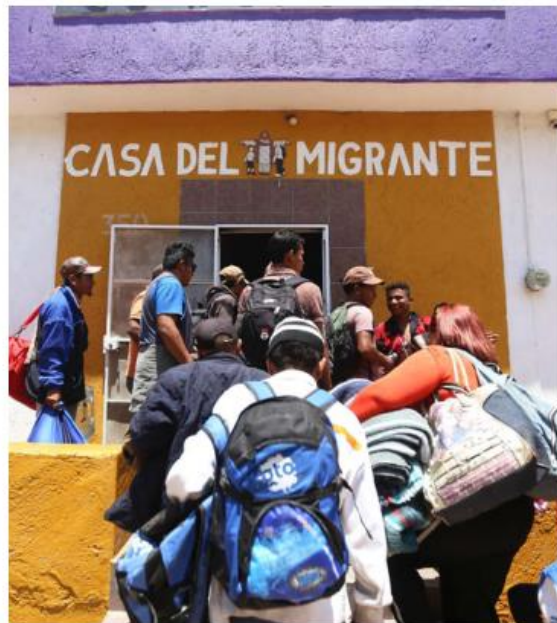
El párroco ya ratificó la denuncia. NACHOREYES

El responsable de la Parroquia Nuestra Señora del Refugio informó que ya ratificó la denuncia que presentó en la Fiscalía del estado por el robo que cometieron seis sujetos armados. ■