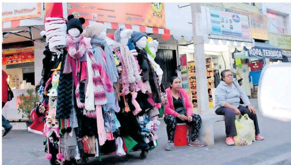
Pese a restricciones, los ambulantes se instalan en el primer cuadro.