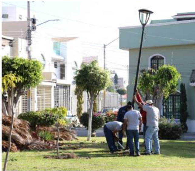
Ayer se trabajó en Lomas de Independencia.