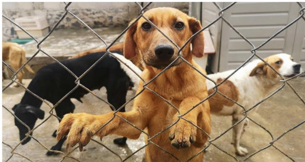
La tortura, la crueldad y el maltrato animal son delitos. ESPECIAL