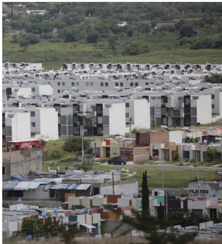
El familiar de la víctima dijo que fueron llevados a unas casas de tres niveles.

Lomas del Mirador. La búsqueda se prolongó por más de una hora, hasta que dieron con un grupo de jóvenes