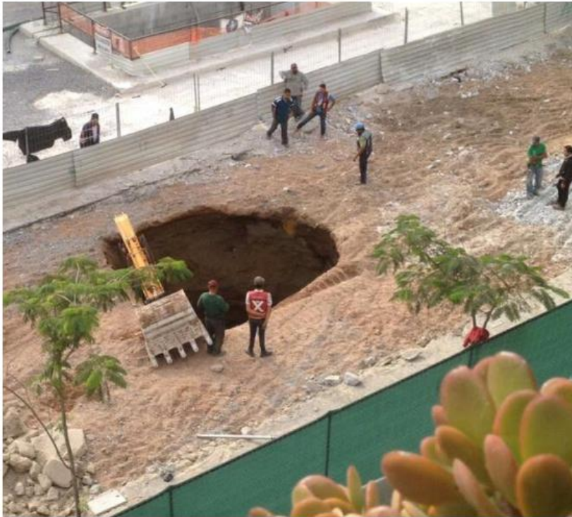
Falta un estudio técnico para determinar acciones preventivas. ESPECIAL

Ingenieros. Hay varios puntos vulnerables, pero el que más preocupa es el tramo de Alcalde, afectado desde mayo