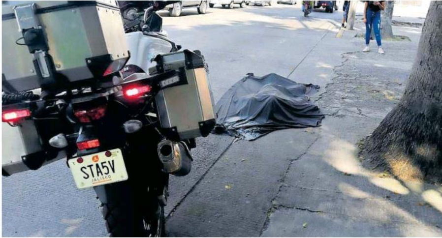
El incidente ocurrió en la colonia Americana. ROMÁN ORTEGA