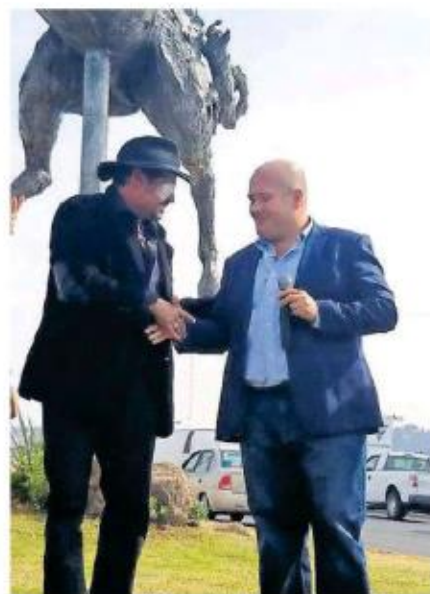
Las Tres Gracias, llevan un serio retraso.

Del Toro Castro explicó que con eso se buscará continuar con el desarrollo de la identidad de la Ciudad y en el caso de la tercera escultura de la obra de "Las Tres Gracias" está ya en proceso de fundición