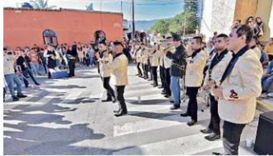
Funcionarios de Tlajomulco participaron el viernes de la fiesta por el Día del Música en Cuexcomatitlán.