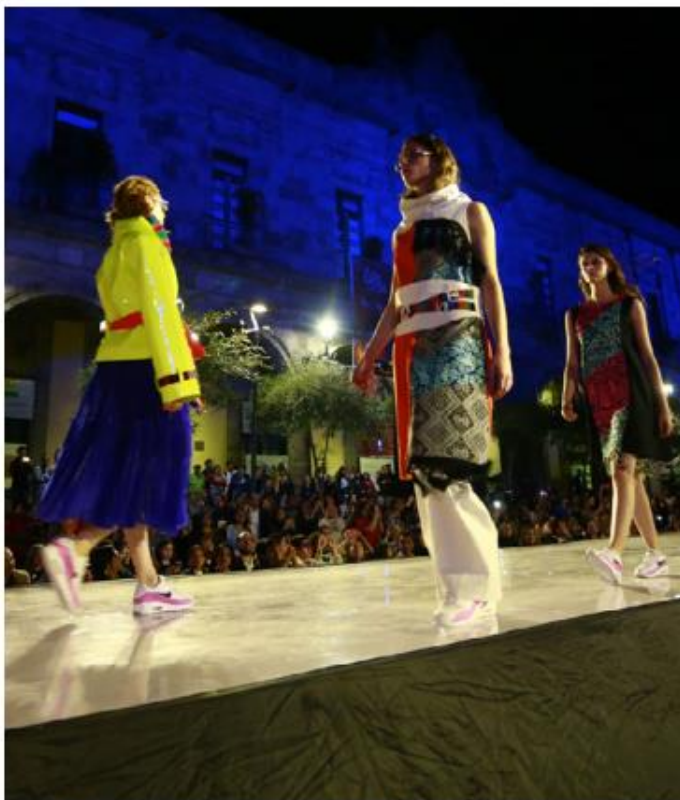
La colaboración comenzó desde 2018.

Luego de varios meses de trabajo de conjunto, y de visitar ambas sedes, el 28 de octubre, se presentaron las 18 piezas diseñadas por las cuatro estudiantes seleccionadas, en el Fashion Graduate Italy 2019, donde la colección generó buenas críticas en la comunidad de la moda italiana, confirmó la contraparte.