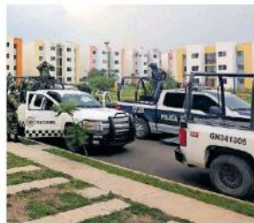
La bolsa negra estaba amarrada con cinta canela.

La bolsa negra estaba amarrada con cinta canela, pero se alcanzaba a avisar una playera en color rojo. Paramédicos de los Servicios Médicos acudieron al lugar y