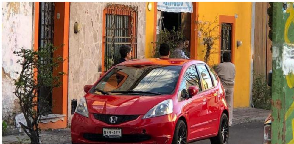
La agresión ocurrió en una menudería en la colonia Quinta Velarde.

Violencia. La víctima fue despojada de una camioneta y le dispararon en el tórax; los presuntos delinquentes fueron lesionados con un arma de fuego por una joven, en la Perla Tapatía