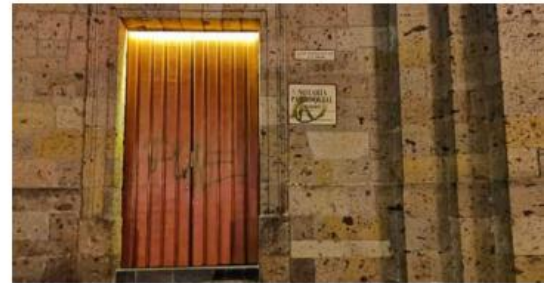
Una de las puertas dañada.

Dos jóvenes fueron detenidos por rayar la Catedral, y dos monumentos de la Plaza de Armas en el Centro Histórico de Guadalajara.