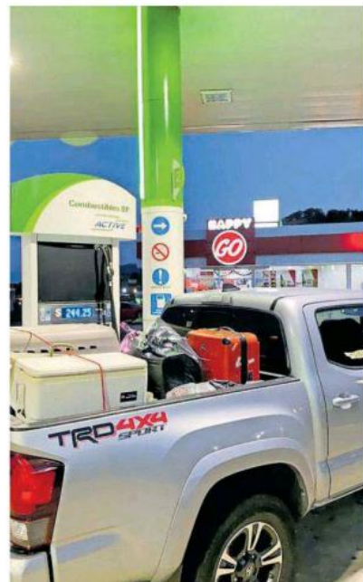
Los hechos en la gasolinera que se ubica en la carretera a Nogales, poco antes del entronque con la autopista.

A nivel nacional, Jalisco se posiciona en segundo lugar en robo de vehículos con 15,178, solo por debajo del Estado de México que registró 20 mil 826, al corte de noviembre pasado.