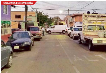
■ A cuatro hombres les dispararon con armas largas y perecieron.

En la Colonia Quinta Venada, también en la Perla tapatía, tres presuntos ladrones irrumpieron en una menadería y mataron a balazos a Lola, la dueña del negocio, y escaparon con pertenencias de