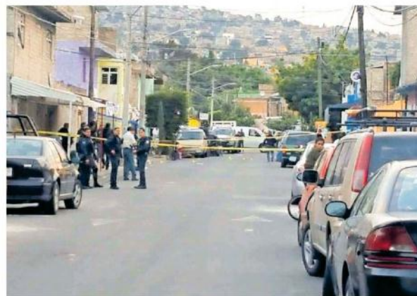
Sujetos desconocidos asesinaron a balazos cuatro hombres en la colonia Echeverría.

un canal de aguas negras al cruce con Avenida de Jesús, en Santa Cruz del Valle, en el límite de Tlajomulco y Tlaquepaque.