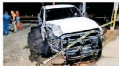
El exelemento protagonizó un choque.

El detenido ya fue puesto a disposición del juez de control, a la espera de que se fije fecha para la audiencia