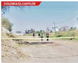
■ A la víctima le dejaron un mensaje clavado en el abdomen.