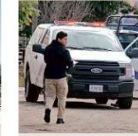
■ El caso ocurrió el domingo en la Colonia Parques de Santa Cruz.

Todo parece indicar que el niño de 10 años se quitó la vida.