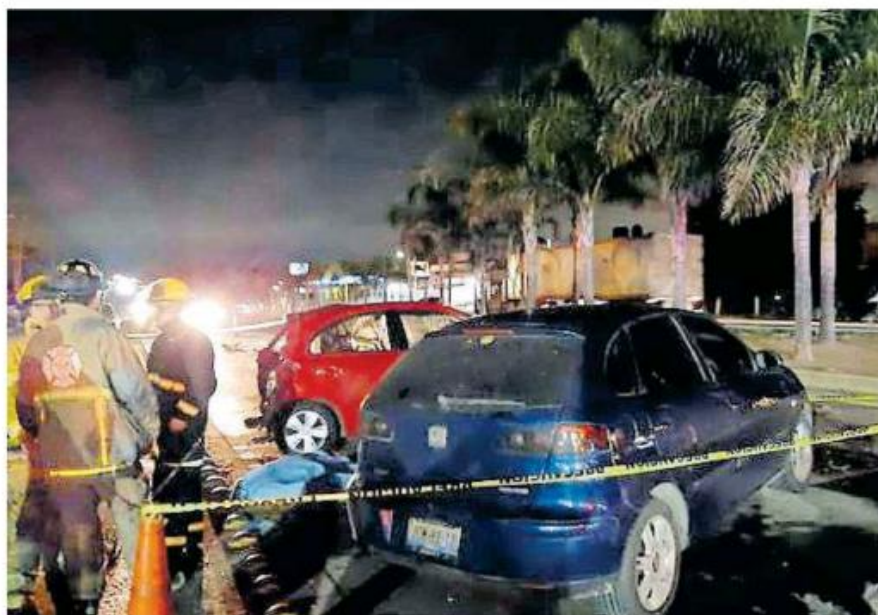
En el accidente participó un elemento de la Fiscalía Estatal.

Indicó que el domingo estuvo en la Fiscalía realizando la declaración correspondiente, sin embargo, aún no establecen una fecha para realizar las diligencias correspondientes: “Todavía no me dicen bien la fecha, pero novedades al respecto que me han informado ha sido lo único”.