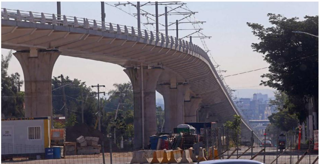
Todavía hay partes de la obra que se encuentran inconclusas. FERNANDO CARRANZA