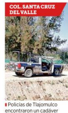
■ Policías de Tlajomulco encontraron un cadáver en un canal pluvial.

comensales y hasta la alcancía de las propinas, aproximadamente a las 7:15 horas.