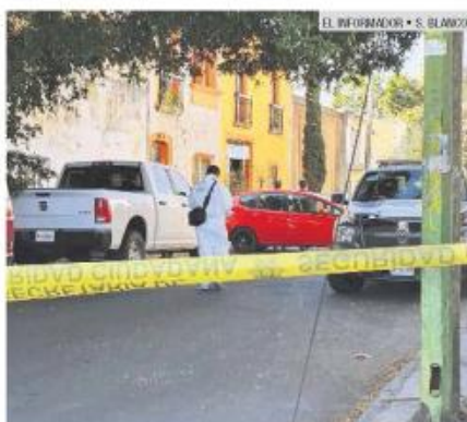
QUINTA VELARDE. La dueña de una menudería fue asesinada en un asalto.

Además, la propietaria de un negocio de comida fue asesinada a balazos en un asalto, ocurrido afuera del establecimiento ubicado en la Colonia Quinta Velarde.