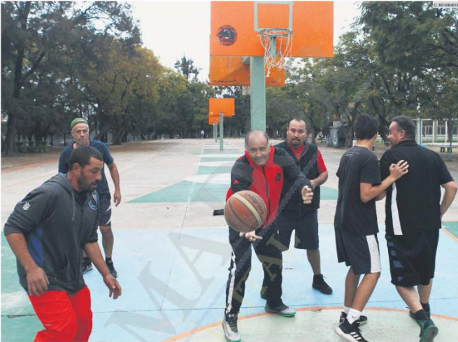
LÓPEZ MATEOS. En esta unidad deportiva hay mejoras, pero los usuarios piden más vigilancia, sobre todo por las tardes.

Sobre las personas que consumen drogas recalcó que dicho operativo atiende los puntos conocidos de concentración de infractores o presuntos delincuentes, incluyendo las unidades deportivas. "Y mantenemos una estrecha coordinación con el Consejo Municipal del Deporte para la atención de las incidencias que ellos pudieran tener registradas".