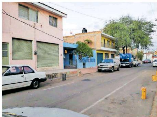
Un presunto ladrón perdió la vida luego de intentar ingresar a un domicilio.

En otro hecho, sujetos desconocidos asesinaron a un taxista en la colonia Las Junitas.