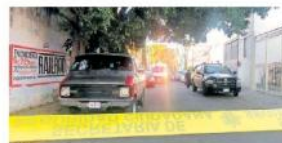
La ahora occisa era una mujer de 60 años.

Los causantes escaparon en una camioneta pick up en color blanco, sin que los vecinos identificaran mayores características de los agresores, detalla un policía municipal tapatío.