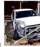
■ La familia de la víctima mortal exige justicia.

Una mujer fingió ayudar a la familia de un recién nacido en Tlajomulco para robarse.