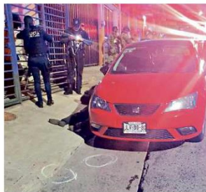
De acuerdo con reportes policiales, los agresores dispararon en al menos 15 ocasiones.

herido a un hospital del IMSS, donde falleció. El crimen de estas tres personas vinculadas al Poder Judicial se registró alrededor de las 22:00 horas del domingo, en el cruce de las calles Egipto y Hacienda La Colmena, y los asesinos dispararon al menos 15 veces, según reportes policiales. De acuerdo con fuentes judiciales, tanto Zúñiga Lu-