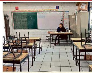
En la escuela federal Anshuac, en la Colonia Zoquiapan, de Zapopan, maestros adelantaron pendientes ayer.