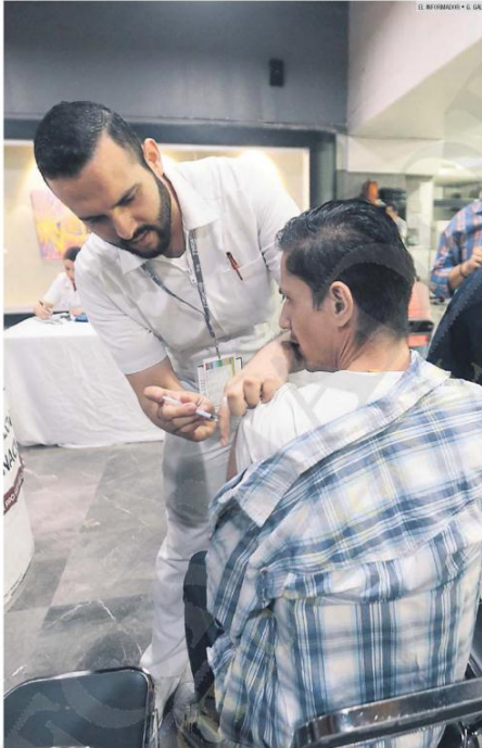
REZAGO. La Secretaría de Salud confirma que 929 mil 433 biológicos faltan por aplicar en Jalisco.

De acuerdo con la dependencia, las vacunas ayudan al sistema inmunológico del organismo a construir memoria y para defenderse de los microorganismos con los que entra en contacto creando defensas (anticuerpos). "El sistema inmunológico de un niño vacunado reconoce a una bacteria o virus cuando entra en el cuerpo humano y la combate antes de que origine la enfermedad".