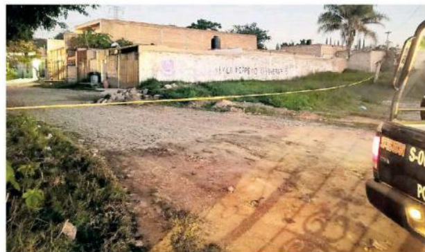
Un hombre fue localizado sin vida y con golpes en el municipio de El Salto.

En el segundo caso, sujetos desconocidos asesinaron a balazos a un hombre en calles de la colonia Constitución en