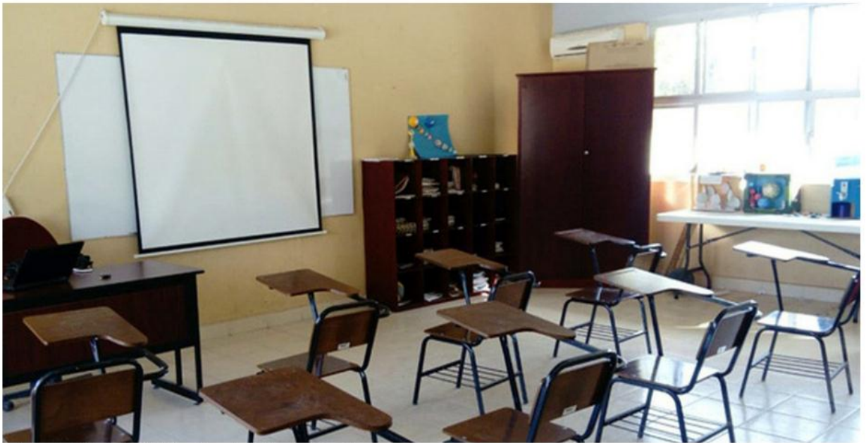
La Secundaria Técnica 1 participó en el paro de actividades.