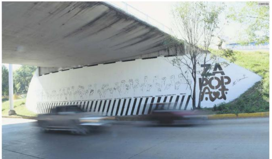
MURAL. La obra “Precaución: Mujeres fuertes” se ubica en Avenida Ignacio L. Vallarta y Avenida México.

En Jalisco, 74 % de las mujeres mayores de 15 años ha sido objeto de violencia, y de éstas, en 47 % de los casos el maltrato fue ejercido por su pareja, expareja o un familiar. Al respecto, la regidora presidenta de la Comisión Edilicia de