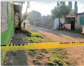
Uno de los crímenes ocurrió en la Colonia La Ermita.