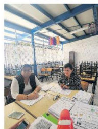
AULAS VACÍAS. Algunos profesores asistieron a la escuela, pero sólo a atender temas administrativos.

El gobernador de Jalisco, Enrique Alfaro, puntualizó que el atraso en los pagos para más de dos mil maestros federalizados adscritos a la sección 16 del Sindicato Nacional de Trabajadores de la Educación (SNTE), es un tema federal.