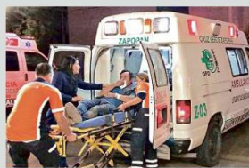
Los paramédicos corrieron peligro al ayudar a un hombre.

Según policías municipales, la víctima refirió que fue a comprar bebidas