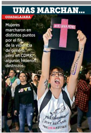
UNAS MARCHAN... GUADALAJARA Mujeres marcharon en distintos puntos por el fin de la violencia de género, pero en CDMX, algunas hicieron destrozos.