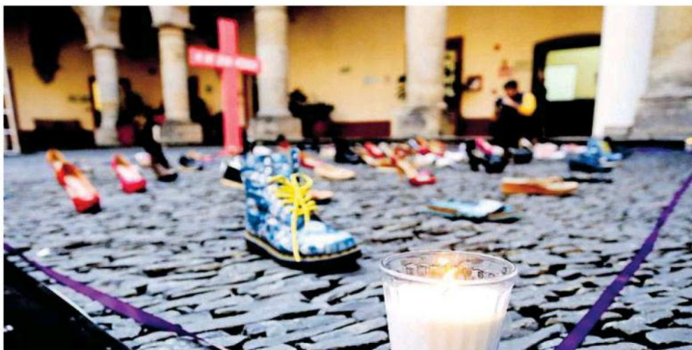
En el Congreso realizaron un memorial en memoria de las mujeres víctimas de la violencia.