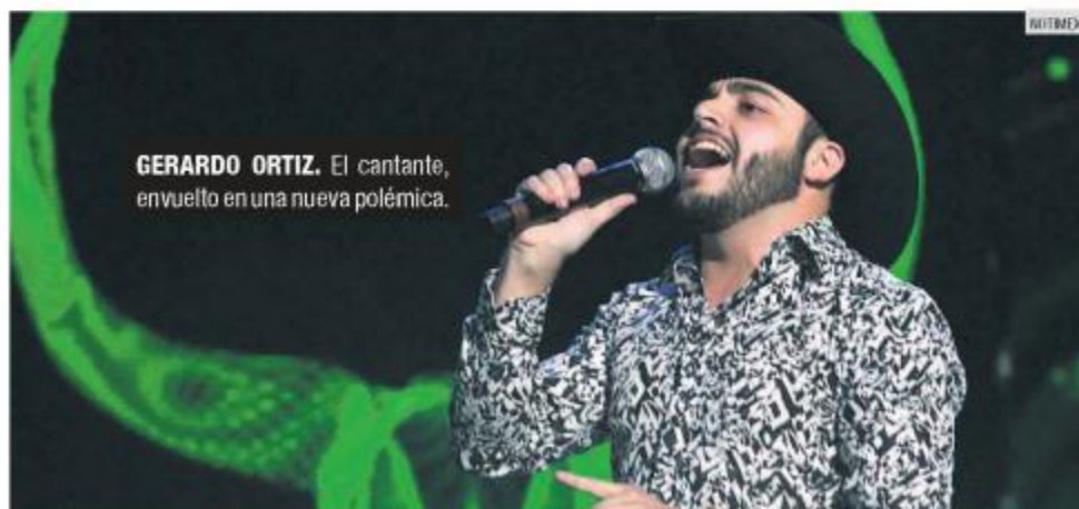
GERARDO ORTIZ. El cantante, envuelto en una nueva polémica.

El recinto de espectáculos dio a conocer que el procedimiento de reembolso del boletaje para aquellos que adquirieron su entrada comenzará a partir del 28 de noviembre por la misma vía donde fueron adquiridos.