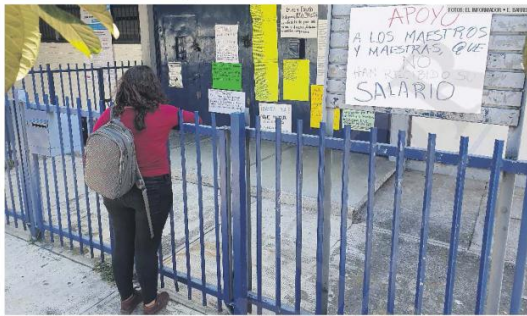
POR MILES. Fueron 60 mil maestros los que no impartieron clases ayer en Jalisco.