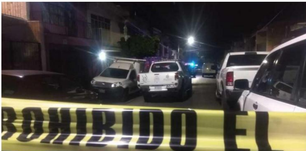
El ataque ocurrió la noche del pasado domingo. MARTÍN PATIÑO

Agresión. Sujetos armados arribaron a bordo de un vehículo y dispararon contra tres hombres en la colonia Heliodoro Hernández Loza; un litigante también resultó herido de gravedad