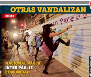
OTRAS VANDALIZAN CDMX NACIONAL PÁG. 8 INTER PÁG. 13 COMUNIDAD