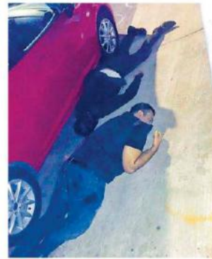
El Juez y el abogado quedaron sin vida sobre la calle. CORTESÍA

El 16 de agosto de 2016 presentó su renuncia como secretario del Juzgado de Colotlán con el argumento del que estaba "harto del olvido" de las autoridades del Poder Judicial, además de atender a "hulchales estúpidos y apuestos", según lo asentó en el oficio 41/2016, que consta en registros periodísticos.