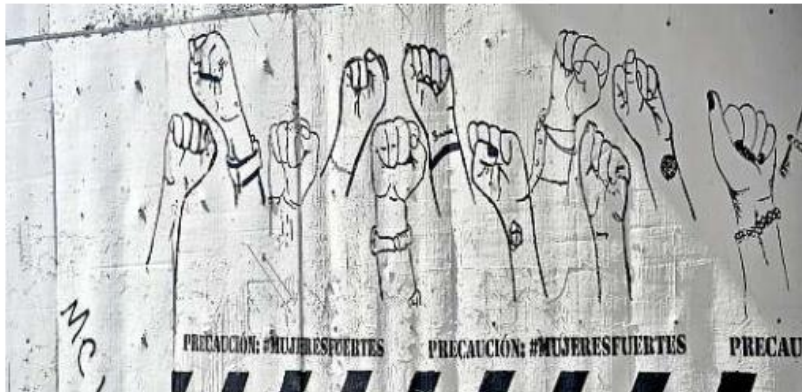
El mural colectivo "Precaución: Mujeres Fuertes" fue una iniciativa de la artista MC Lancaster.

el primero de muchos muros llenos de mujeres protestando, pero que al mismo tiempo se convierta en un muro, como ése, de contención entre mujeres, en el que aprendamos a respetarnos entre nosotras, nos hagamos crecer