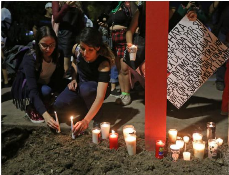
Recuerdan a las víctimas de feminicidio. FERNANDO CARRANZA

di, asesinada hace un año y medio: “Seguimos sin tener respuestas de la investigación, ni de ni de nada de su muerte, estamos en blanco, de lo poco que nosotros hemos sabido por nuestra cuenta y pues seguimos esperando ahí en la Fiscalía hablando y preguntando y dando lata, para que haya alguna respuesta (...) seguimos haciendo las marchas, eventos y haciendo que se escuche la voz, no nada más a mi hermana, si no de todas las mujeres que han sido asesinadas en Jalisco y en el país”.