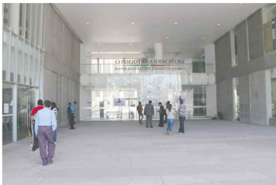
ACUSADO. El juez contaba con varias quejas en el Consejo de la Judicatura.

En las labores participaron elementos de la Policía Federal, Cruz Roja y policías municipales. Juan Levario