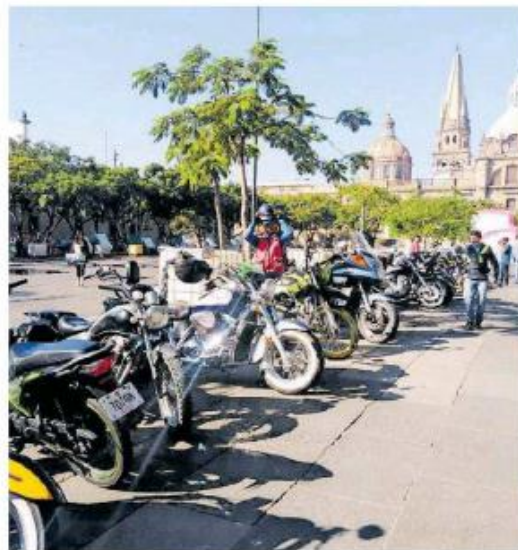
Consideran exagerado el 400 por ciento de aumento.

Tras exigir la salida del diputado Jonadab Martínez, presidente de la Comisión de Movilidad, al final un grupo de manifestantes pasó al Congreso de Jalisco para