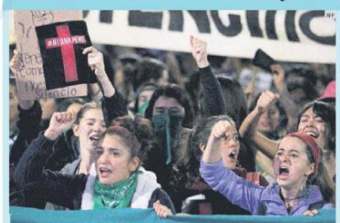
EXIGENCIA. Bajo el recuerdo de aquellas que han sido asesinadas o desaparecidas, alrededor de 500 mujeres marcharon en Guadalajara por el Día Internacional para la Erradicación de la Violencia contra la Mujer. Partieron desde Avenida Federalismo hasta el Parque Revolución, donde prendieron veladoras a manera de homenaje. En la Rambla Catauña llevaron a cabo un performance. Entre enero y octubre de este año, en Jalisco se han registrado 38 homicidios por razones de género, un alza de 73% en comparación con 2018.