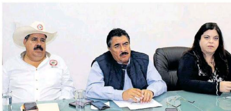
La dirigencia estatal del PRI en conferencia de prensa.