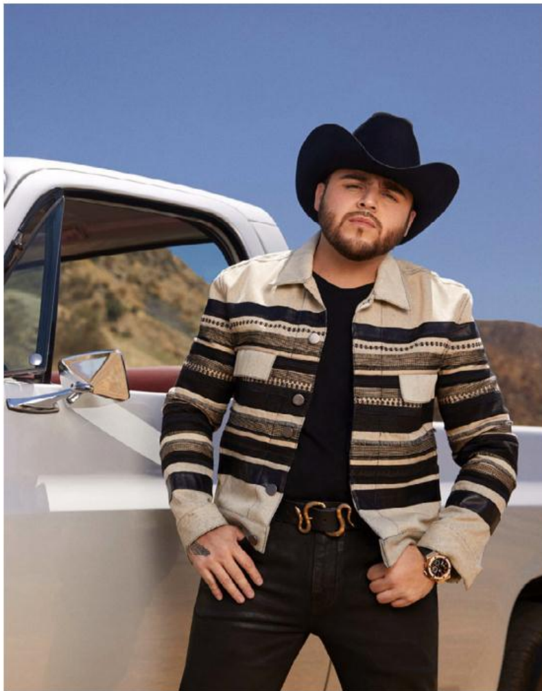
En su momento, el intérprete ofreció una disculpa por el videoclip.

Además, en 2016, el gobierno de Jalisco inició un procedimiento legal por apología del delito y en aquel entonces fue declarado persona non grata por la Fiscalía del Estado.