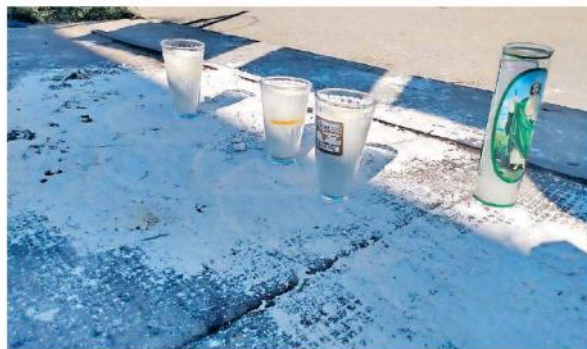
Familiares y amigos de las víctimas colocaron unas veladoras en el lugar de los hechos, en memoria de los fallecidos. ROMÁN ORTEGA

Una mujer, que solo se identificó como Jimena, detalló a los daños sufridos por impactos de bala tanto en el medidor de luz su casa como en su camioneta, esta última con el parabrisas estrellado. Mientras señalaba con su mano derecha el medidor de luz y el impacto de la camioneta, comentaba durante la balacera se quisieron meter a su casa. Tal vez, dijo, los que eran agredidos se quisieron refugiar, pero no pudieron entrar.