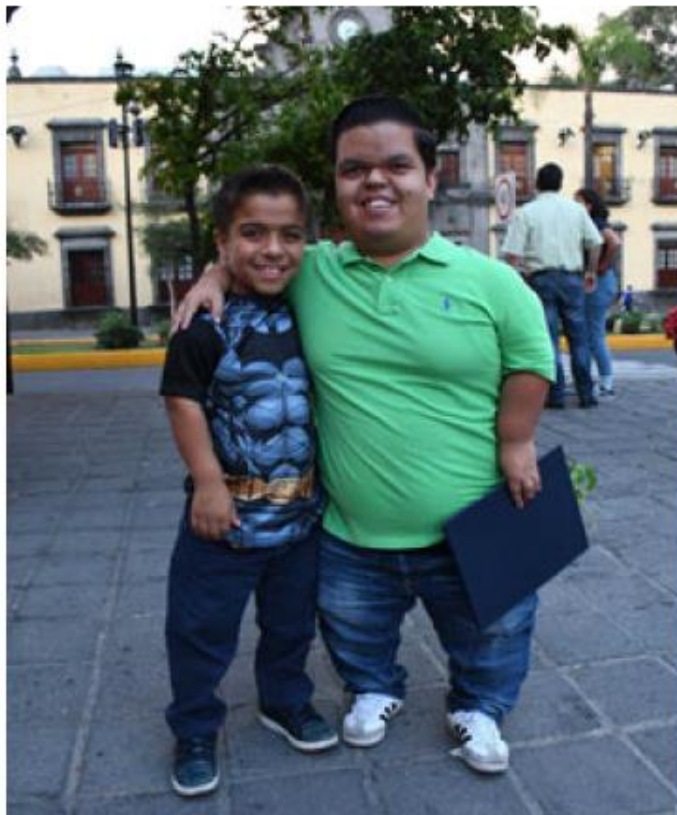
Desde 2013 se celebra esta fecha.

“No importa cuánto medimos, no importa cuánto pesamos, no importa de qué color somos, no importa que discapacidad tenemos, Zapopan va a estar hecho para todos y eso estamos trabajando día a día (...) Nunca más volveremos a ser invisibles, porque nos vamos encargar que, no solo las personas con talla baja, sino las personas con discapa-