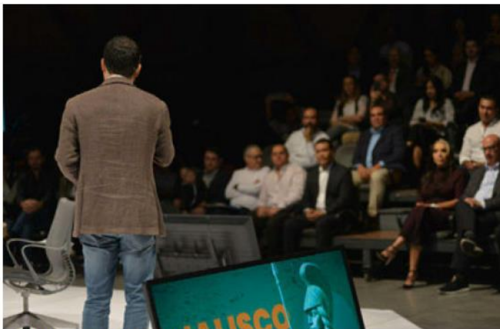
MC ha presentado 74 iniciativas en la Cámara Alta.