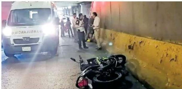
Los tripulantes de la moto cayeron y se impactaron contra el muro.

De forma extraoficial, se informó que aparentemente las víctimas son padre e hijo. Los patrulleros dijeron que no hallaron testigos que les dieran información de los causantes.