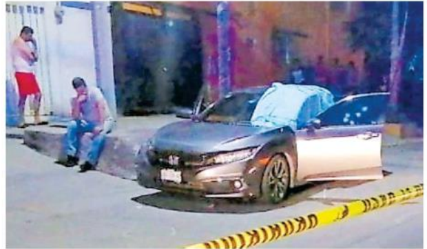
Sujetos armados atacaron a un par de hermanos que circulaban en un vehículo.

móvil con seis impactos de bala en la ventanilla del conductor. A un costado del coche, las autoridades hallaron tres casquillos de calibre, 9 milímetros.