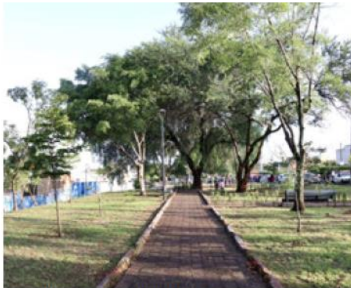
En total se han recuperado 521 mil. CORTESÍA

Algunas de las dependencias involucradas fueron Participación Ciudadana, la Gerencia de la zona, Parques y Jardines, Aseo Público y Mejoramiento Urbano. Destacó el funcionario que especialmente en el parque San Elías buscarán implementar una estrategia para evitar la acumulación de basura en la zona, fomentando la responsabilidad entre los vecinos. ■