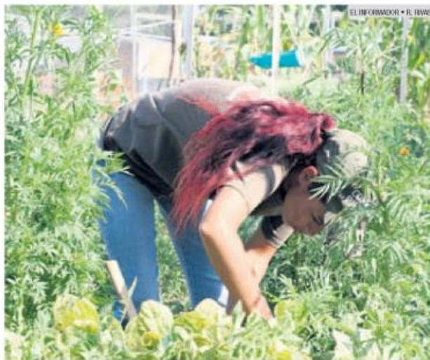
CRECIMIENTO. El Ayuntamiento de Tlajomulco busca abrir siete huertos más.

Las plantas que se entregan son las que se generan en los huertos.