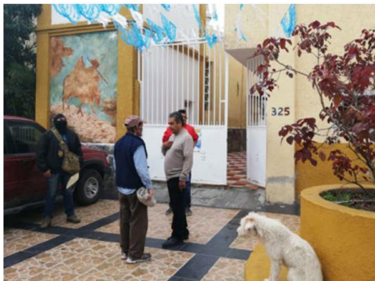
También los extorsionaron y les robaron 40 mil pesos. ELSAMARSHA GUTIÉRREZ

"Abro la puerta, fui por una pluma y una papeleta para llenar el juramento, y entonces saca las armas