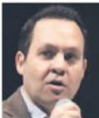
Clemente Castañeda, senador de MC por Jalisco.

Resaltó la defensa que se hizo de la propuesta de incrementar los derechos de agua que afectaba a los campesinos y que se eliminó gracias al bloque de oposición.