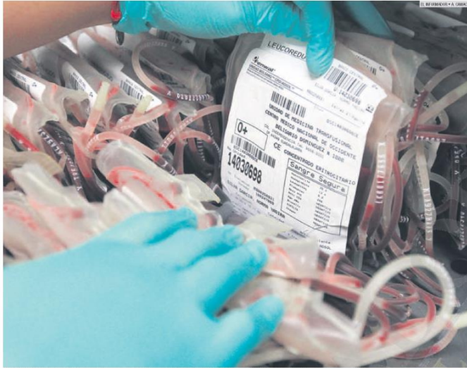
AL MÍNIMO. Debido a la escasa cultura de la donación en México, sólo los familiares de pacientes acostumburan a donar su sangre.

SALUD PÚBLICA FALSOS DONADORES, IMPUNES AFUERA DE LOS HOSPITALES CIVILES