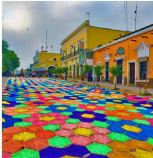
Se creó con 8 mil 248 carpetas hexagonales, hechas con rafia de diferentes colores.