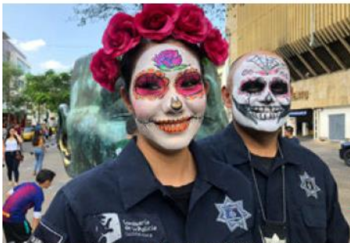
Elementos de la Comisaría Municipal. ERICK BREGUER

Será a partir del jueves primero de noviembre que, un total de 18 elementos de la Comisaría Municipal estarán personificados de calaveras en distintos lugares públicos de la ciudad de Guadalajara. ■