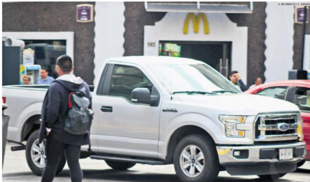
CASTIGO. La sanción por circular con los vidrios polarizados puede llegar hasta los 425 pesos.