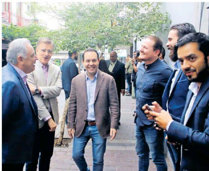
El senador Clemente Castañeda a su llegada al informe.

Aseveró que la estrategia de la militarización no funcionará para sacar adelante al país, por lo que llamó a realizar un gran