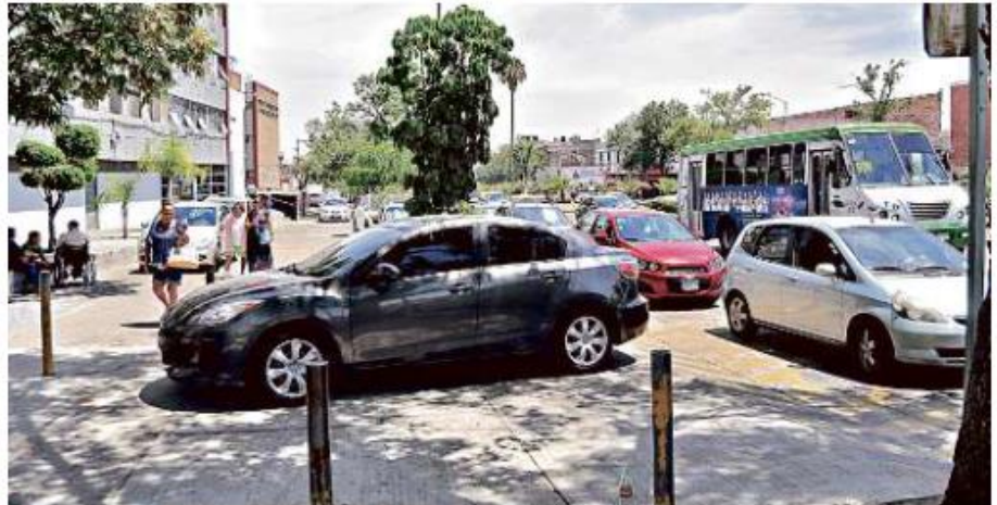
La invasión de banquetas, como en Federalismo y Juan de la Barrera, es común pese a multas.

También es común ver vehículos estacionados en la ciclovía de Washington o Niños Héroes, así como automóviles estorbando el paso