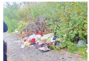
Policías hallaron un cadáver envuelto en una cobija.

En el sitio, los policías hallaron un cadáver envuelto en una cobija en color verde, atado desde el cuello hasta los pies; tenía calzado deportivo en color blanco.