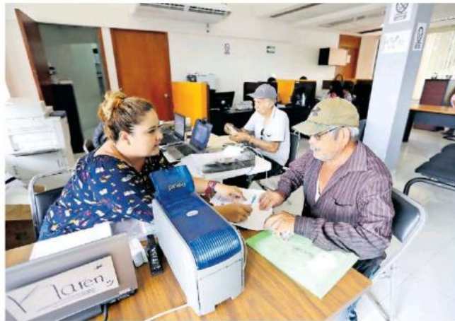
El proceso de entrega se hace si se cumple con los requisitos.

El resto de los domicilios y horarios de los módulos se pueden consultar en: https://gobjal.mx/ConvocatoriaMiPasaje .