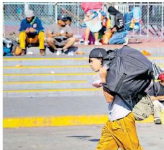
El refugio de migrantes ha brindado miles de servicios.