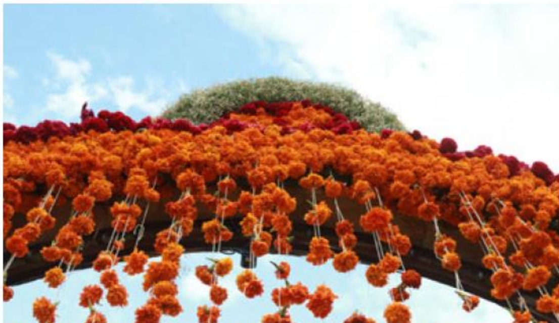
La flor de cempasúchil es un elemento crucial para la festividad.