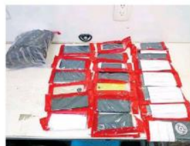
Este fue señalado del robo de móviles en el Festival Coordinada.

Hasta este sábado ya habían sido resguardados varios equipos a sus propietarios. Quienes deseen recuperar su celular,