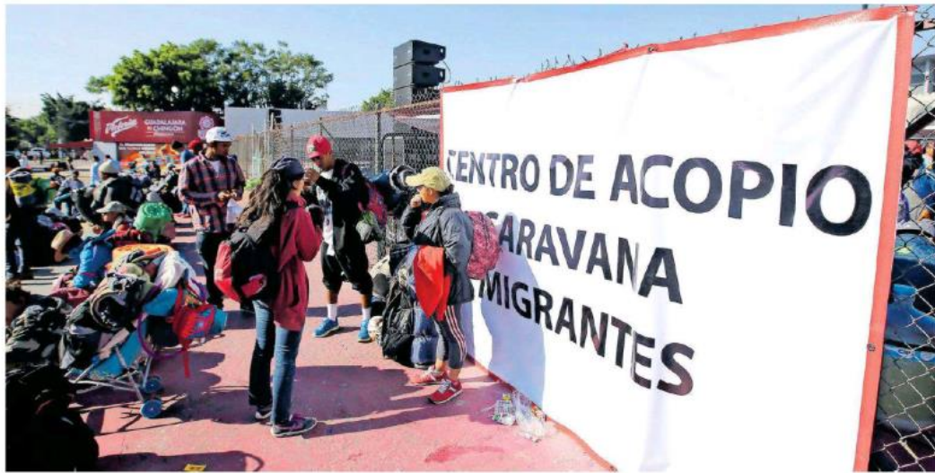
Desde la llegada de la caravana, la casa ha funcionado de refugio.