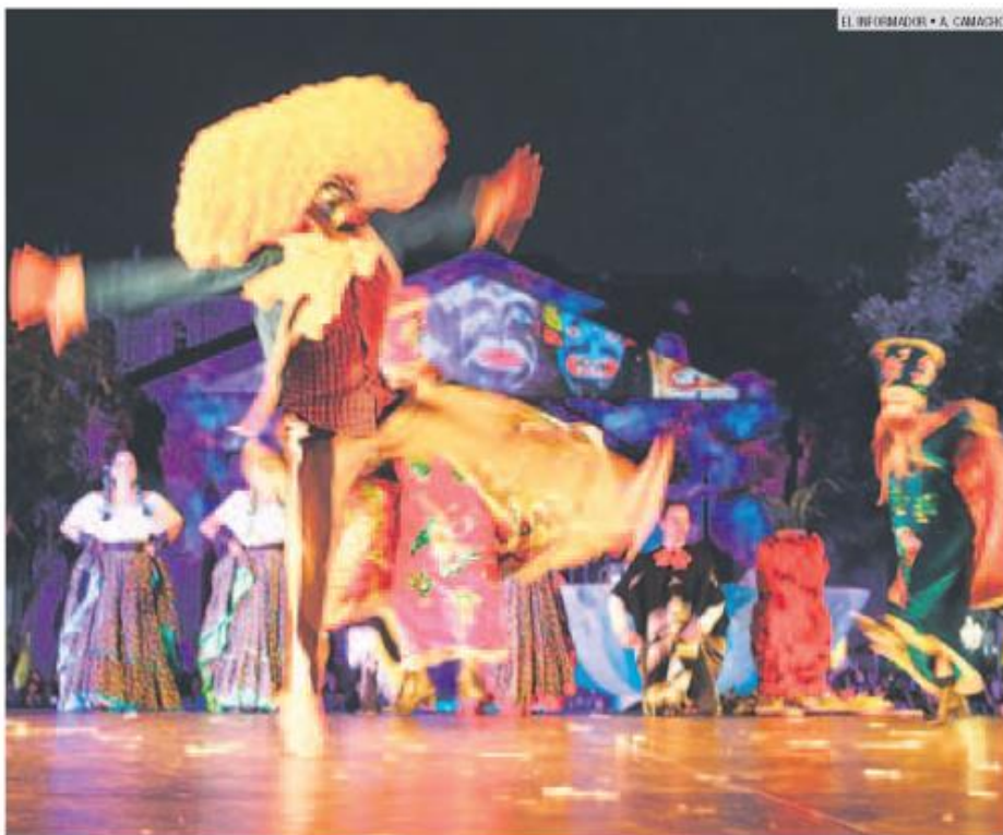
CIUDAD DANZA. En total, 117 artistas nutrieron el show principal en el escenario montado en la Plaza de la Liberación.

Más tarde, la sede del acto inaugural fue la misma Plaza de la Liberación, donde desde las 16:00 horas el público fue calentando motores con algunos espectáculos para más tarde recibir (a las 20:30 horas) el show inaugural: "La Ciudad Danza", producción del dúo tapatío escénico Pardo-Heli, con 117 artistas en escena, quienes arrancaron los aplausos en cada acto grupal realizado con música en vivo y teniendo como fondo el Teatro Degollado.