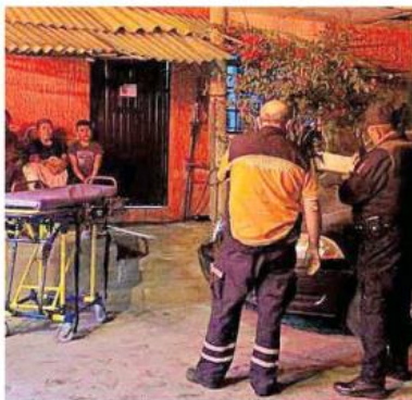
La mujer llegó a una casa para pedir ayuda; fue atendida.

Agentes de la Fiscalía del Estado llegó al sitio para llevar a cabo las investigaciones del caso.