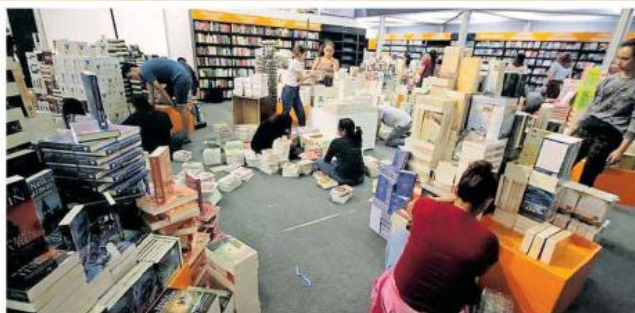
El país invitado es India, pero hay visitantes de todas partes del mundo.

Una de las tradiciones que generó esta feria es sin duda el reconocimiento de escritores, editoriales, promotores de la lectura y recientemente a los moneros, son sin duda los premios que se entrega día a día, el principal de ellos hasta hace unos años llevaba el nombre del escritor jalisciense Juan Rulfo, pero por cuestiones familiares y de marca se dejó de utilizarlo y se dio paso al Premio FIL en Lengua Romances.