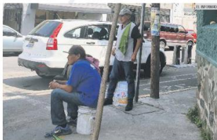
CAZAR AUTOS. Aprovecharse del espacio público es una falta al Reglamento municipal.

Los operativos de Guadalajara se basan en el Reglamento de Policía y Buen Gobierno, que establece como una falta "impedir, obstaculizar o estorbar de cualquier forma el uso de la vía pública, la libertad de tránsito o de acción de las personas, siempre que no exista permiso ni causa justificada para ello".