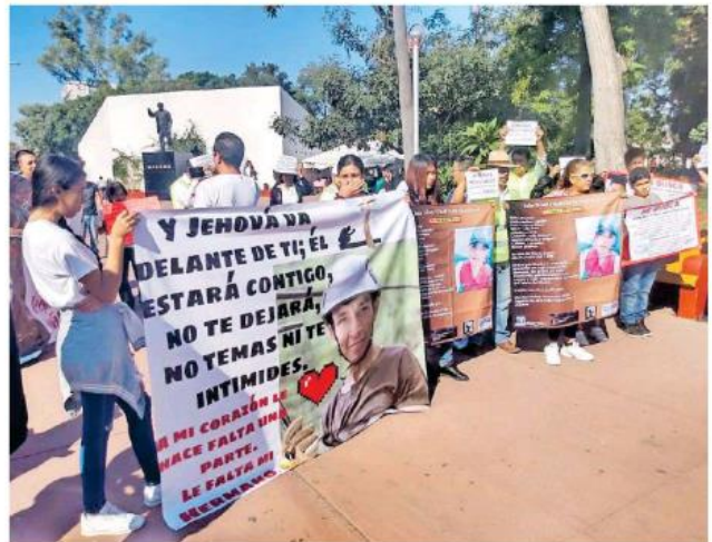
En su trayecto los participantes gritaban consignas: ¡Vivos se los llevaron, vivos los queremos! ROMÁN ORTEGA

'Fue a llevar pasaje ya de ahí ya no supe de él le notificaron que se lo habían llevado. Hasta ahorita la fiscalía no me ha dado ningún motivo. No entiendo el porqué va uno a la fiscalía, no hay nada, que