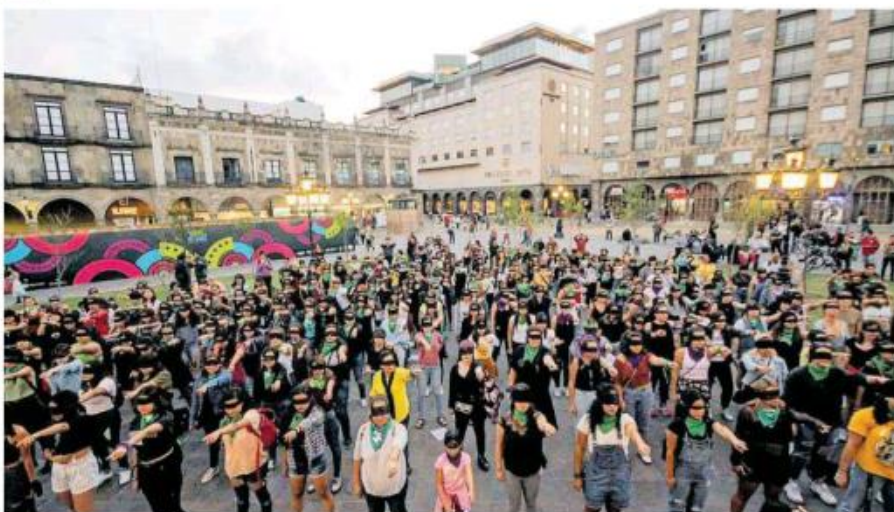
Todas ellas se colocaron una venda de color negro en los ojos y un paño verde en el cuello.

MUJERES APROXIMADAMENTE se dieron cita en la manifestación