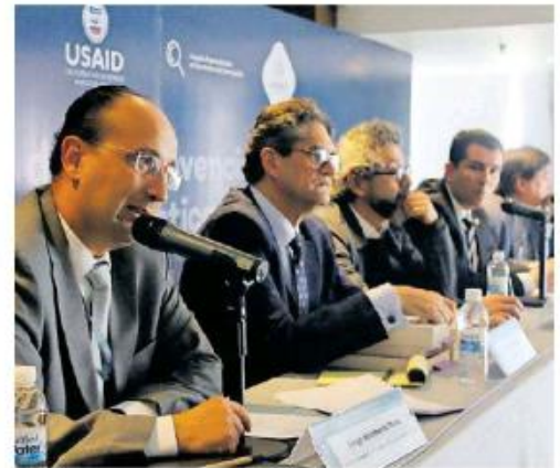
Se informó que existen otros exfuncionarios involucrados en el tema. A MAGAÑA

"El riesgo que está corriendo es que si no cumple con los requisitos que le puso el juez de amparo, en consecuencia va a quedar sin efecto la suspensión y a partir