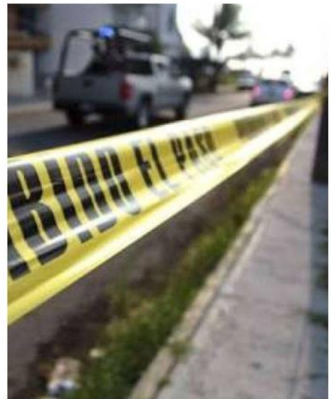
En el lugar se encontraron más de 100 casquillos.

Ayer el gobernador, Enrique Alfaro Ramírez, realizó una gira por el municipio donde anunció obras. Horas más tarde, asesinaron a dos policías. Hasta el momento se desconoce, si el municipio realizará homenaje a los elementos. La Fiscalía Regional del Estado ya inició con las investigaciones para aclarar el móvil de la agresión. ■