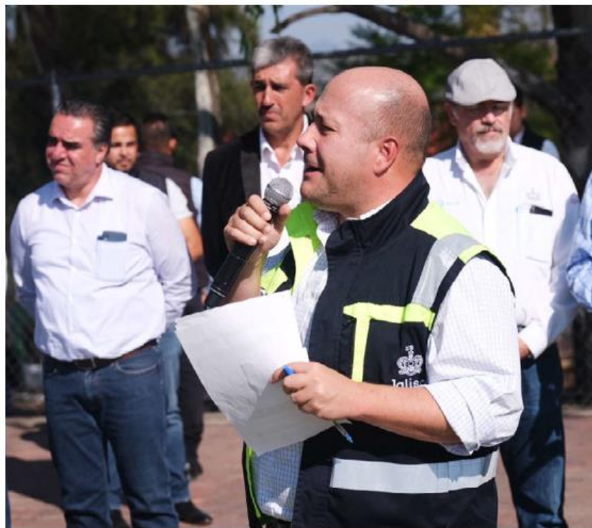
Pide que intervenga el gobierno federal.

Altos de Jalisco. El gobernador señaló que es un pendiente que resta capacidad y crecimiento económico en la zona