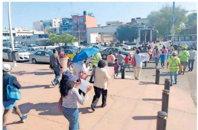
Familiares de personas desaparecidas marcharon este viernes.

no más están investigando', explicó su mamá Graciela Navarro.