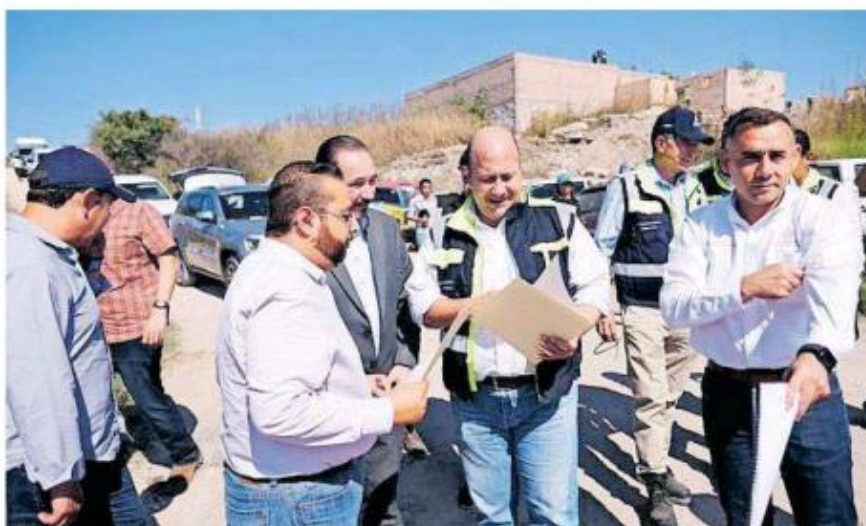
Alfaro Ramírez durante una gira de trabajo en diversos municipios de la de parte del estado.

“Nosotros entendemos que llegó el momento de acabar con ese problema histórico, no podemos crecer como región si no resolvemos el problema del agua, por eso le pedimos al Presidente de México que este proyecto se ponga como una altísima prioridad; el agua para los Altos de Jalisco y el agua para Guadalajara son prioridades de nuestro estado y creo que es momento de decirle a la federación que el tema de las aguas es un tema nacional, las aguas son nacionales y por más que yo