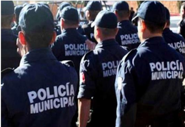
Resaltan importancia de solucionar déficit estatal de 8 mil elementos. ESPECIAL