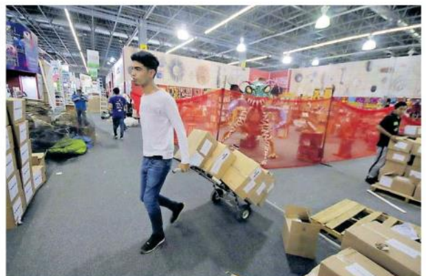
Cada editorial presentará sus mejores libros y algunos autores.