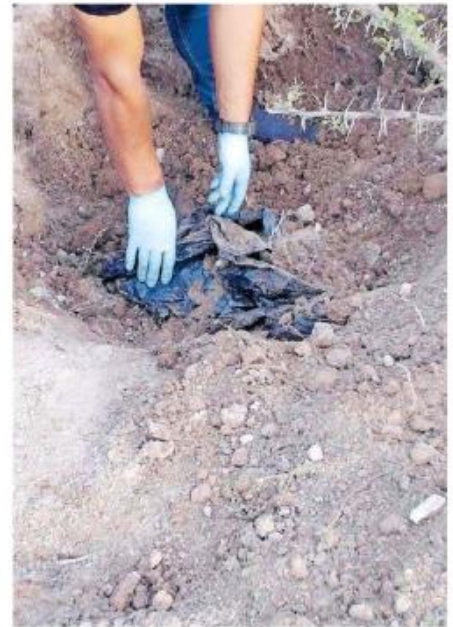
Un total de 16 personas fueron localizados en comunidad Chipinque.

De este punto, se tiene como resultado los cuerpos de ocho personas, quedando aún diversas secciones anatómicas en proceso de análisis.