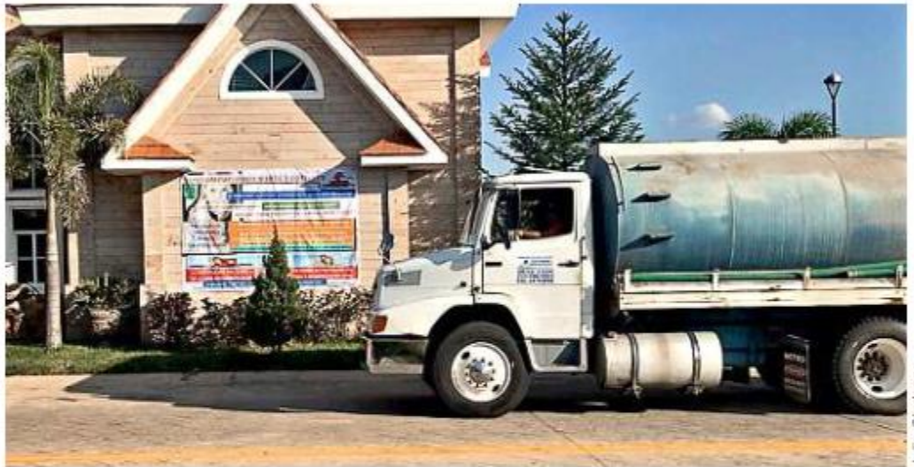
■ Vecinos han tenido que solicitar pipas y pagarlas ellos mismos ante la falla de un pozo.

Este desarrollo habitacional se abastece del acuífero de Toluquilla que registra un déficit hídrico de 72.9 millones de metros cúbicos de agua anuales, según la Co-