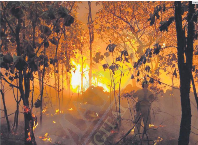
ESTADÍSTICA. Desde 2010 suman 243 averiguaciones previas o carpetas de investigación por delitos ambientales. Los incendios en La Primavera destacan en las denuncias.

“En materia ambiental veo un Estado fallido, porque el último instrumento para inhibir conductas que atentan contra el medio ambiente es letra muerta. Hay una impunidad tremenda”