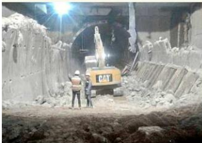
■ La construcción de la L3 ha tenido deficiencias como no respetar el proyecto, lo que causó demolición de dovelas.

Aunque el legislador no quiso dar nombres, refirió que desde el ámbito local se está trabajando en recabar pruebas para denunciar a ex funcionarios que habrían incurrido en irregularidades en la obra.