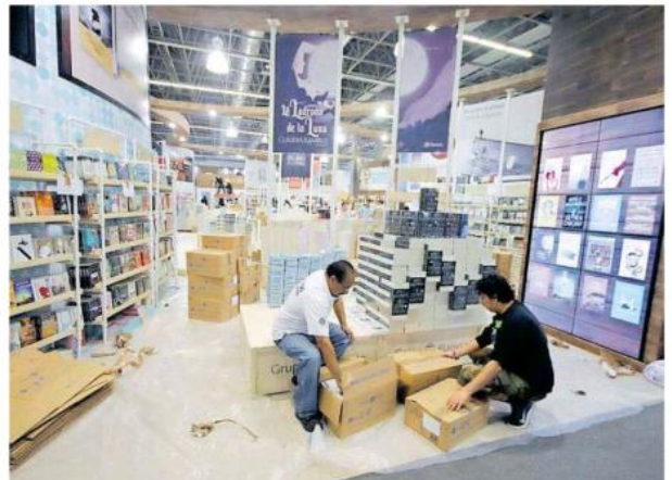
Hasta ayer en la tarde, trabajaban a marchas forzadas.