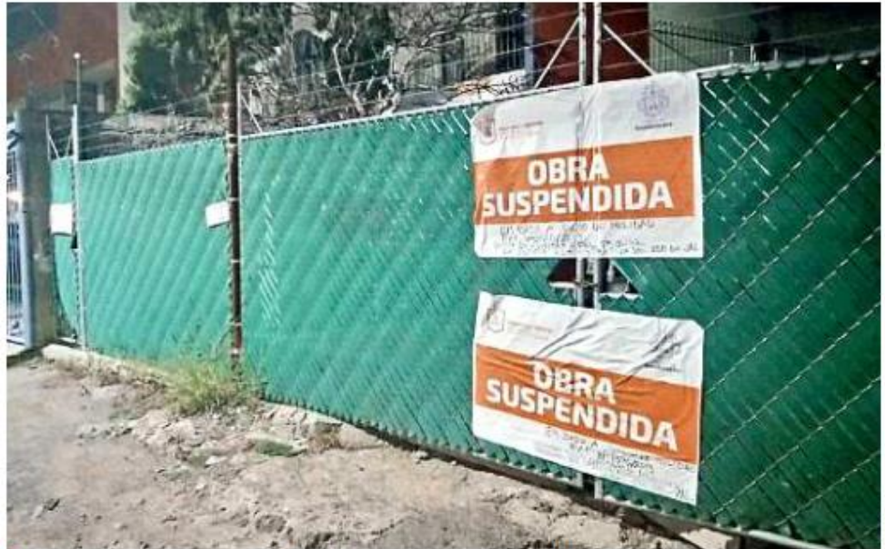
Atendiendo la orden judicial, Guadalajara acudió a colocar los sellos de suspensión a la obra.

La suspensión de obra la ordenó la Tercera Sala Unitaria del Tribunal de Justicia Administrativa (TAE) dentro del expediente 1976/2109 donde también mandata “congelar” las licencias y el proyecto, es decir, no se puede modificar los documentos.