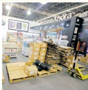
Por estos pasillos caminarán los miles de visitantes.

de sus suspiros estuvo presente cada año, a él se suman Mario Vargas Llosa, Arturo Pérez Reberte, el polémico escritor Salman Rushdie, pero también estadistas de la talla del israelí Shimón Peres, el alcalde de la ciudad de Los Ángeles, José Antonio Villaraigosa, así como los últimos presidentes de México.