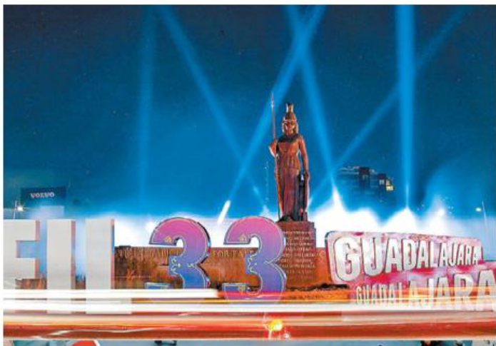
¡México nunca será invitado a la FIL, pues el anfitrión no se invita solo!

Sangre, raza, apellido, nacionalidad: no se ve ni se entiende cómo unos pueden ser mejores que otros