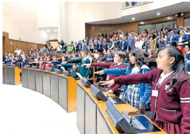
Se distinguieron por su civilidad y compromiso.

El Parlamento Infantil lo organizó el Poder Legislativo, la Secretaría de Educación, la Universidad de Guadalajara y el Instituto Electoral y de Participación Ciudadana.