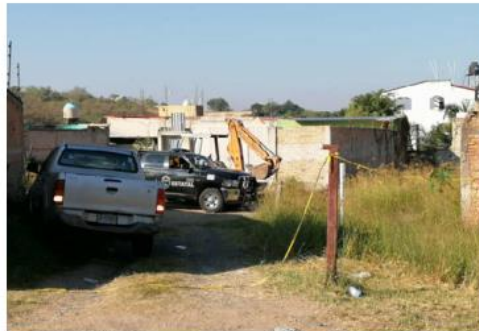
Ya suman 155. JUAN CARLOS MUNGUÍA

Ese día, los efectivos detectaron al conductor de un vehículo señalado de cometer privaciones ilegales de la libertad, por lo que procedieron a detenerlo y lograron liberar a ocho víctimas de una bodega donde. Los trabajos continuaran hasta que se tenga la certeza de que no hay más restos humanos en el sitio. ■