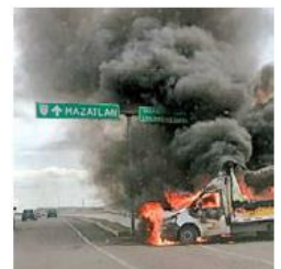
Violencia en México. ESPECIAL