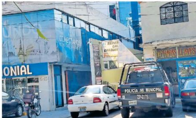
Los integrantes de la familia estaban dando mantenimiento a las antenas de una compañía telefónica. ELIZABETH IBAL

Los integrantes de la familia estaban dando mantenimiento a las antenas de una compañía telefónica por parte de la