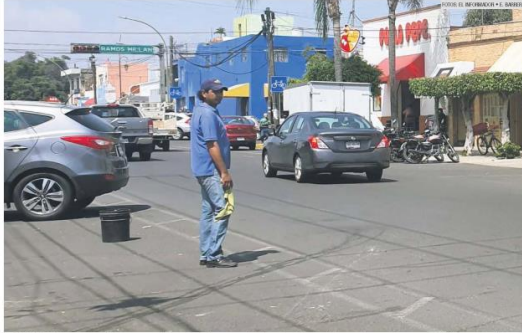
BARRIO LLENÓ. En Santa Teres se concentran las movilizaciones del Ayuntamiento tapatío, pero los apartalugares continúan operando.

ESPACIOS PÚBLICOS APARTALUGARES BURLAN OPERATIVOS DE GUADALAJARA