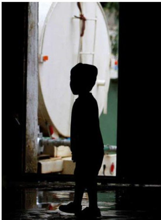
El acusado no se presentó a trabajar ayer.

“Mi niño me comenta que el señor del aseo lo metió al baño sin que él quisiera, dice que el niño le decía ‘no, yo no tengo ganas de hacer del baño’, que el conserje lo metió y él solo se baja el pantaloncito para hacer y que le dijo ‘ya vio que no tengo ganas de hacer del baño del baño’, y que le dijo ‘pues para la otra debes hacer del baño’, y me lo cacheteó”, añadió la mamá. ■