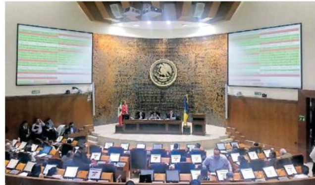
Ayer llegó la notificación al Congreso del Estado.

nalidad, que puso el pasado 10 de octubre, la CNDH argumento que los Derechos fundamentales que estima violados son: Derecho de acceso a la información; Principio de máxima publicidad en el acceso a la información.