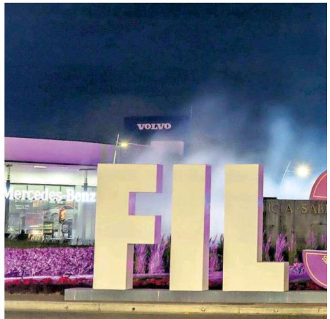
Durante los nueve días de la Feria, el público escucha a sus autores preferidos, la industria del libro convierte a Guadalajara en su corazón.