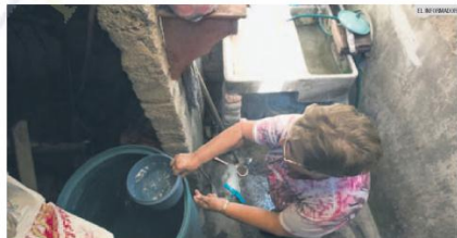
AJUSTE. El SIAPA ajustará los precios para abastecer de agua a la metrópoli.

Para alertar el pronto pago el SIAPA distribuyó los recibos con el estimado anual desde la primera quincena de diciembre.