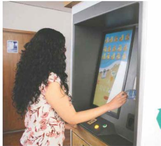
ENTRADA: IMAGEN A.I. DEBTO. MEXICOPVA

Lo anterior, además de ser la parte de retorno económico para la empresa, permite que el jugador—quien tiene cinco opciones de juego en el software—, pueda ganar premios de las marcas. Es decir, una vez que se introduce el envase, se juega, y si gana, la máquina emite un mensaje de Whatsapp a tu número de celular con un código QR, mismo que se canjea en puntos específicos de acuerdo con el