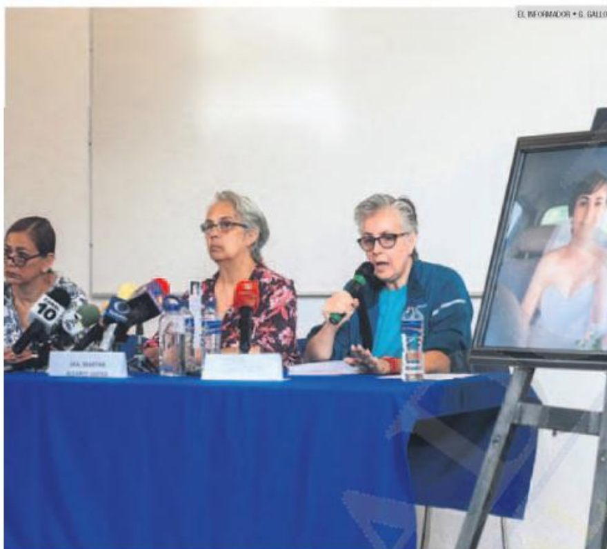
CUESTIONAMIENTOS. La familia de una de las víctimas busca que se haga justicia.

El hecho ocurrió en el cruce de Avenida Tepeyac y Playa de Hornos, en Zapopan. Te-