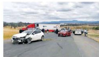
Tras el percance se reportaron 5 heridos y 4 vehículos involucrados.

En el lugar se localizó también a un hombre y una mujer, los cuales fallecieron después de que el vehículo en el que viajaban giró sobre sus ruedas y se abrió la puerta trasera, quedando los mismos fuera del vehículo. Una de las víctimas mortales se calcula que tenía 44 años y la otra 19. Presumiblemente estas per-