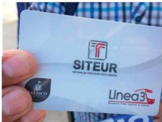
Los equipos de venta y recarga de tarjetas comenzarán a instalarse en la línea.

El Siteur dio a conocer que para operar la nueva Línea 3 del Tren Ligero, se van a contratar a 314 personas.