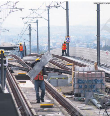
CONVENIOS. La SCT asegura que las empresas contratistas de la L3 no han incumplido los contratos establecidos.