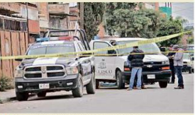
En Santa Paula, Tonalá, fueron asesinados dos hombres.

En este caso, las autoridades tampoco supieron el lugar que habría causado las heridas que presentaba.