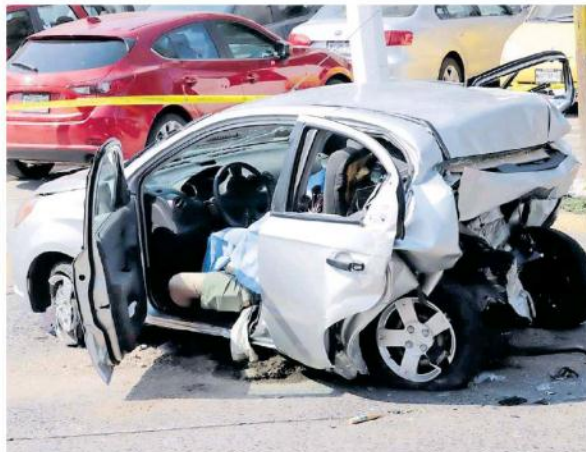
El accidente ocurrió el pasado 23 de junio en calles de Zapopan.

Este también recordó que el pasado 13 de diciembre a solicitud de la defensa del futbolista se realizó una audiencia para revisar la medida cautelar, sin embargo el juez de Control al escuchar ambas partes y tras una intensa discusión, determinó