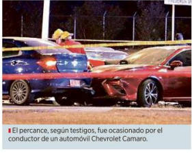
El percance, según testigos, fue ocasionado por el conductor de un automóvil Chevrolet Camaro.

De la persona responsable, usuarios de redes sociales han difundido imágenes de una mujer que presuntamente sería la conductora del Camaro, a quien apodan a Lady Camaró, no obstante, la Fiscalía no confirmó o descartó este señalamiento.