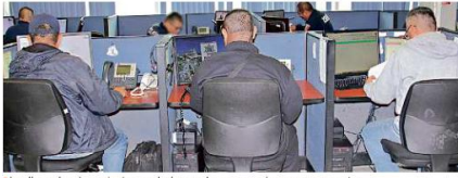
Las llamadas sin contestar en el número de emergencias van en aumento.

En números absolutos, el Centro Integral de Comunicaciones (Ceico), encargado de procesar los enlaces en la zona metropolitana, recibió