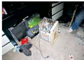
Tras el hecho, su esposa embarazada también recibió descarga.

"Solo se encontraba el aparato del cual estaba utilizando para hacer un trabajo en un cuadro de madera. Era un horno de microondas (...) Estaba utilizando un caudín conectado al horno de microondas del cual recibió una descarga y lo proyectó