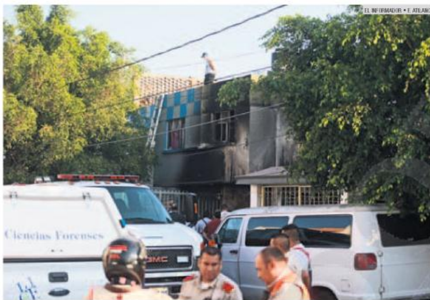
PREVENCIÓN. Las autoridades recomiendan revisar las instalaciones eléctricas para evitar incendios.

Este medio de comunicación registró que al menos nueve personas han muerto este año por conflagraciones en inmuebles