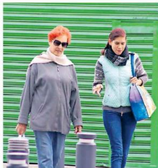
Se prevé la entrada del frente frío 27. AURELIO MAGANA.

Otros más, admitieron que se esperaron para iniciar su recorrido acostumbrado a media mañana, pues creyeron más