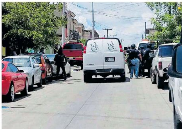
Los lamentables hechos se dieron en los municipios de Zapopan y Tonalá.

Al arribo de las autoridades localizaron un vehículo Nissan Tsuru, color gris sin reporte de robo, impactado en un poste. Abordo se encontraron dos hombres sin vida, mismos que presentaban lesiones de proyectiles de arma de fuego. Ambos estaban muertos.