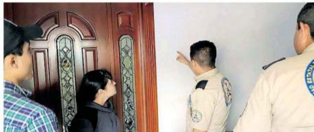
Elementos de Protección Civil verifican cada una de las casas.

Se sumaron a la comitiva seis elementos de la Unidad Estatal de Protección Civil y Bomberos Jalisco (UEPCBJ), seis de la Secretaría de Gestión Integral del Agua (SGIA) y tres de Secretaría General de Go-