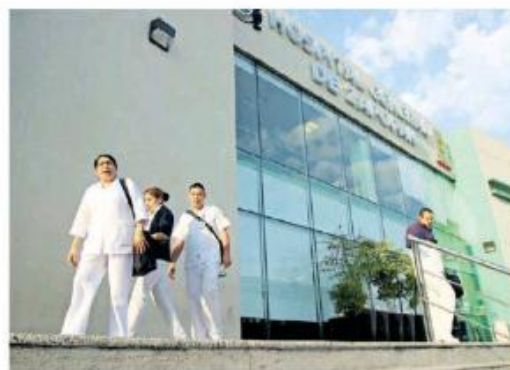
El Seguro Popular no será vigente el 1 de enero.

“Pese a esta medida de carácter federal que afectaría directamente a la población