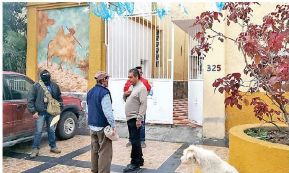
La Casa del Migrante se ubica en San Pedro Tlaquepaque. ELSA MARTHA GUTIÉRREZ

Ruiz Pérez relató que la noche del asalto, una pareja se acercó para pedirle un servicio religioso, al abrir la puerta de la casa parroquial, sacan las armas de fuego y entra un grupo armado para amedrentar a los presentes, "me someten en el suelo, y me empiezan a golpear para que les entre-