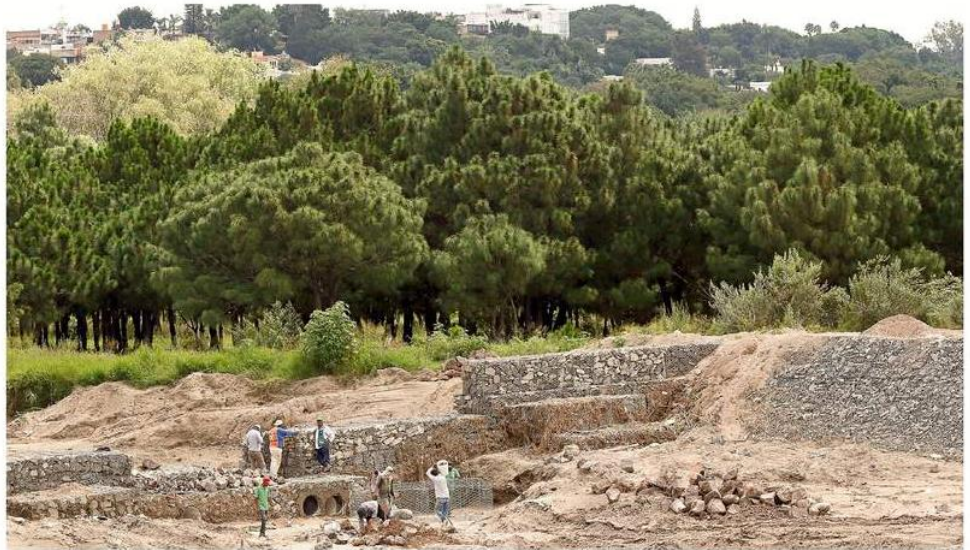
■ En Colomos III, el Gobierno ya comenzó a construir infraestructura para habilitar el Bosque Pedagógico del Agua.

“Se está determinando que deje sin efectos el acuerdo que firmó el entonces Gobernador Jorge Aristóteles