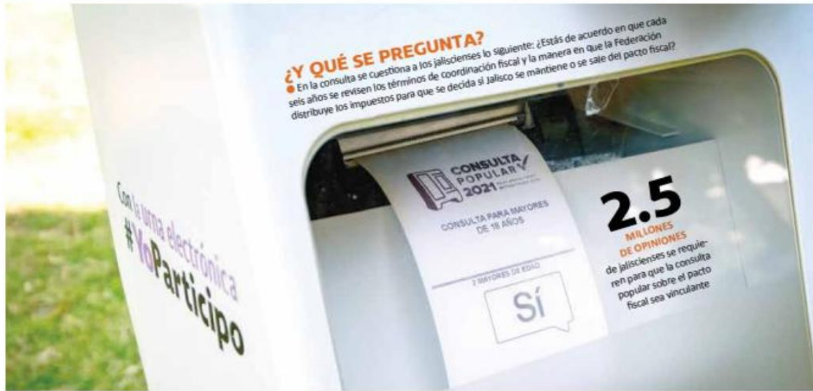
EN UNOS DÍAS. La consulta popular terminará con la jornada del 18 y 19 de diciembre.