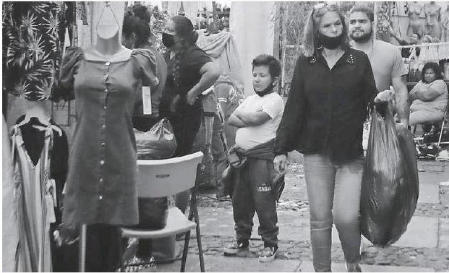
Reactivación económica por temporada navideña.