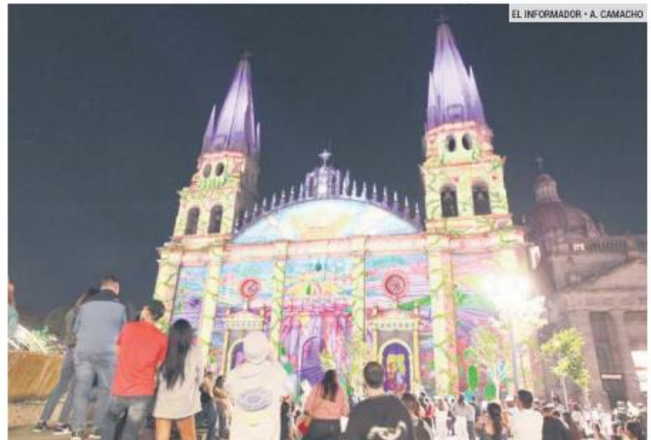
CENTRO TAPATÍO. El videomapping es parte de las actividades en el evento navideño.

A partir del 9 de diciembre habrá presentaciones de la Orquesta Filarmónica de Jalisco en el Teatro Degollado y cinco presentaciones de la puesta en escena de "El Cascanueces" en la zona de El Santuario y de "Los