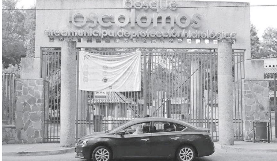
El bosque Colomos, un asunto que impacta al espacio público.