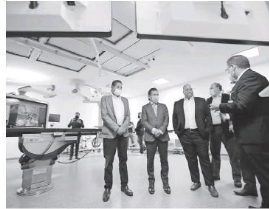
Las vanguardistas instalaciones del hospital.

Por su parte, el alcalde de Guadalajara, Pablo Lemus Navarro, señaló que con este tipo de hospitales, la ciudad podría ser la capital del Turismo Médico a nivel nacional: "Tenemos grandes hospitales, grandes médicos, tenemos grandes oportunidades para desarrollar en ello, Guadalajara tiene esta vertiente como la capital médico a nivel nacional, y entre todos podemos consolidarlo".