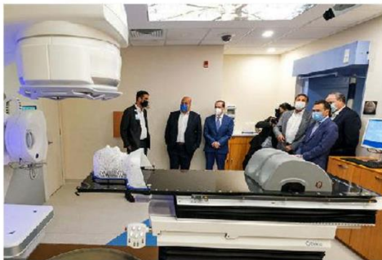
La obra tuvo una inversión de mil 200 mdp. ESPECIAL