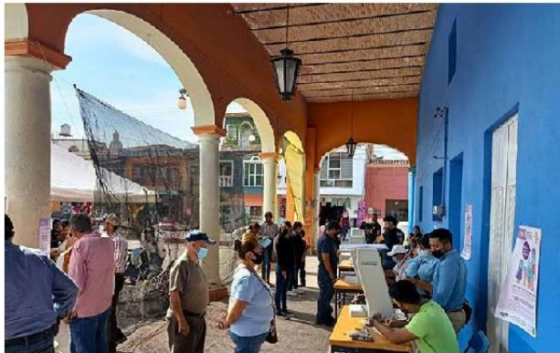
Este fin de semana se instalaron más de mil urnas electrónicas.