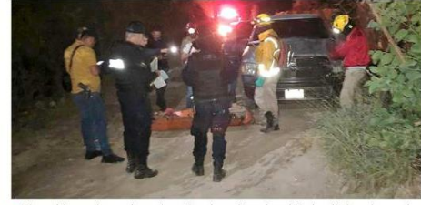
El cadáver de un hombre fue localizado el 5 de diciembre, al fondo de la Barranca de Huentitán.