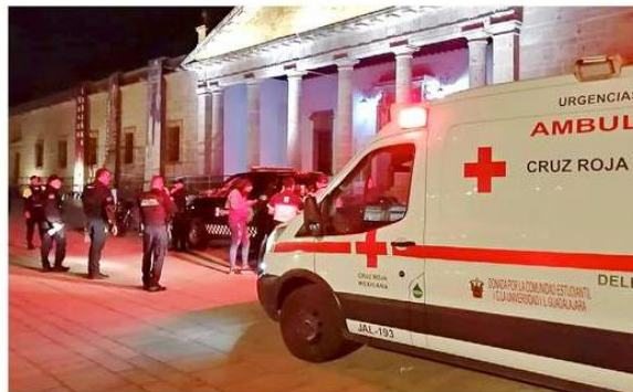
■ No se esclareció desde cuándo fueron puestas en cautiverio las personas afectadas.

habitación número 10 encontramos en el lugar a tres masculinos y una mujer, estos hincados y maniatados”, aclaró el entrevistado de la Comisaría Tapatía.