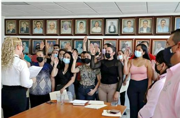
El Congreso estatal designó a 11 concejales el 30 de septiembre, mientras se realizan nuevas elecciones.

Pese a ello, en agosto, el Tribunal Electoral del Estado de Jalisco (Triejal) declaró nula la elección en Jilotlán de los Dolores.