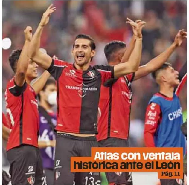
Atlas con ventaja histórica ante el León Pág. 11

Cancha. El encuentro entre ambas escuadras será inédito.