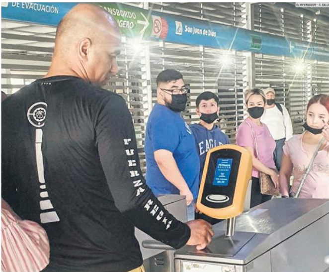
DESCONFIANZA. El Gobierno estatal está lejos de la meta para que todos los usuarios utilicen la tarjeta de prepago.

La falta de transparencia impide conocer cuántos recursos tiene el Fideicomiso del Sistema Integrado de Recaudado, a donde llegan los excedentes. El Sistema del Tren Eléctrico Urbano, del Macrobus y las empresas de los transportistas. “Eso no sucede, todas las empresas administran el dinero y cada transportista se queda con el excedente con el visto bueno de la autoridad”.