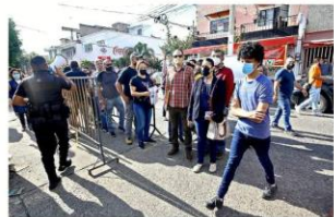
■ Las citas quedaron abiertas desde ayer. Recuerde tener a la mano CURP y expediente federal de vacunación.