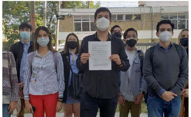
El regidor del Ayuntamiento de Zapopan presentó una denuncia. ESPECIAL