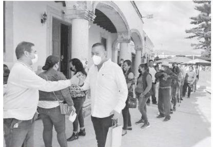
Casillas de votación el pasado domingo.

Según los datos otorgador por el Instituto Electoral y de Participación Ciudadana (IEOC) con un 97% de conteo de los centro de recolección de opinión, en las dos jornadas efectuadas el 27 y 28 de no-