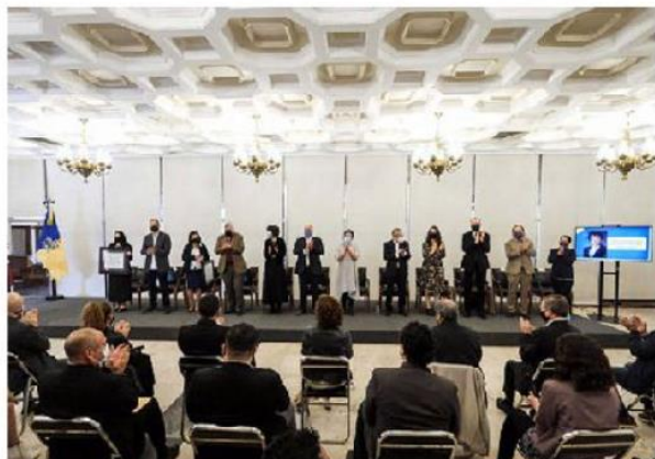
Reconocieron a ocho jaliscienses.