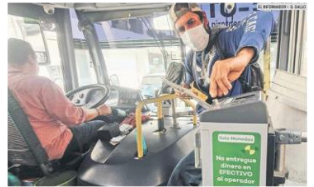
RECLAMOS. Continúan las quejas de usuarios por las máquinas que se quedan con 50 centavos por viaje.

De acuerdo con el sistema MIDE Jalisco, en 2020 se realizaron 74 millones 250 mil viajes en las rutas del Tren Ligero.