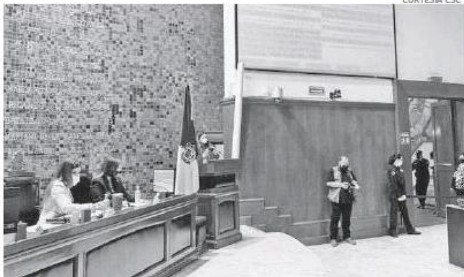
Conmemoración del 211 aniversario de la abolición de la esclavitud.

En Jalisco, "fuimos capaces de autolimitar esta libertad consagrada en nuestra carta magna, a fin de ser responsables ante una situación de pandemia que ninguno de nosotros habíamos vivido jamás, todo en pro de romper las cadenas de contagios y con ello disminuir las muertes y reducir el número de hospitalizados, para que nuestro sistema de salud no se viera