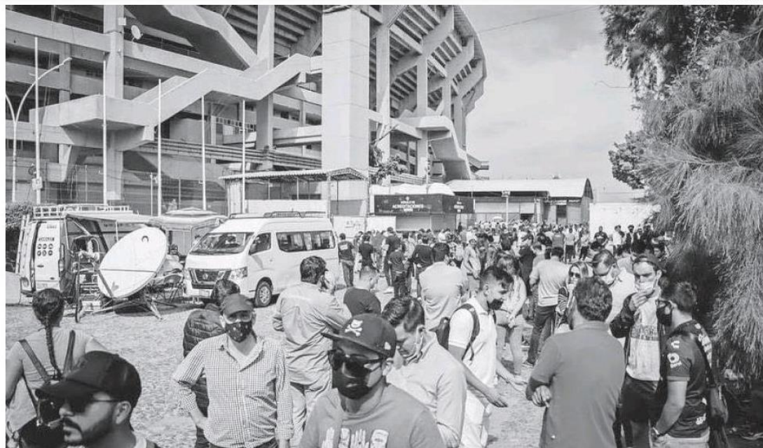
Desde temprano, miles de personas hicieron fila por un boleto.