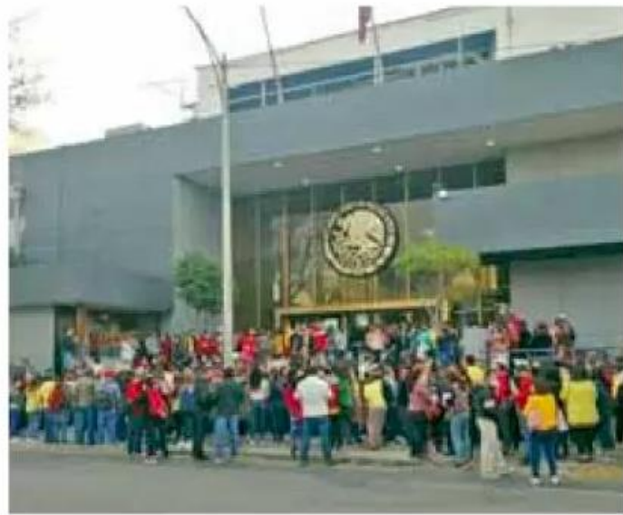
Sidedif. Aglutina tres mil trabajadores.