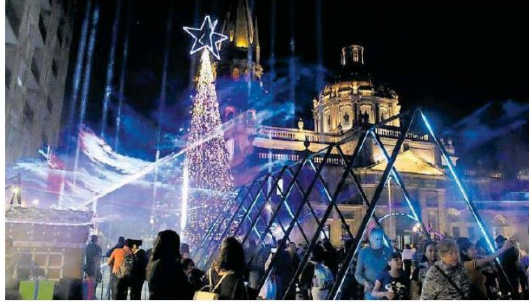
Luces y conciertos en el Centro Histórico de Guadalajara.

deñas comienza el 16 de diciembre, con la proyección de videomapping navideño en la Catedral, la apertura de un mercado navideño en Paseo Alcalde, donde además instalarán una pista de hielo para uso gratuito, frente a la Rotonda de los Jaliscienses Ilustres.