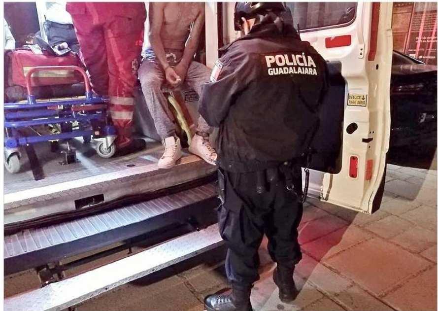
■ Servicios Médicos Municipales dieron atenciones a las cinco víctimas tras su liberación.