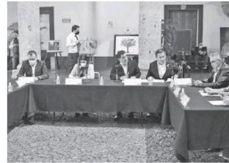
Reunión de la Junta de Coordinación.