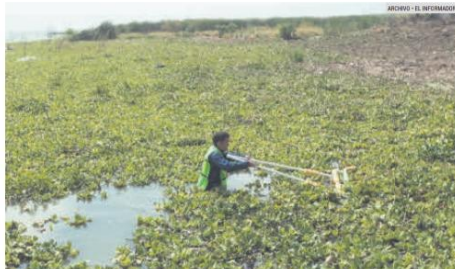
PERSISTE. La maleza acuática es un desafío para la actual administración.

En 2017 destinaron cinco millones para la adquisición de nueva maquinaria, como un tractor agrícola para la carga de la biomasa extraída, un vehículo terrestre doble tracción para el transporte del personal y desplazamiento de la maquinaria y una cosechadora anfibia de malezas acuáticas. A partir de 2018 a la fecha, no hay registro sobre el uso y destino del equipo adquirido para la limpieza del lago.