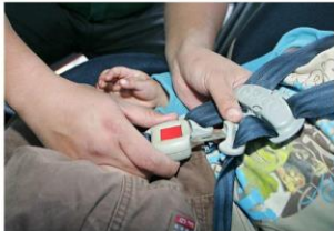
De enero a septiembre se han multado a 418 conductores por llevar a menores sin el sistema de retención.

Inclusivo, en 12 vehículos se llevaba al niño en las pier-