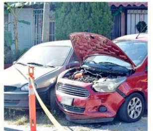
Un sujeto presuntamente arrolló a un hombre tras una riña y chocó con dos vehículos, en la Colonia Bosques del Centinela.