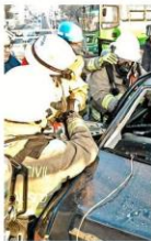
Una persona falleció tras un choque en Tlaquepaque.

Si requiere ayuda de Protección Civil y Bomberos de Zapopan puede llamar directamente al 333-818-2203.