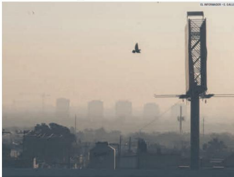
POLUCIÓN. En lo que va del año ha habido más de 57 episodios graves de mala calidad del aire en la metrópoli, lo que es cinco veces más que en 2020. En la imagen, la ciudad contaminada el día de ayer.