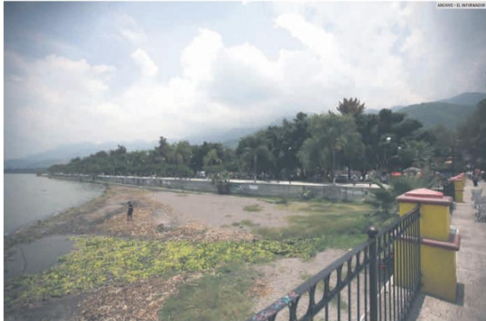
AMENAZAS. El lirio, la contaminación y el desperdicio de agua golpean constantemente a nuestro vaso lacustre