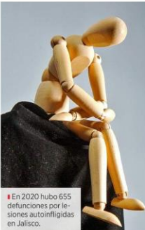
En 2020 hubo 655 defunciones por lesiones autoinfluidas en Jalisco.

En la mayoría de las situaciones que atiende la Unidad